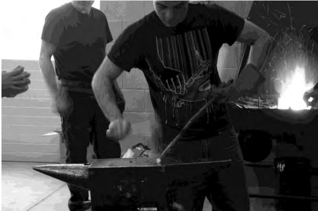
Taller de forja

En estos bloques temáticos, agrupados según especialidades, nos remitimos exclusivamente a las técnicas tradicionales, las que conoceríamos como propias de los oficios artísticos vinculados a la expresión tridimensional. Imaginemos que toda esta actividad se puede desarrollar con grupos de veinte estudiantes. He aquí el primer punto de mi reflexión y uno de los motivos por lo que hemos planteado el desarrollo de seminarios paralelos a la docencia.