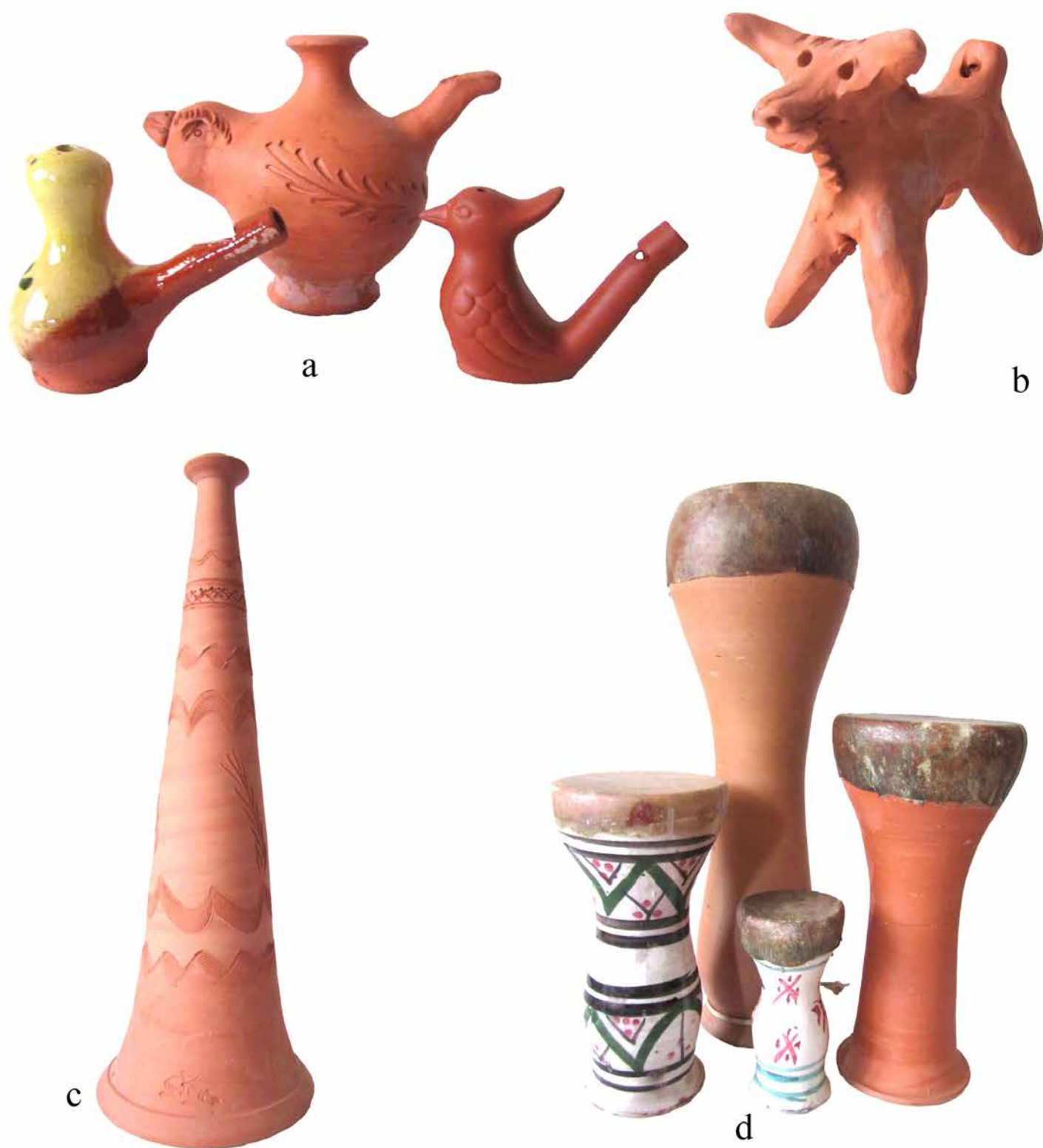
Fig. 2. a. Silbatos de agua (Tajueco y Villafranca de los Caballeros). b. Torico de Guadix. c. Trompeta o "caracola", Villafranca de los Caballeros. d. Distintos tipos de ta'arijas marroquíes.