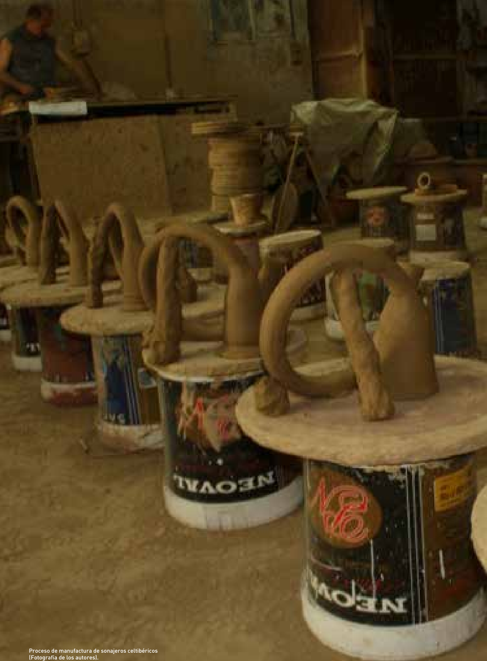
Proceso de manufactura de sonajeros celtibéricos (Fotografía de los autores).