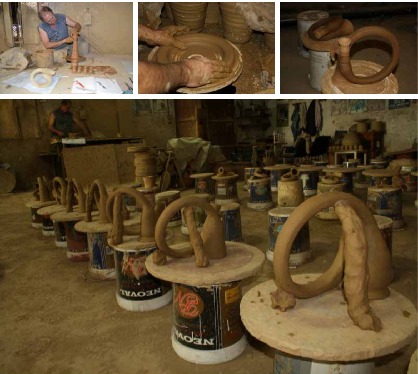
Lám. 3. Reproducción del proceso de manufactura de sonajeros celtibéricos.