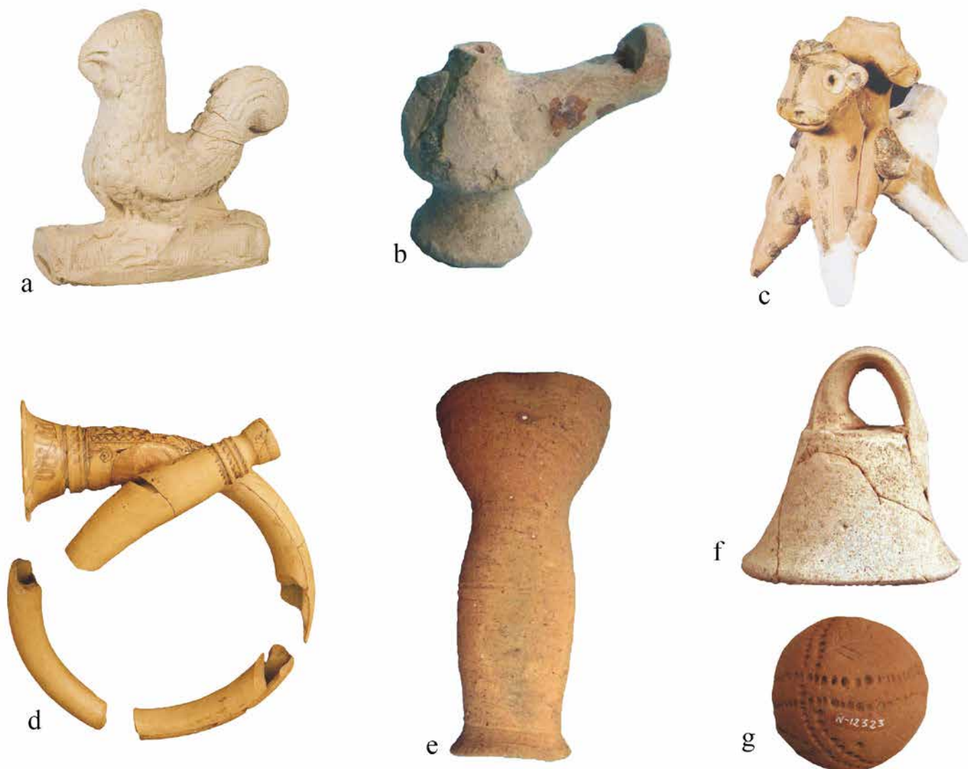
Fig. 1. a. Silbato zoomorfo de La Alhambra (Navarro Ortega, 2006: 203, nº 102). b. Silbato de agua de Córdoba –C/ María Auxiliadora– (Salinas Pleguezuelo, 2012: lam. 24-6). c. Silbato de La Alhambra (Navarro Ortega, 2006: 196, nº 81). d. Trompa de Numancia (Jiménez Pasalodos y García Benito, 2014: 119). e. Tambor de forma Campana de Almería (Navarro Ortega, 2006: 208). g. Sonajero de Numancia (Jiménez Pasalodos et al. , en prensa).

Si atendemos a su distribución por familias de índole musical (Fig. 1), tenemos 276 aerófonos (1 flauta o silbato, 219 silbatos y 56 trompas); 146 idiófonos (114 campanas, más dos badajos, y 30 sonajeros); 145 membranófonos catalogados (todos tambores); y ningún cordófono, ya que no es usual fabricar este tipo de objetos en material cerámico. Advertimos con estos datos que de entre todos los tipos de instrumentos musicales o artefactos sonoros que hay en cada una de estas familias musicales, en cerámica sólo se producen, por sus características particulares, una serie limitada de los mismos; en los aerófonos: silbatos –los más producidos a lo largo de casi todas las fases de la historia– (García Benito, 2011) y trompas –pertenecientes en un 98% a la II Edad del Hierro en contexto celtibérico con foco central en el