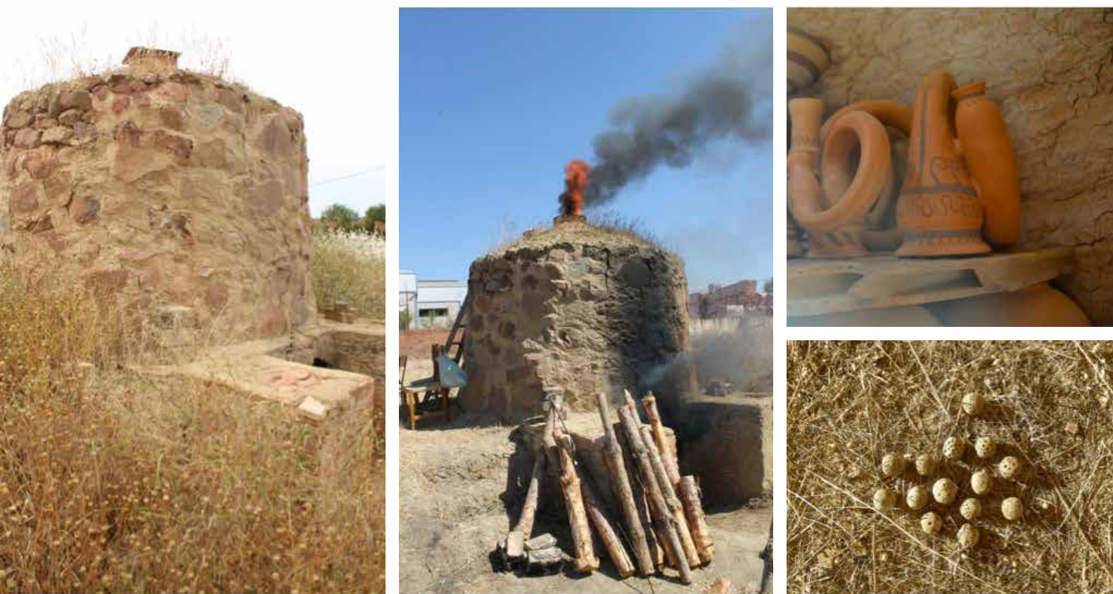
Lám. 1. (Izquierda) Reproducción experimental de un horno cerámico de la II Edad del Hierro. (Centro) Desarrollo de la fase de cocción. (Derecha) Reproducciones arqueológicas (trompas y sonajeros) fruto de la cocción experimental.