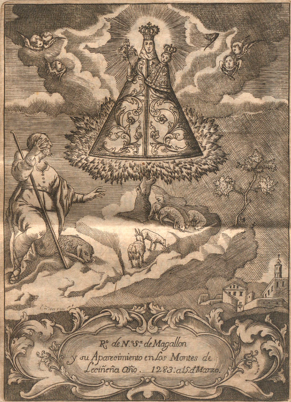
R o de N. ra S. ra de Magallon y su Aparcimiento en los Montes de Leciñeña Año. 1283. a. S. d. Marzo.