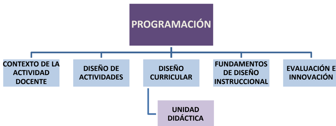
Figura 3. Trabajos asociados a la competencia n.4.

Para justificar el cumplimiento de esta competencia situó la programación como eje central y los principales trabajos que me han llevado a la interiorización de la organización y creación de la misma.