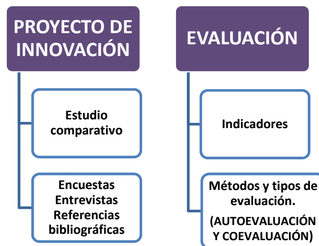
Figura 4. Trabajos asociados a la competencia 5. Elaboración propia.

Según Dewey “El núcleo del proceso de enseñanza consiste en el diseño de los ambientes donde los alumnos pueden interactuar y estudiar, de qué manera aprender” . La evaluación es una forma más de interacción y carácter más formativo, de estudio.