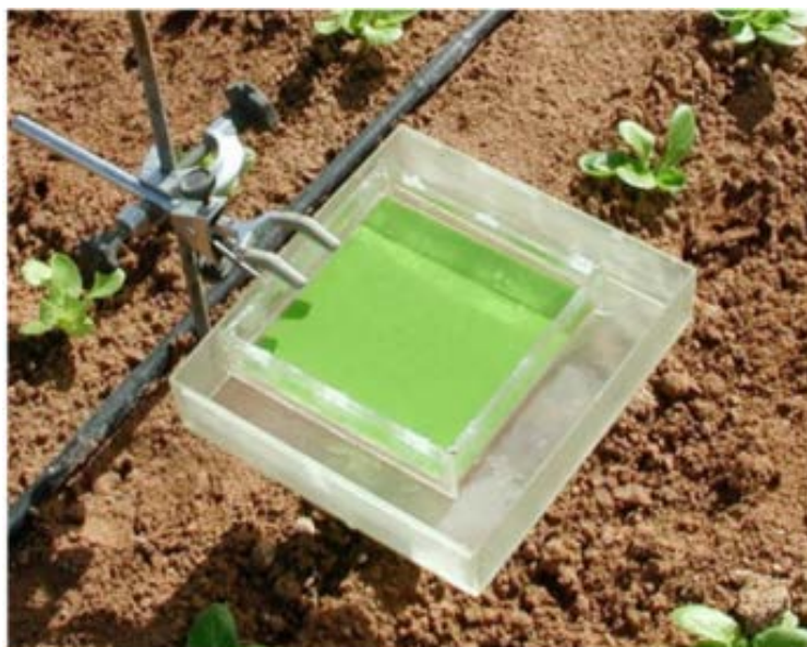
Figura 1. Trampa tipo Irwin

La trampa recomendada es de tipo Irwin, con una baldosa cerámica cuadrada de textura rugosa y un color que se asemeja al de las hojas de la planta. La reflectancia del color de la baldosa está basada en datos obtenidos del estudio de la reflectancia de las propias hojas [7]. La trampa se instala en una barra de metal vertical que se introduce en el suelo, sujeta de tal forma que permanece horizontal a la altura de la vegetación (Figura 1). La caja se llena con una solución al 50% de etilenglicol. El líquido reduce la evaporación y preserva los psílicos en mejores condiciones para su identificación. La presencia de un segundo contenedor debajo de la baldosa evita la pérdida de muestras de insectos por desbordamiento debido a las lluvias. Actualmente, el procedimiento habitual es visitar la trampa casi a diario para recoger los insectos capturados y realizar el mantenimiento de la trampa. Los insectos se preservan en una solución de alcohol al 70% y se identifican después visualmente.