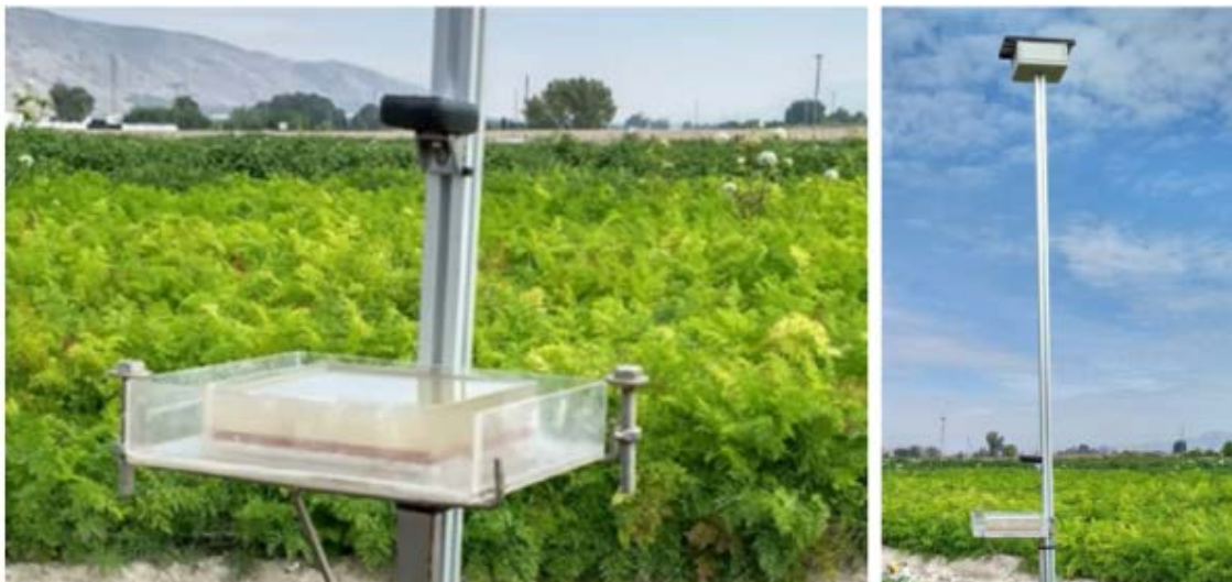
Figura 3. Detalle del prototipo construido

Otro problema encontrado fue que los niveles de batería del sistema disminuyeron progresivamente en el campo, lo que no se observó durante las pruebas de laboratorio. Probablemente ocurrió debido a la situación del panel solar en el campo, cerca de algunos árboles que podrían ensombrecer la trampa, o por problemas de baja cobertura de 3G que obligaron a reintentos continuos para enviar las imágenes. En el campo de ensayo la cobertura era escasa, lo que en ciertos momentos provocó transferencias muy lentas o fue directamente imposible realizarlas con éxito. Para resolver posibles fallos de comunicación, se programó un protocolo de transferencia que detecta estos fallos almacena los datos en una cola para posteriores intentos. Sin embargo, los reintentos continuos acortaron la vida útil de la batería, por lo que después de 15 reintentos, el equipo se suspende hasta la próxima sesión.