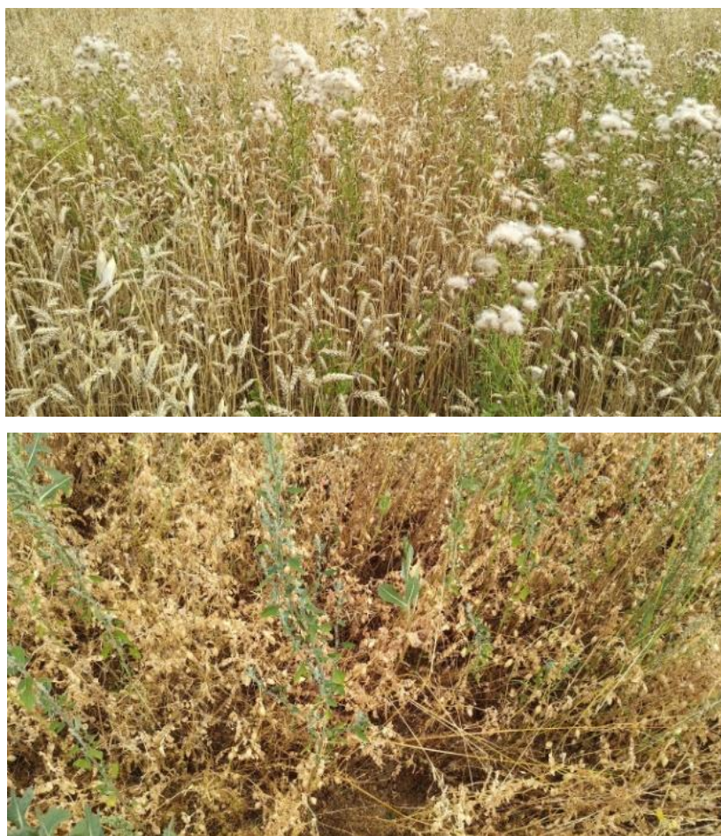
Figura 2. Malas hierbas en ensayos de trigo y garbanzo

Las Distintas letras dentro de una misma variable son significativamente diferentes para \alpha=0,05 (Duncan).