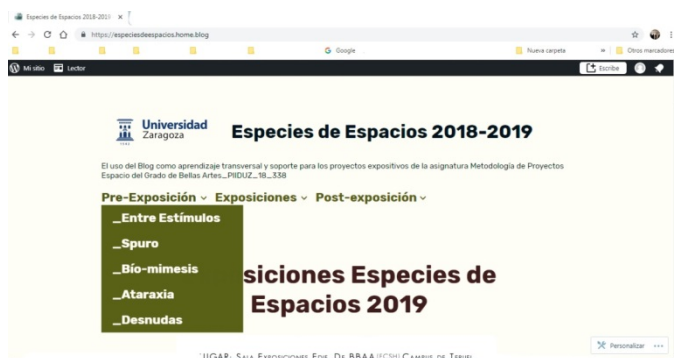
Figura 1. Captura de pantalla del blog. Pestaña Pre-exposición desplegada.

La acción docente se desarrolla a través de un seguimiento -clases teóricas, de taller y tutorías de grupo y personalizadas-, un análisis del desarrollo y resultados, la observación continua, puestas en común... La metodología es la de aprendizaje por proyectos, y, si además sus resultados son comunicados y visibilizados de modo público, resulta muy útil para la futura vida profesional de los estudiantes, siendo esto transferible a cualquier área de conocimiento.