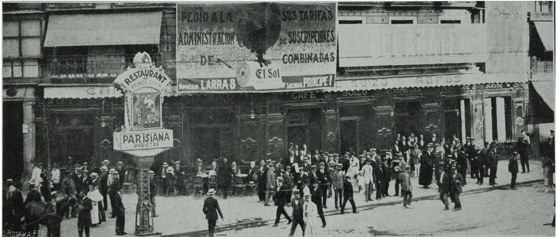
Fig. 5: Fachada del café Suizo (calle de Alcalá esquina con la calle de Sevilla), Madrid, 1919 ( La Esfera , Madrid, 2 de agosto de 1919) (Biblioteca de la Diputación Provincial de Zaragoza)