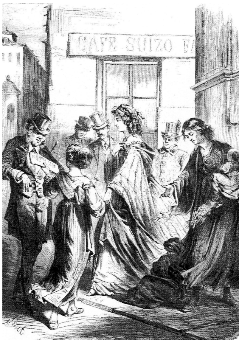
Fig. 2: La esquina de la calle de los Peligros y el café Suizo, Madrid, 1870 ( La Ilustración española y americana , Madrid, jueves 15 de diciembre de 1870) (Biblioteca de la Diputación Provincial de Zaragoza)