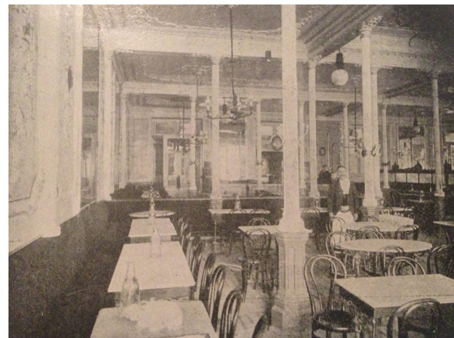
Fig. 3: Vista interior del café Suizo, Zaragoza, 1908 ( Guías Arco. Guía práctica de Zaragoza y su provincia , Madrid, Establecimiento Tipográfico de Antonio Marzo, 1908)

Su capacidad y confort fueron elogiados por la prensa madrileña: