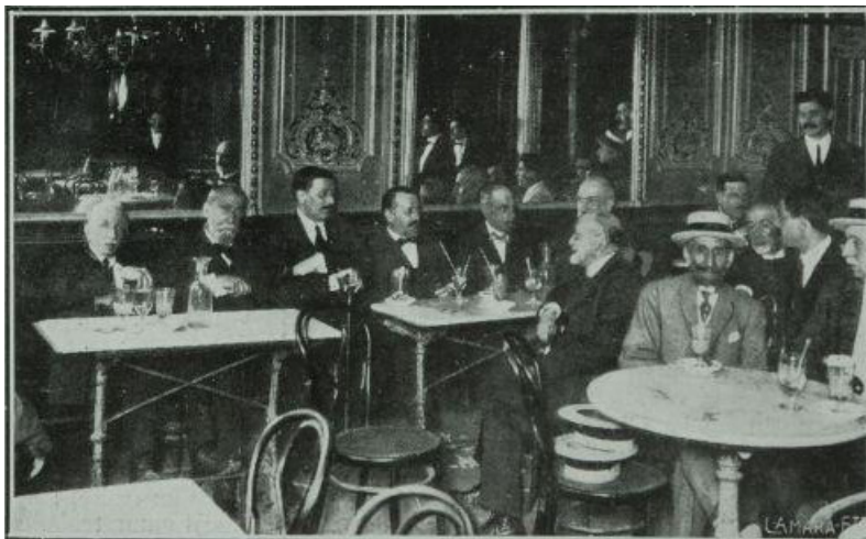
Fig. 7: Otro aspecto parcial de una de las tertulias celebradas en el café Suizo , Madrid, 1919 ( La Esfera , Madrid, 2 de agosto de 1919) (Biblioteca de la Diputación Provincial de Zaragoza)