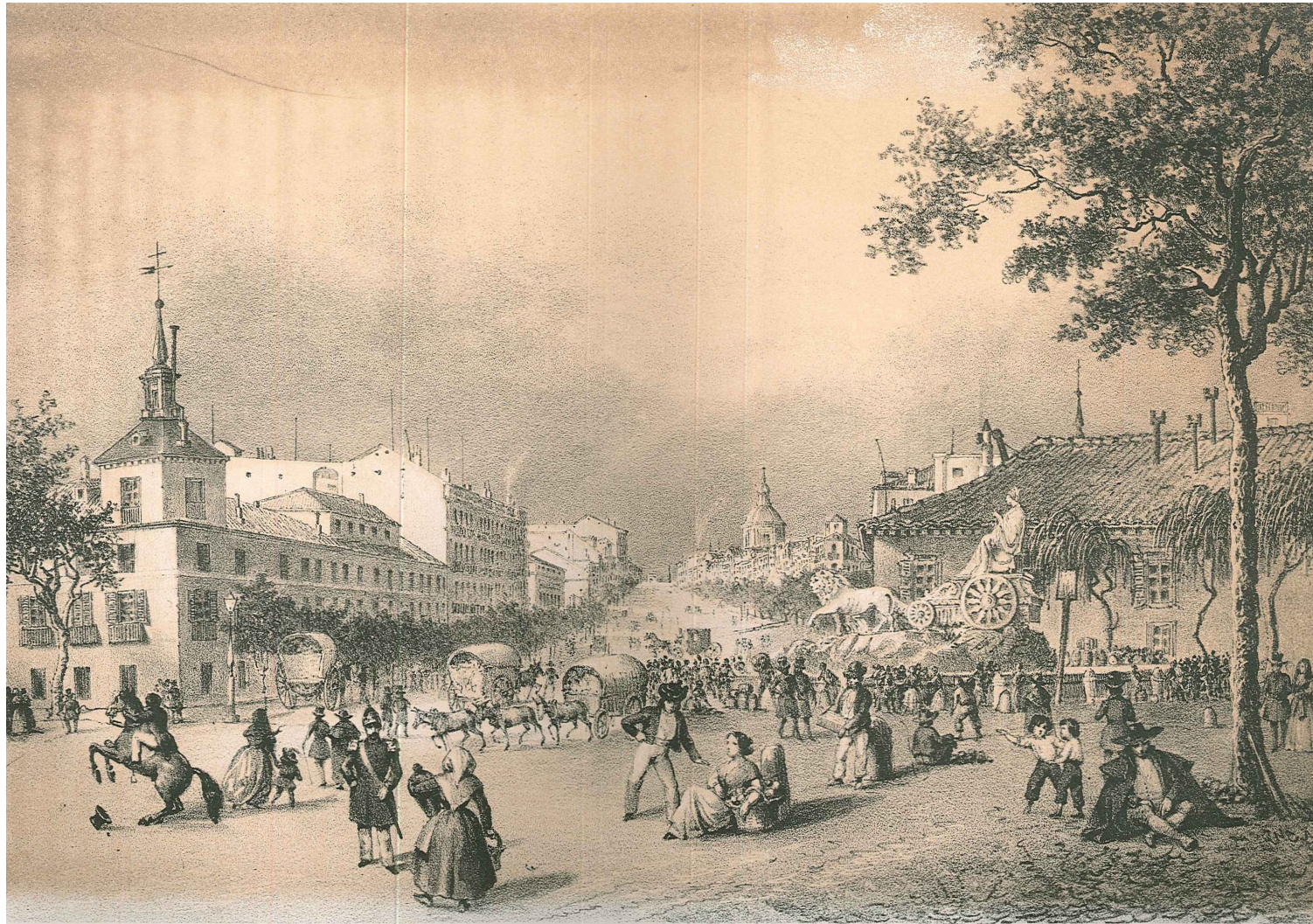
Fig. 1: Vista de la calle de Alcalá, Madrid. Dibujo del natural y litografía por F. J. Parcerisa, 1853 (Cuadrado, J. M. a , Recuerdos y Bellezas de España. Castilla la Nueva , Tomo I, Madrid, Imprenta de José Repullés, 1853) (Biblioteca de la Diputación Provincial de Zaragoza)