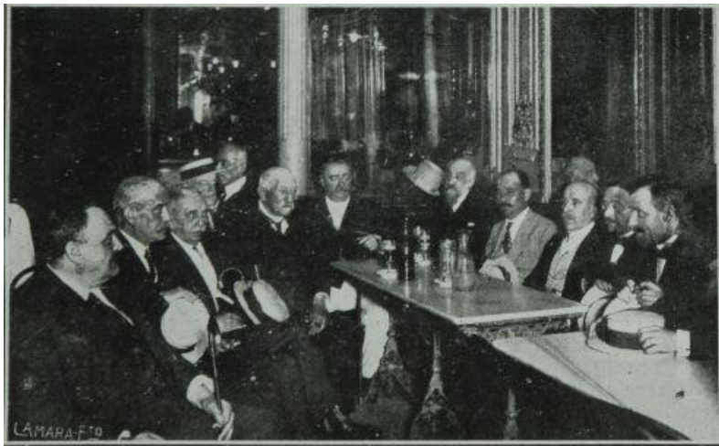
Fig. 6: Aspecto parcial de las tertulias celebradas en el café Suizo , Madrid, 1919 ( La Esfera , Madrid, 2 de agosto de 1919) (Biblioteca de la Diputación Provincial de Zaragoza)