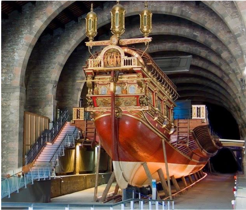
Réplica de La Real , la galera que tripulo Don Juan de Austria en la batalla de Lepanto (1571)