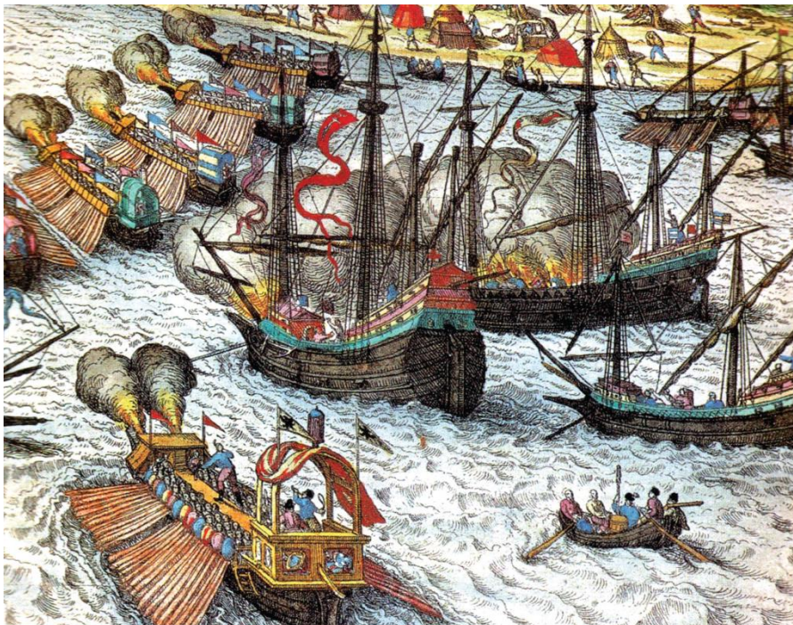
Galeras españolas bombardeando la Goleta en 1535

KONSTAM, Angus. The Barbary Pirates . Elite, 2016, Oxford. Pág. 28