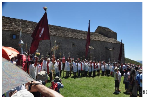
Fig 10.- Romería a Santa Orosia donde se ven las diferentes cruces representativas de cada lugar