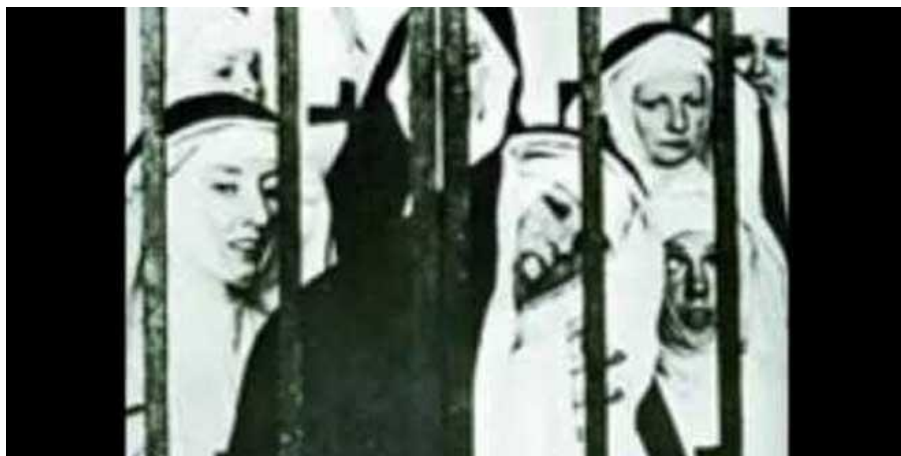
Fig 5.- Imágenes pertenecientes a las monjas endemoniadas del convento de San Plácido

Como vemos las endemoniadas estuvieron muy presentes durante la Edad Media y la Edad Moderna, y vemos muchos síntomas relacionados con los dados en las montañas de Jaca como puede ser el contagio, y como observamos todo eran mujeres al igual que en las montañas de Aragón, que normalmente eran mujeres aquellas que sufrían la posesión, puesto que se afirmaba que eran más vulnerables para la posesión del demonio.