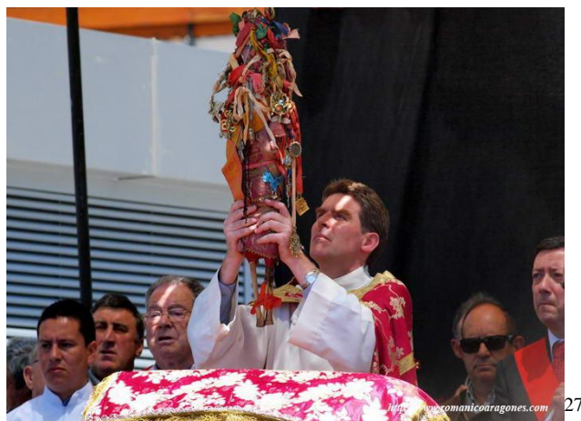
Fig 3 -El obispo de Jaca muestra a los fieles el día de la patrona de la localidad las reliquias del cuerpo de Santa Orosia tras la finalización de la procesión en honor a Santa Orosia.