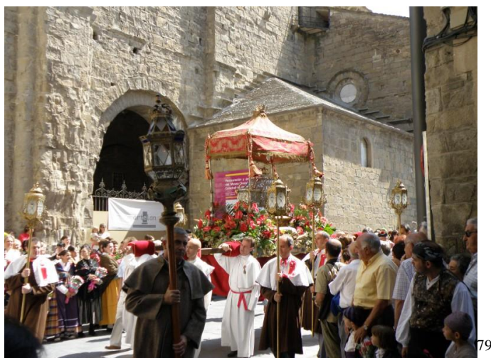
Fig 9.- Procesión de Santa Orosia en Jaca al paso por la Catedral de dicha localidad.

Esta procesión finalizaba en lo que es hoy la Plaza Biscós, donde se realizaba el complejo y la ceremonia, donde se enseñaban los mantos y la veneración de las reliquias, mientras que los exorcismos colectivos también culminaban en este momento.