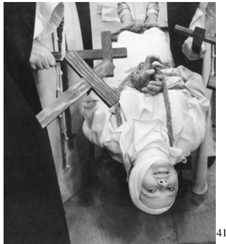
Fig 6. -Imagen sacada de una película que se inspiró en las endemoniadas de Loudun donde se narra en la película los exorcismos que sucedieron en este convento.

Al igual que en el convento de las monjas de San Placido, en Francia también hubo un brote de endemoniadas. En 1626 se funda en la ciudad de Loudun, un convento de monjas ursulinas, para reforzar la presencia del catolicismo en una población de la mayoría hugonotes. Las monjas afirmaban ver fantasmas y que ocurrían extraños sucesos en el monasterio durante las noches. Se certificó que las monjas estaban siendo poseídas por el demonio y para expulsar al demonio había que practicarles un exorcismo. Tras saber estos sucesos, Richelieu mandó arrasar el convento en el que las monjas habían sido poseídas condenando así pues estos sucesos demoniacos. Siendo así una medida de represión a las mujeres, y erradicando así el brote de histeria que podía contagiarse por toda la zona de Loudun. 40