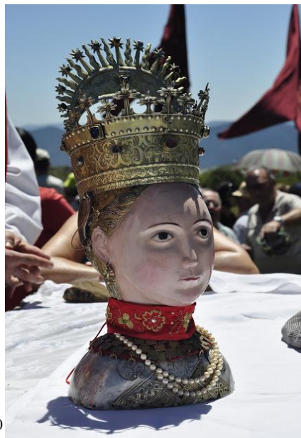
Fig 1.- Busto-relicario de Santa Orosia abierto Fig 2.- Busto-relicario de Santa Orosia