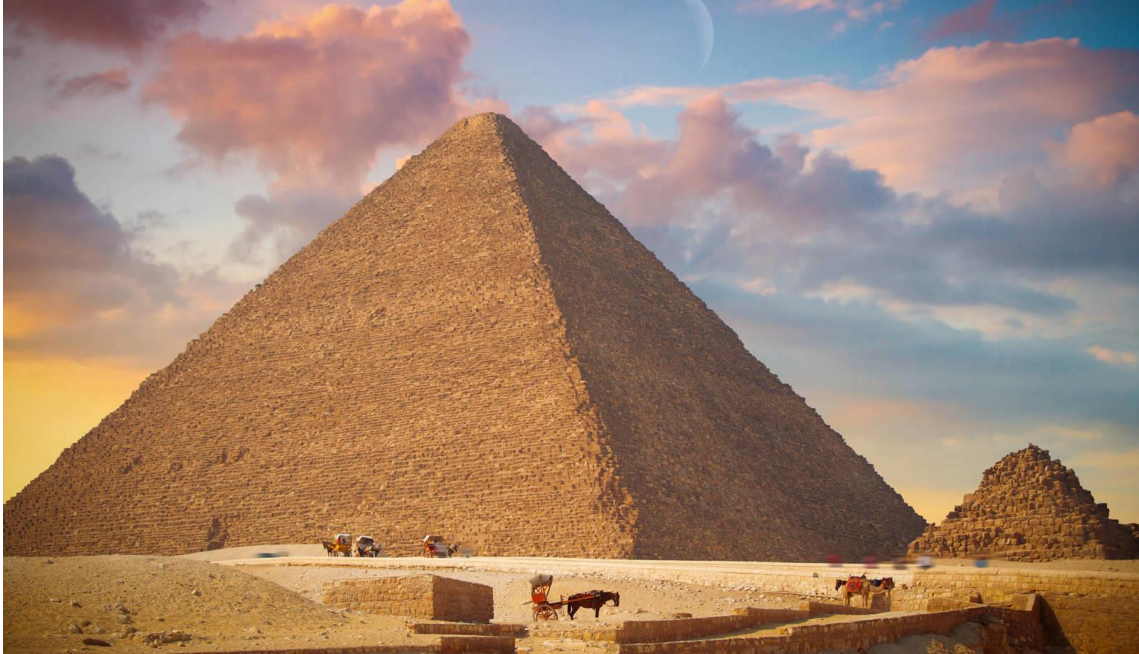
Pirámide escalonada de Djoser y Gran Pirámide de Guiza.