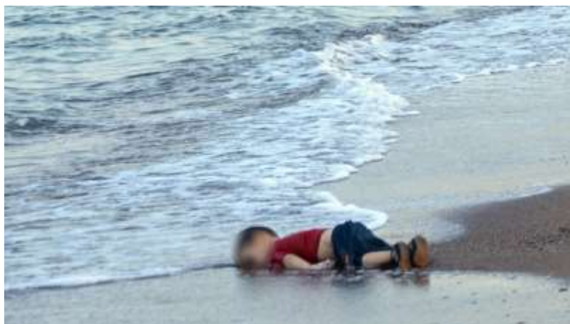
Fotografía 1. Muerte de Alan Kurdi