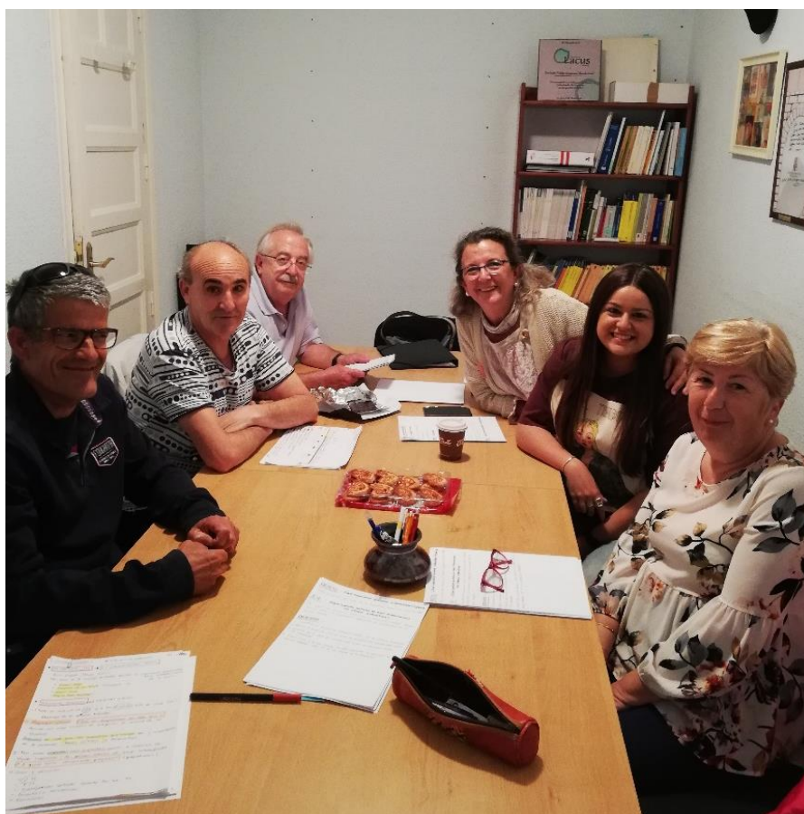
Ilustración 3. Sesión del equipo sistematizador