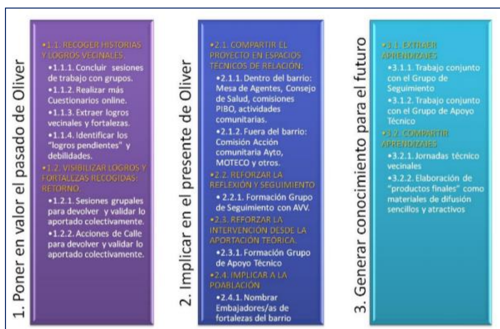
Ilustración 2. Línea del Tiempo Bezindalla

Tras las acciones realizadas durante su inicio, en el año 2017, las líneas de intervención y objetivos específicos para el 2018 son: