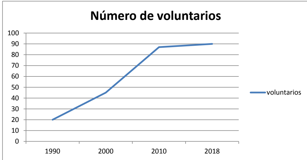
Gráfico 3: Elaboración propia