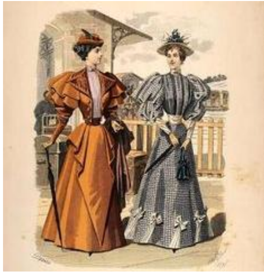
Vestimenta antes de la Primera Guerra Mundial