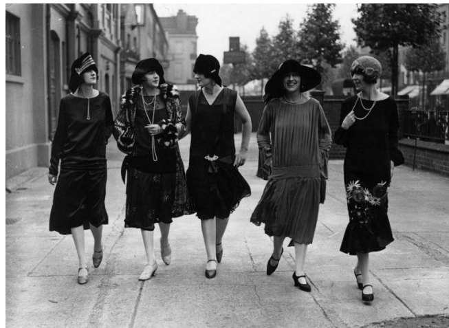
Vestimenta después de la Primera Guerra Mundial