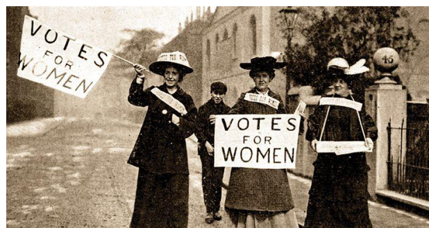
Mujeres reivindican su derecho al voto