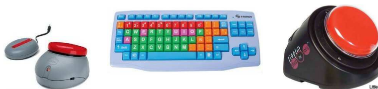
Figura A.1. Equipos específicos.