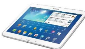
Figura A.4. Desarrollo de aplicaciones.