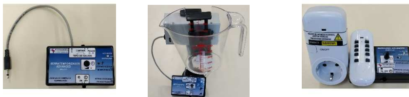
Figura A.3. Equipos electrónicos propios.