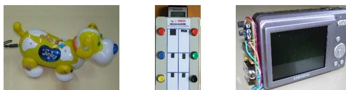
Figura A.2. Elementos adaptados.