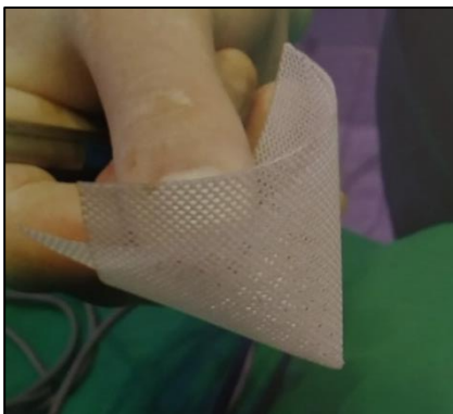
Figura 3. Malla de polipropileno, forma de cono.

Figura 2. Músculos del periné del perro. Rodríguez, J., Graus, J. & Martínez, M. J. (2005). La cirugía en imágenes, paso a paso. La parte posterior . Zaragoza: Servet.