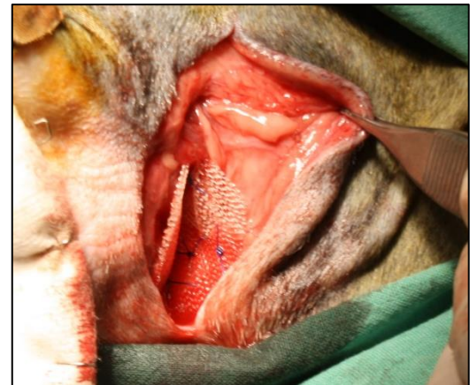
Figura 4. Malla de polipropileno colocada. Imágenes cedidas por el Hospital Veterinario de la Universidad de Zaragoza.

Figura 3. Malla de polipropileno, forma de cono. Imágenes cedidas por el Hospital Veterinario de la Universidad de Zaragoza.