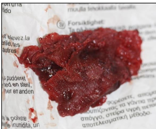
Figura 5. Malla de polipropileno infectada. Imágenes cedidas por el Hospital Veterinario de la Universidad de Zaragoza.

Figura 4. Malla de polipropileno colocada. Imágenes cedidas por el Hospital Veterinario de la Universidad de Zaragoza.