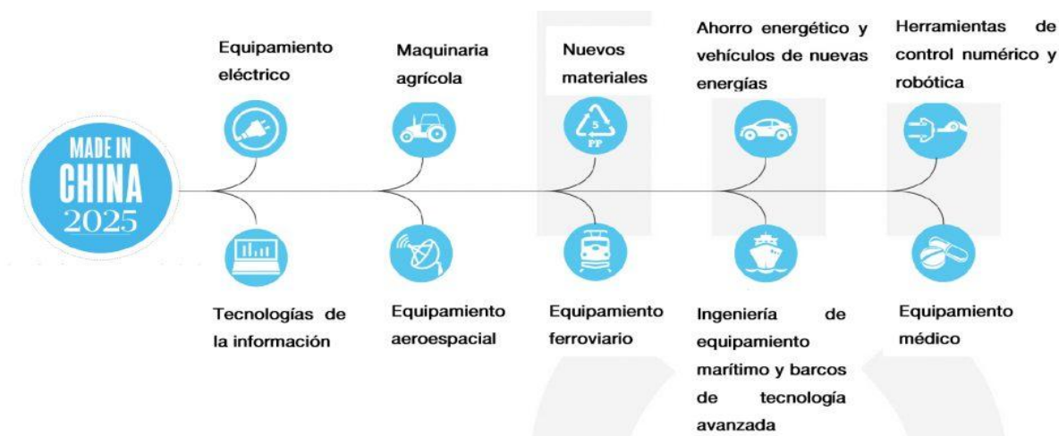
Figura Estrategia Made in China 2025 por Sectores

[Fuente:Estudios de Política Exterior. Elaboracion:Eugenio Bregolat]