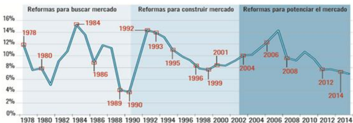
Gráfico: Principales reformas económicas en China y evolución del PIB

[ Gráfico: Adriana Exeni ]