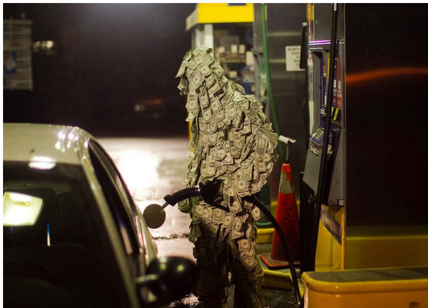
Imagen 4. J. Hickey: Money Man

La imagen transmite la idea de que alguien se está aprovechando y enriqueciendo gracias a nuestra dependencia del petróleo, un producto muy contaminante que está dañando seriamente al planeta. Esta imagen evoca muchas posibles actuaciones político-económicas: el desarrollo de energías alternativas, la lucha contra el cambio climático, políticas de transporte público y reducción del uso del coche privado, aumento de la competencia en el sector energético, etc.