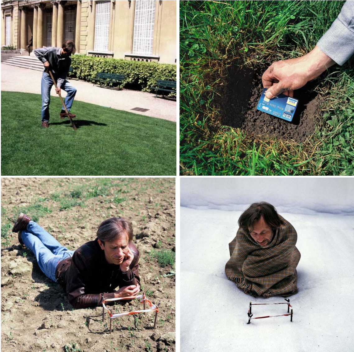
Imagen 5. D. Tsykalov: Plantation à la carte

las familias se parchean con endeudamiento de forma algo arriesgada. También el afán consumista explica parte de la dependencia del uso de la tarjeta de crédito. La política económica podría reducir esta dependencia impulsando mejoras salariales para los trabajadores y/o mejores transferencias sociales para los necesitados.