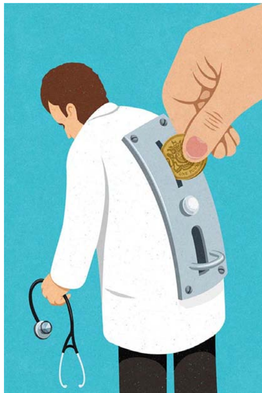
Imagen 3. Holcroft: sin título

Se trata de una ilustración muy directa, un médico que solo se atiende a los enfermos si se inserta dinero en su espalda. Desde la perspectiva de la política económica, la propuesta es evitar esta situación, es garantizar el acceso universal y gratuito a la salud, garantizando a través del sistema público el derecho a la protección de la salud para todos.