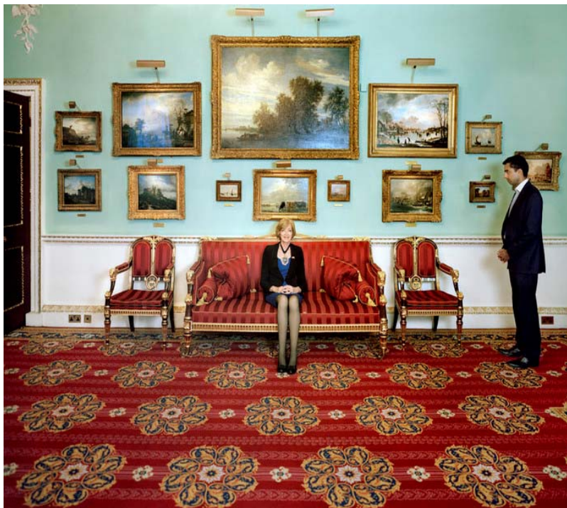
Imagen 2. G. Galimberti y P. Woods: The Heavens

La imagen 2 refleja la riqueza, la exclusividad y la ostentación que rodean los lugares y las personas que frecuentan los paraísos fiscales. Ofrece una idea de la cantidad de riqueza acumulada en esos lugares exóticos, muy distintos a los lugares donde esa riqueza se creó y donde se le exige que contribuya a mantener los gastos derivados de los servicios públicos. Las implicaciones político-económicas que evocan estas imágenes remiten a preguntarse cómo se puede evitar la fuga de capitales, la evasión y elusión fiscal, y hacer que sus dueños paguen lo que deben, al igual que hacen los demás.