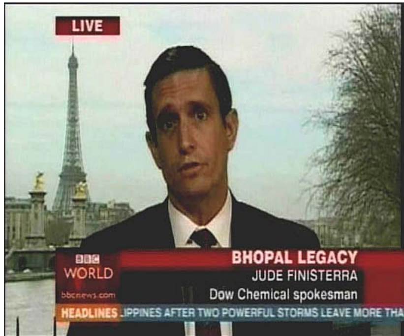
Imagen 7. The Yes Men: The Yes Men Fix the World

La imagen 7 es un fotograma del documental The Yes Men Fix the World en el que aparece uno de los miembros del grupo haciéndose pasar por el portavoz de la empresa química Dow Chemical en una entrevista en el noticiario de la BBC. En ella admitía la culpa de la empresa por el envenenamiento masivo causado por una fuga de gas tóxico en Bhopal (India) en los años 80 y anunciando indemnizaciones. Lamentablemente eso era una broma, lo deseable es que la política se hiciera valer de mecanismos para establecer condiciones de producción y laborales seguras y respetuosas con el medioambiente y, en caso necesario, poder obligar a las empresas causantes de desastres medioambientales a asumir sus responsabilidades.