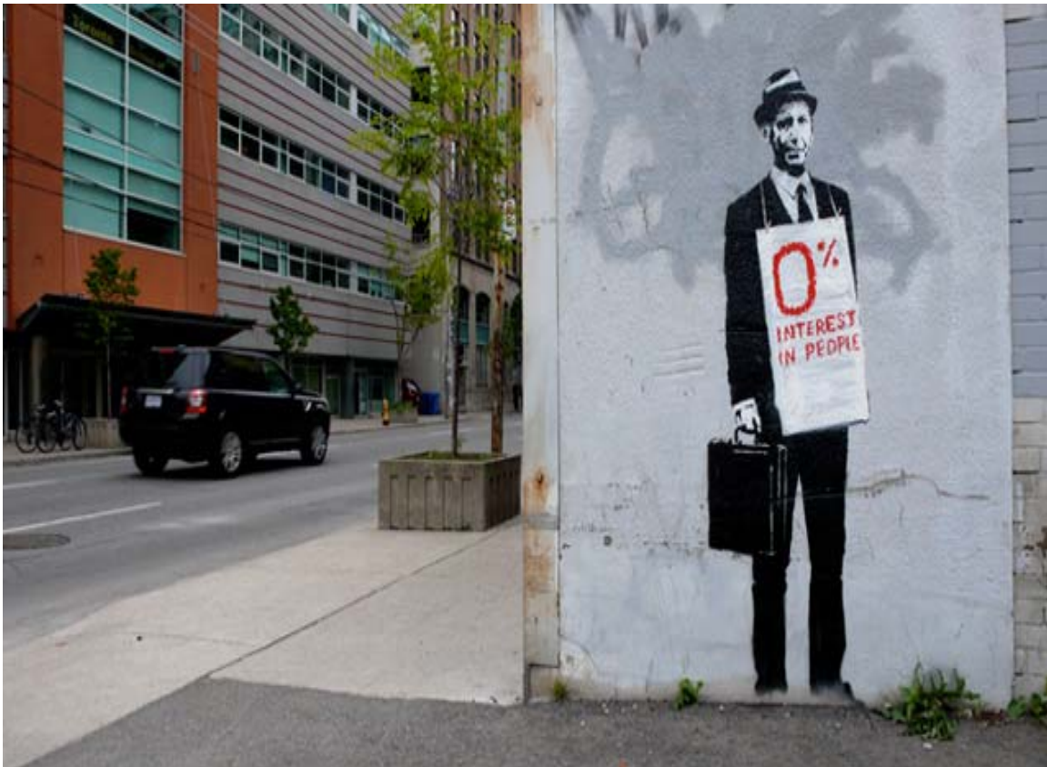
Imagen 1. Banksy: sin título

En la imagen 1, Banksy transmite la idea de que el sistema financiero no atiende las necesidades de las personas, que su funcionamiento está al margen de los objetivos de la sociedad, como si la lógica de la maquinaria financiera del sistema económico estuviera desconectada de aquella. Esta imagen recuerda un sistema financiero que crea burbujas y crisis a través de la especulación con activos que tienen poca conexión con el mundo real. La última crisis financiera mundial de 2008 es un ejemplo cercano de esto. Las implicaciones de política económica que evoca esta obra son evidentes: hay que modificar el sistema financiero, hay que regularlo más eficazmente para evitar comportamientos socialmente irresponsables que acaban generando costes a la sociedad.