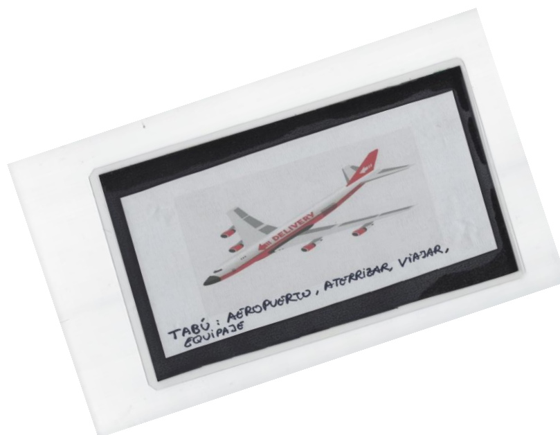
Anexo 3. Tarjeta con invento para la prueba de “Tabu”.