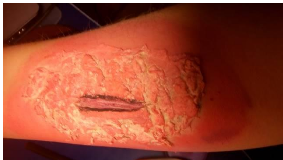
Anexo 6. Resultado de la cicatriz falsa antes de llevar a cabo la actividad en el aula.