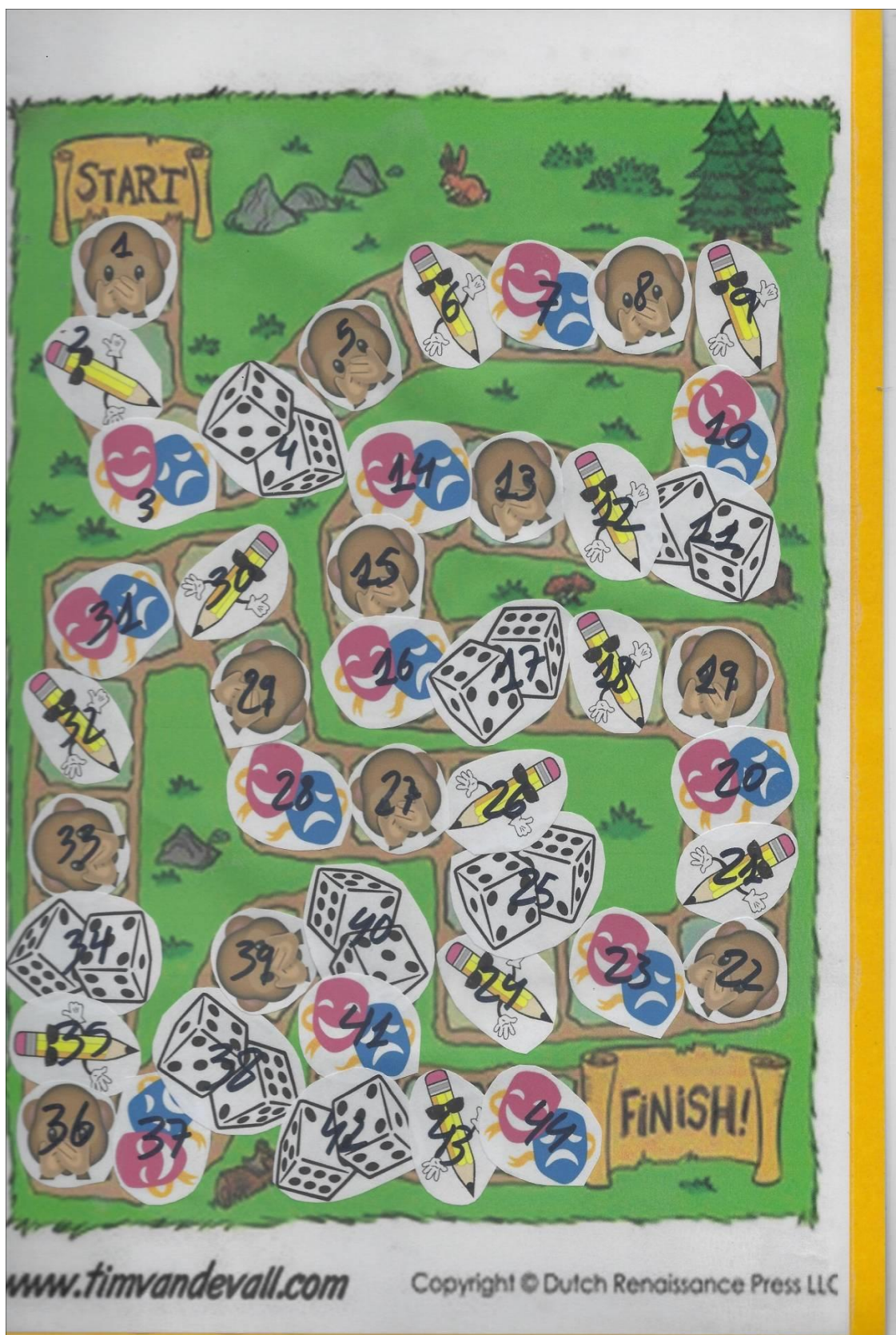
Anexo 4. Tablero de juego de la sesión de Ciencias Naturales.