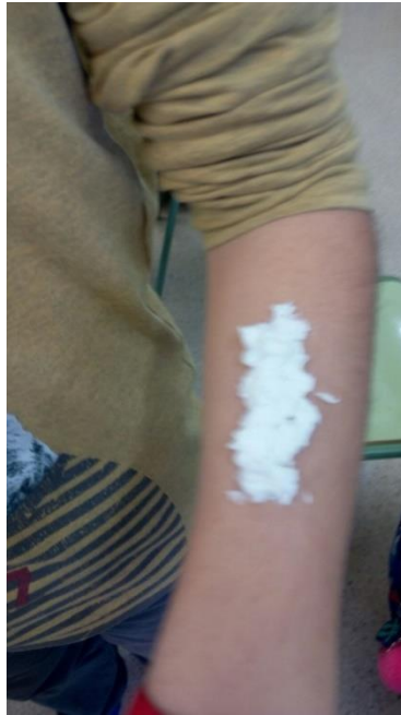
Anexo 5. Mezcla de papel higiénico y cola blanca de las cicatrices falsas.