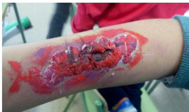
Anexo 7. Resultado de la cicatriz falsa en el aula.