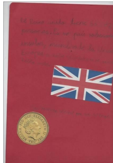
Anexo 2. Parte interior de lapbook.