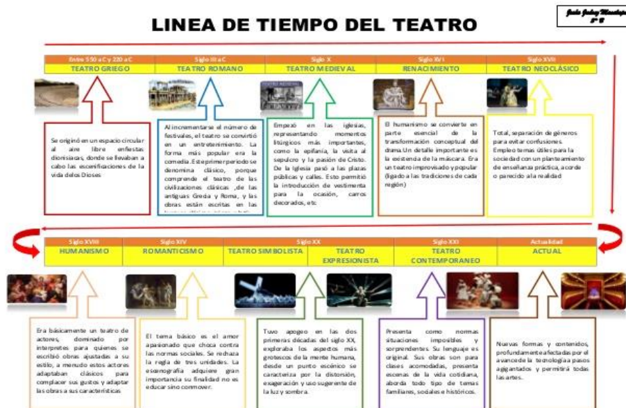
Gráfico 1. Línea de tiempo arte (Macalupu, 2018)

A partir de los conocimientos ofrecidos por la Universidad Nacional Autónoma de México y los conceptos adquiridos en el Grado sobre literatura, se explicita a continuación el nacimiento del teatro como arte y sus principales características, así como las modalidades en que se encuentra dividido.