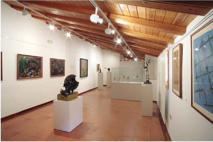
Figura 1: Sala Eleuterio Blasco Ferrer. Museo del Parque Cultural de Molinos.

proyecto. Este espacio se complementó con aquellos que constituían el Parque Cultural de Molinos: la Sala de los Ecosistemas y la Sala de Paleontología, además del Jardín Botánico que se complementaba con el paisaje de Molinos y las Grutas de Cristal en las Cuevas de las Graderas.