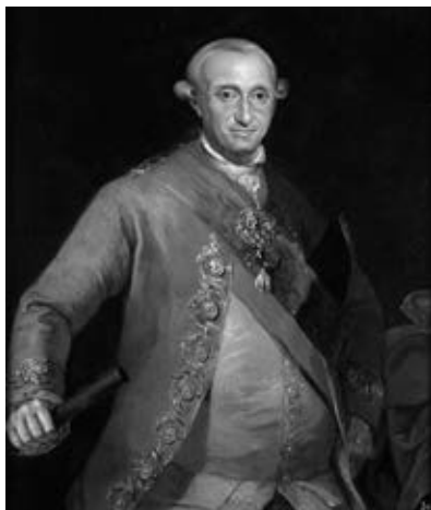
Carlos IV (copia de un retrato de Francisco de Goya)