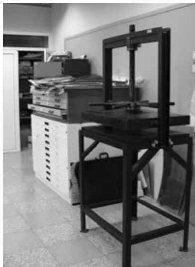
Prensa vertical en la Escuela