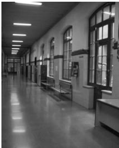
Vista interior de la Escuela