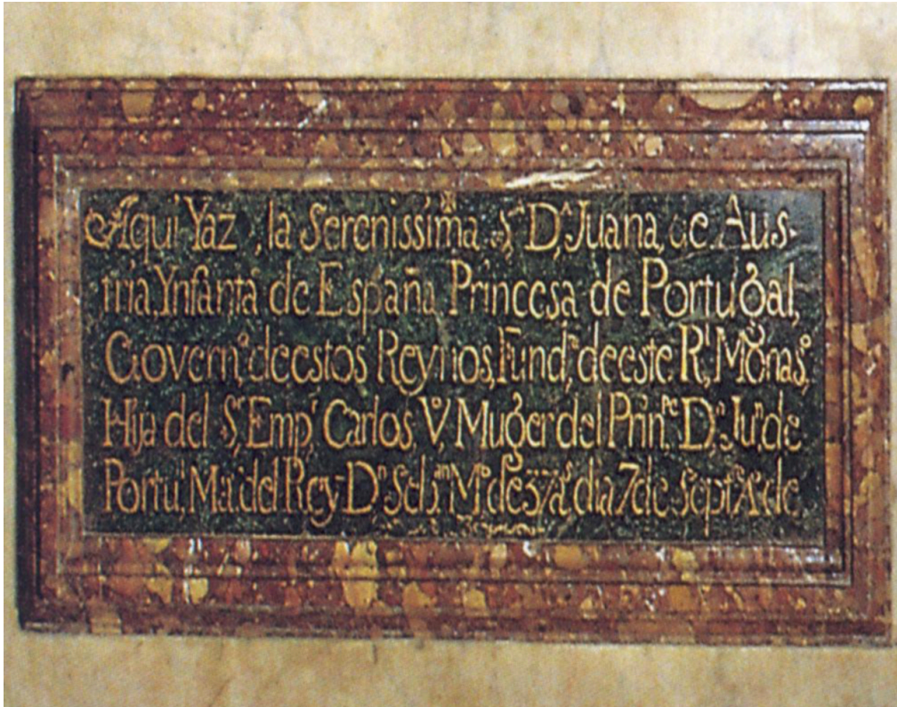
Pompeo Leoni, Detalle de la Inscripción del sepulcro de doña Juana de Austria , 1574, Monasterio de las Descalzas Reales, Madrid.