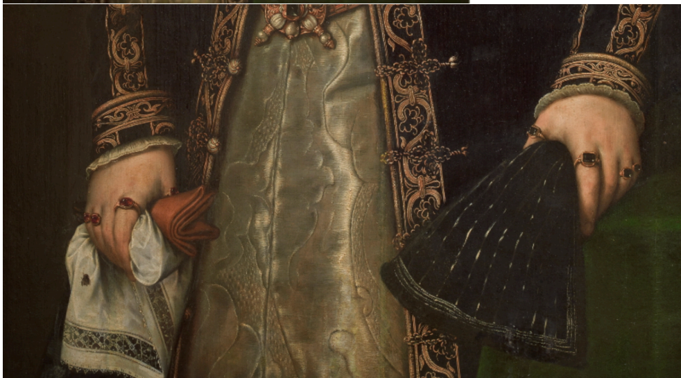
Antonio Moro, Doña Catalina de Austria, mujer de Juan III de Portugal , 1552, Museo del Prado, Madrid.