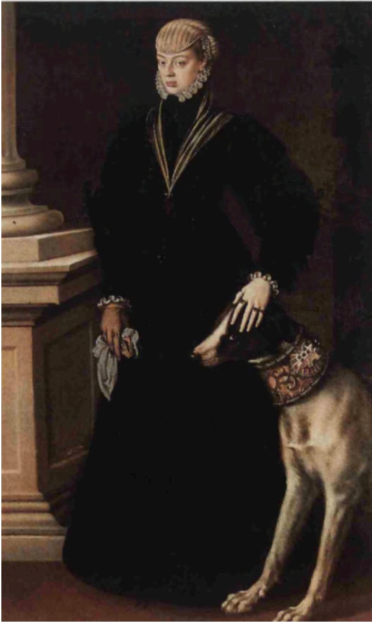
Alonso Sánchez Coello, Juana de Portugal , 1557, Schloos Ambras, Innsbruck.