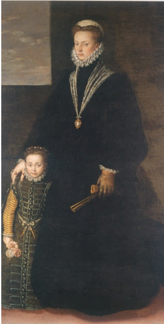
Sofonisba Anguissola, Juana de Austria , 1561, Museo Isabella Stewart Gardner, Boston.