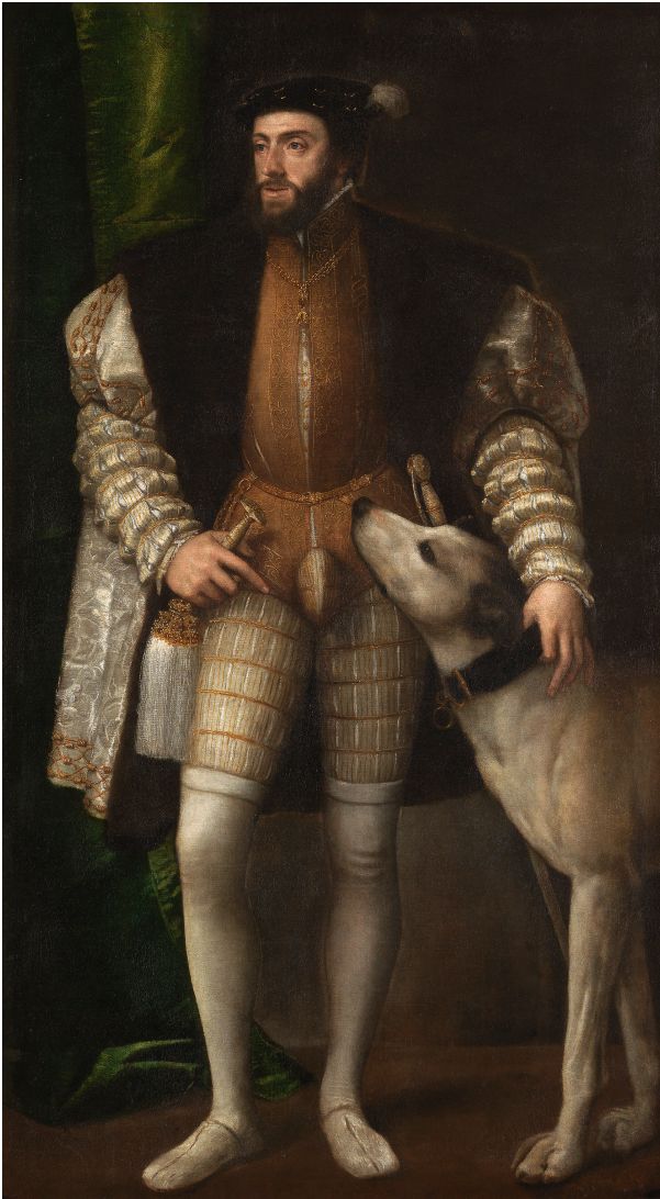
Tiziano Vecellio, El emperador Carlos V con un perro , 1533, Museo del Prado, Madrid.