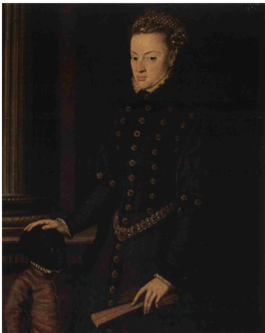
Cristóbal de Morales, Juana de Portugal , 1552-53. Musées de Royaux de Beaus-Arts, Bruselas.