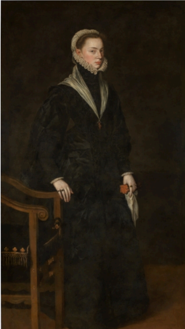
Antonio Moro, Doña Juana de Austria , 1560, Museo del Prado, Madrid.