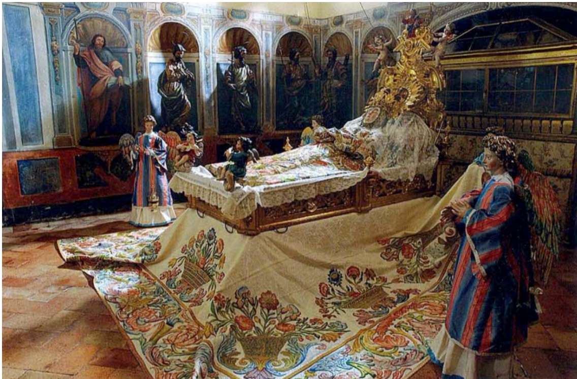
Capilla de la Dormición. Instalación con motivo de la fiesta de la Asunción, en GARCÍA SANZ, Ana (coord.): Las Descalzas Reales. Orígenes de una comunidad religiosa en el siglo XVI, Madrid, Fundación Caja Madrid, 2010, p. 30.