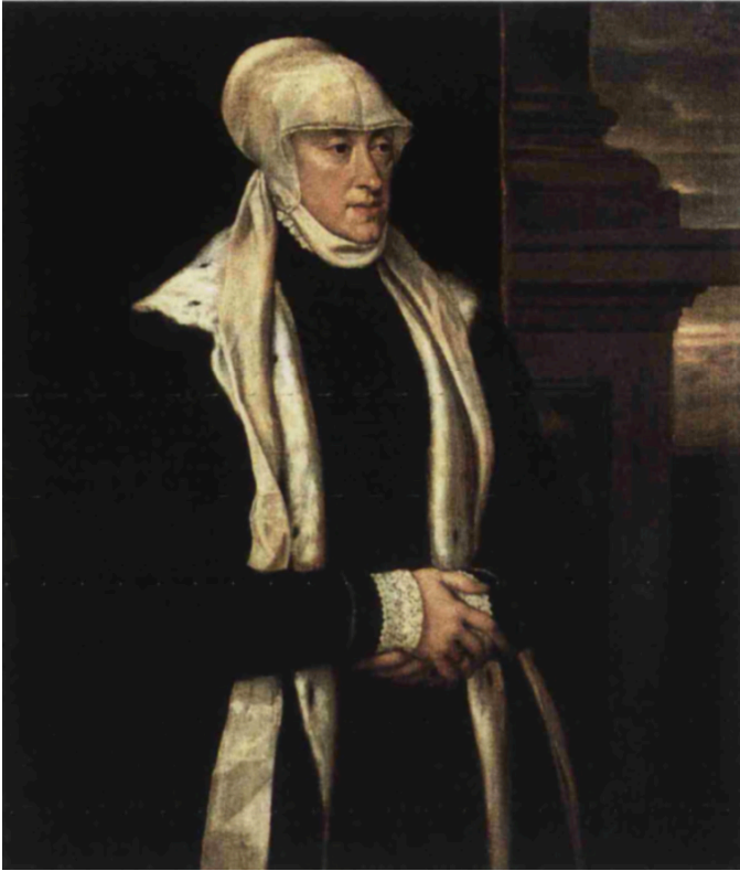
Tiziano Vecellio, María de Hungría , 1548, Musées de Royaux de Beaus-Arts, Bruselas.