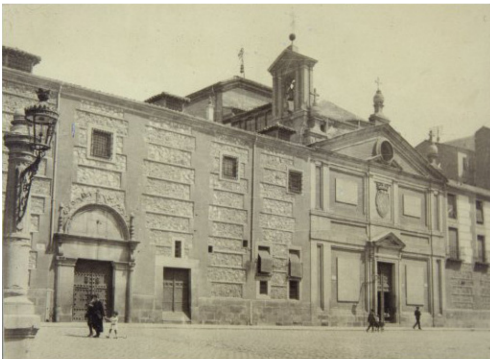
Manuel Amurieza López. Portada del convento de las Descalzas Reales. Anterior a 1927.