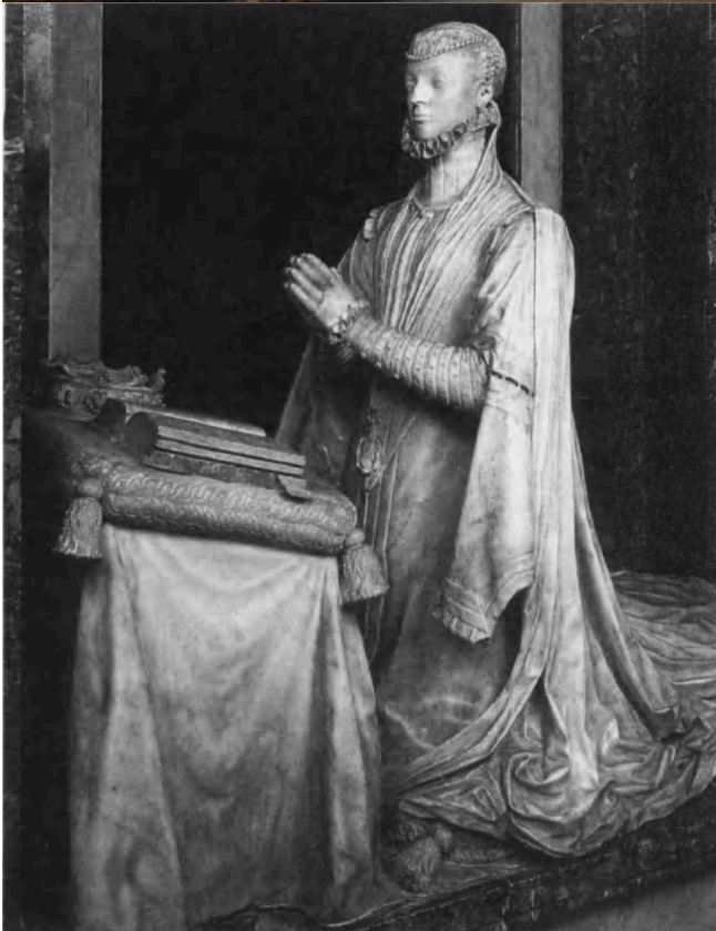
Pompeo Leoni, Escultura orante de doña Juana de Austria , 1574, Monasterio de las Descalzas Reales, Madrid.