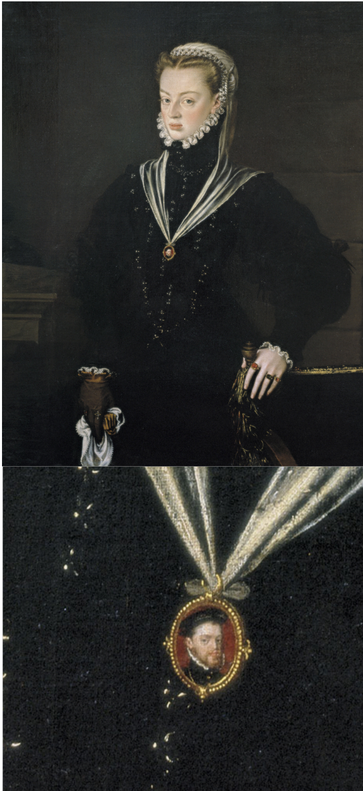
Alonso Sánchez Coello, Retrato de doña Juana de Austria, princesa de Portugal , 1557, Museo de Bellas Artes de Bilbao, Bilbao.

Detalle del camafeo donde aparece su hermano Felipe.