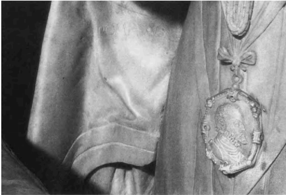
Pompeo Leoni, Detalle del sepulcro de Juana de Austria, medalla de Felipe II , 1574, Monasterio de las Descalzas Reales, Madrid.