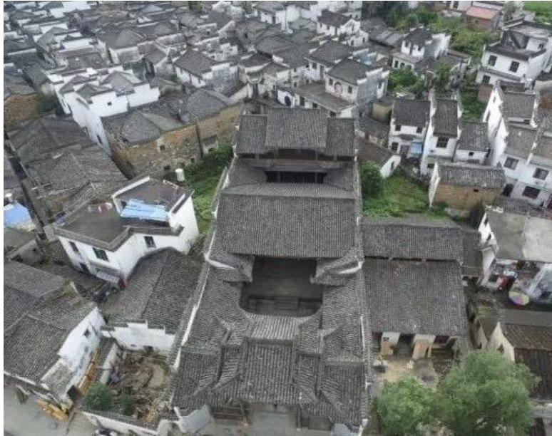
Foto 11 La vista aérea del templo