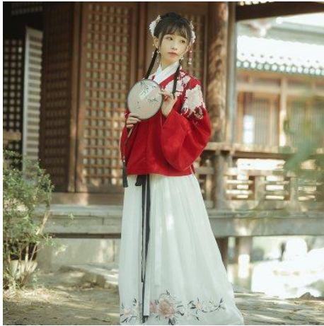
Foto 17 Hanfu de la marca de Shisanyu