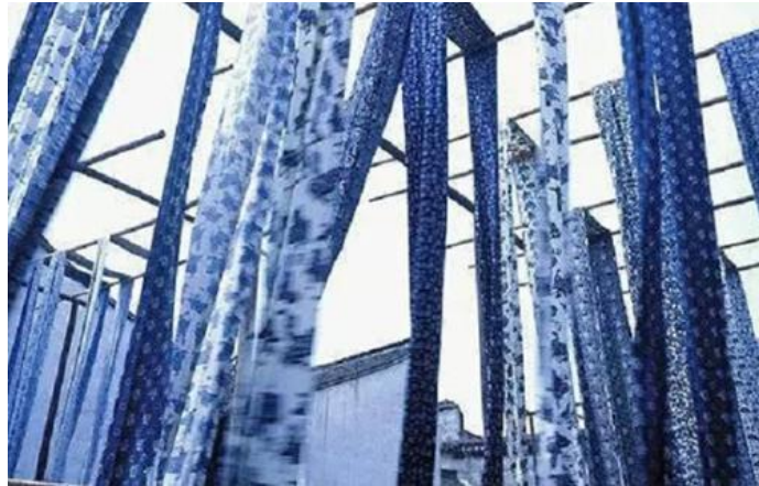
Foto 21 El teñido tradicional china