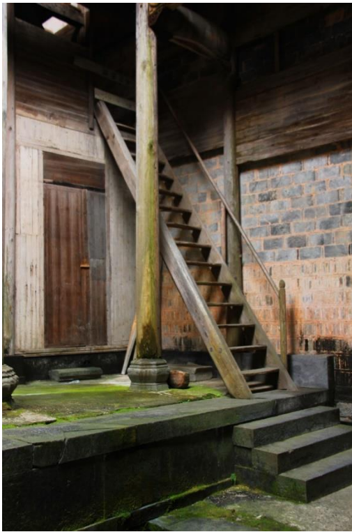
Foto 7 Escaleras de madera