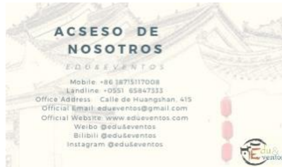
Foto 23 Tarjeta de la empresa