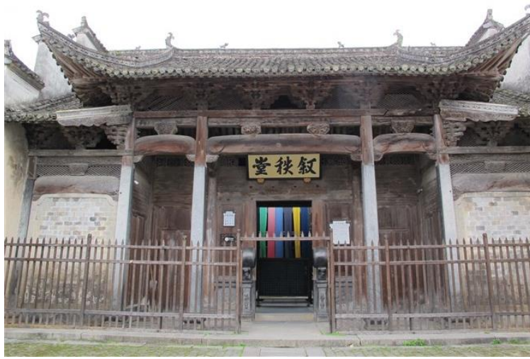
Foto 1 La puerta del Templo de la Familia Ye