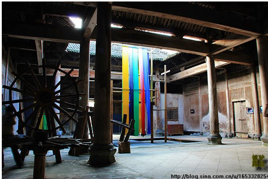
Foto 2 Hall/ Sal3n Xuzhi