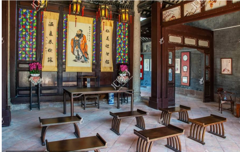
Foto 20 Escuela privada tradicional china