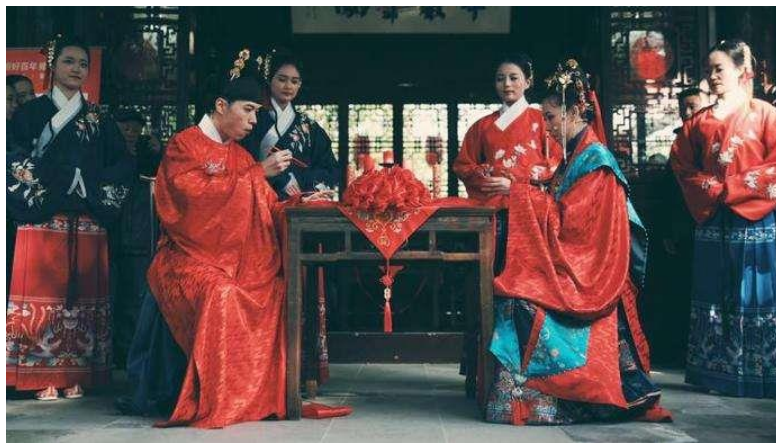
Foto 18 Boda tradicional china