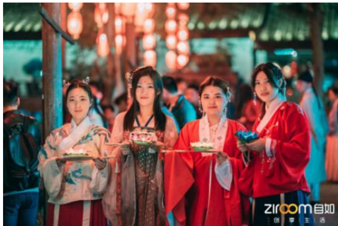
Foto 19 Fiesta de Hanfu