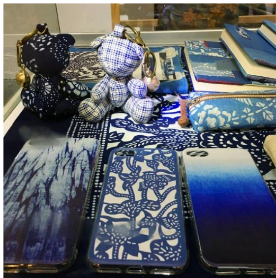
Foto 13 Productos de la tienda de souvenirs