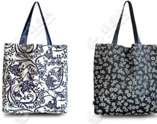
Foto 14 Bolsas teñidas