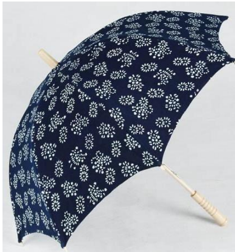
Foto 15 Sombrilla teñida