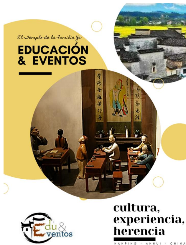
Foto 24 Cartel del proyecto