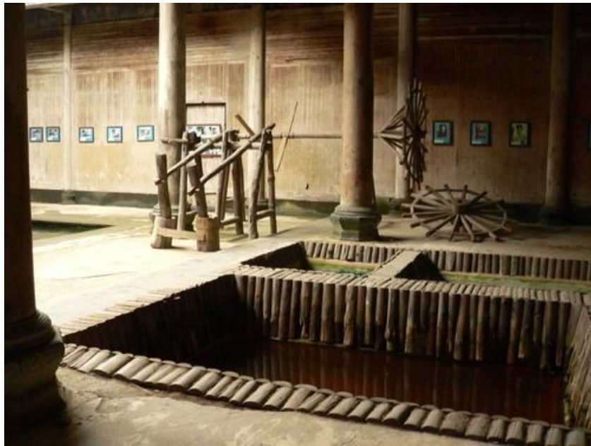
Foto 4 Instrumentos del teñido