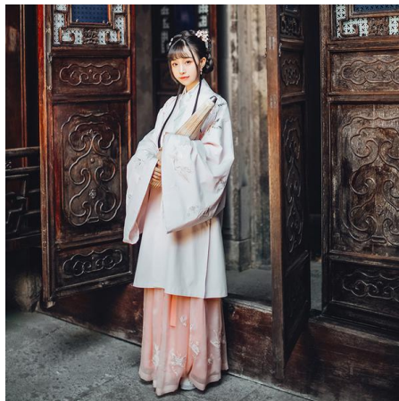
Foto 16 Hanfu de la marca de Shisanyu