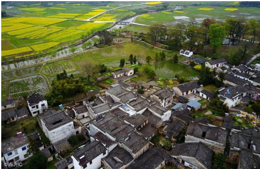
Foto 9 El pueblo de Nanping