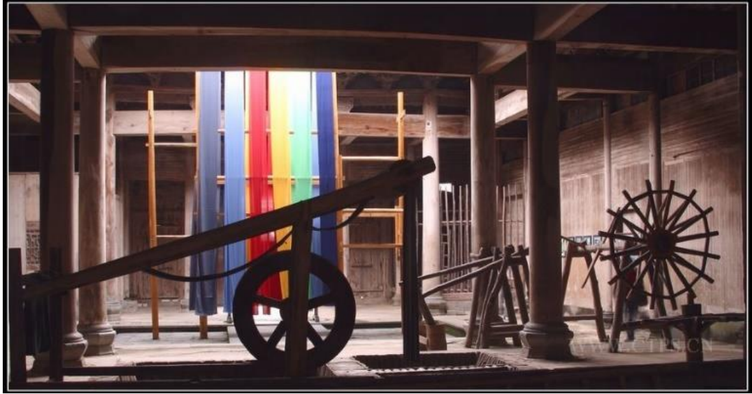
Foto 6 Fotos de la película Ju Dou