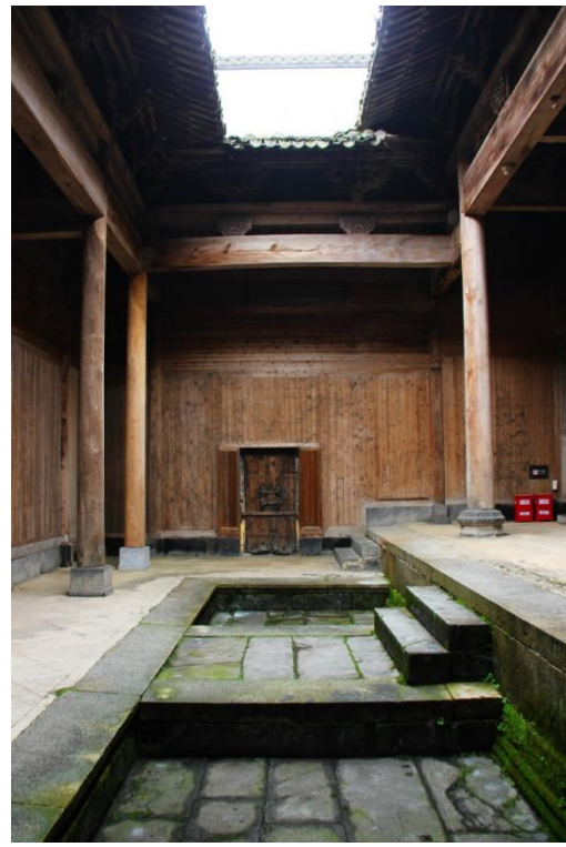
Foto 8 El patio 2