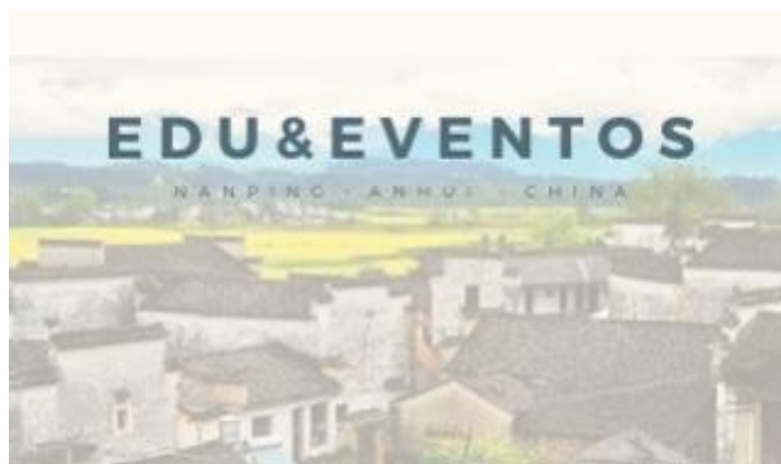
Foto 22 Tarjeta de la empresa