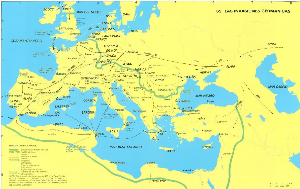
Migraciones germánicas. Beltrán Lloris y Marco Simón, 2006, p. 69.