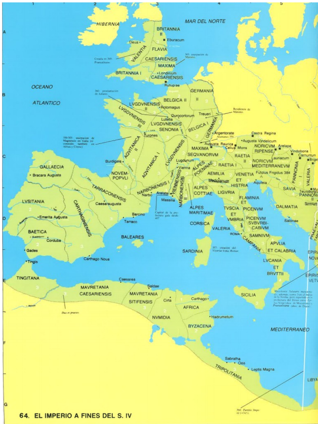
Provincias de Hispania en el Imperio romano tardío. Beltrán Lloris y Marco Simón, 2006, p. 67.