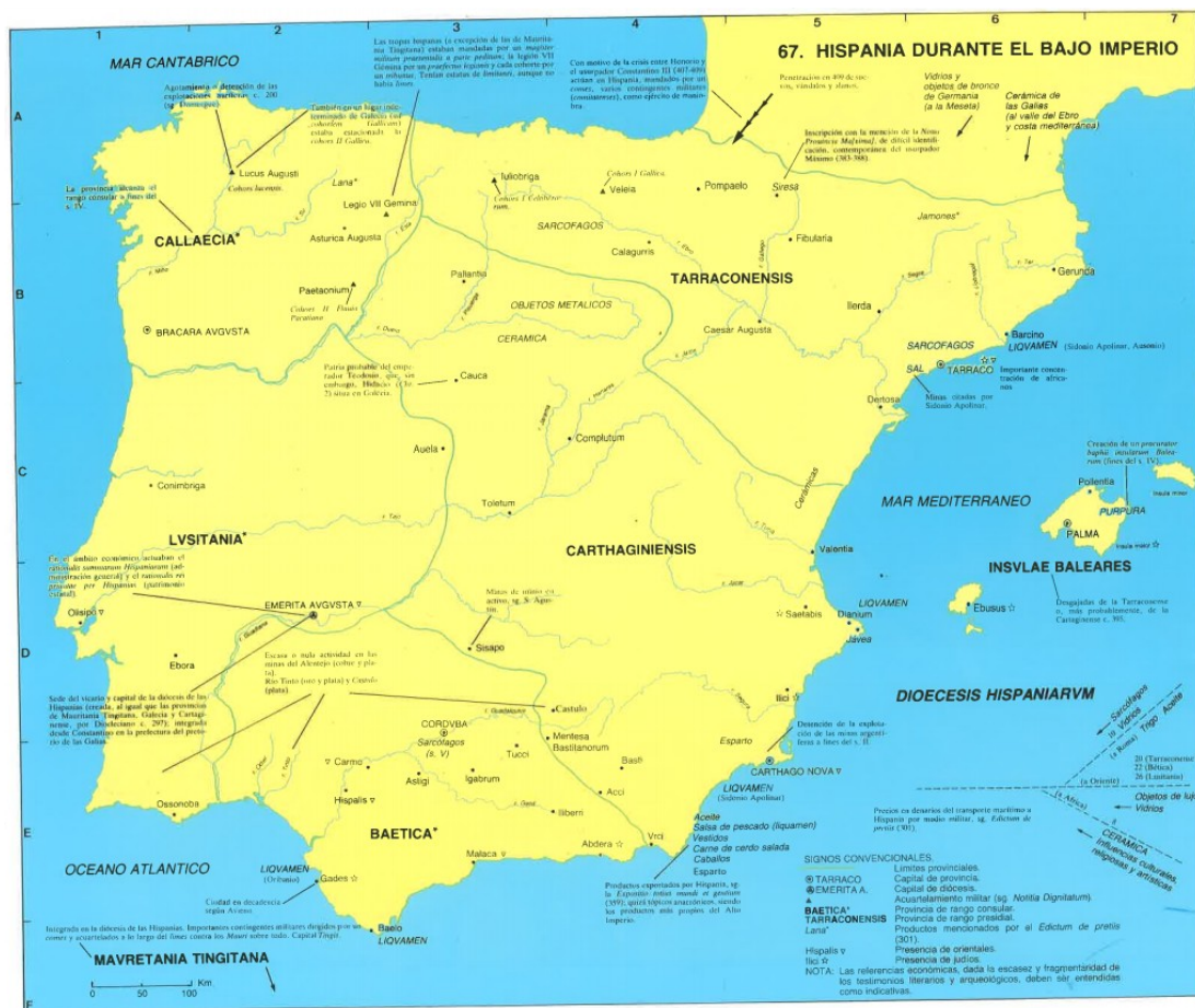
El Occidente romano a finales del siglo IV. Beltrán Lloris y Marco Simón, 2006, p. 64.