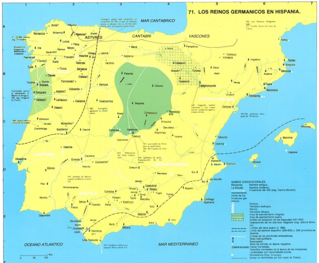
Asentamiento de los reinos germánicos en Hispania. Beltrán Lloris y Marco Simón, 2006, p. 71.