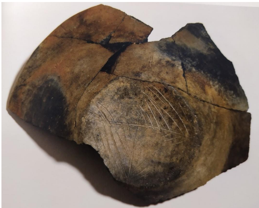
Figura 8. Detalle con motivos geométricos en la base de un plato

La cerámicas dedicadas al servicio de mesa presentan características que las relacionan con el consumo de alimentos y bebidas. Son las más cuidadas en su producción, con pastas depuradas, inclusiones de pequeño tamaño y suelen tener acabados espatulados o bruñidos. Algunas piezas pueden presentar además una capa de engobe. Las formas y tamaños son muy variados, según el uso para el que estén pensadas. Por su parte, vamos a ver una cierta homogeneidad en las piezas encontradas en el poblado, sin grandes variaciones según la etapa o el lugar que se hayan encontrado. Sí que existen ciertos detalles que reflejan que las piezas podrían no haber sido realizadas por la misma persona. Por ejemplo, los platos son uno de los tipos cerámicos más numerosos y en ellos podemos observar una diferencia en el acabado de las bases: en la casa 0 predominan las bases cóncavas, en la casa 2 las bases planas y en la 7 se caracterizan por presentar en las bases anillos incipientes. También se han podido observar una serie de motivos geométricos en los fondo de los platos, realizados mediante incisiones antes de cocer las piezas. Todos los motivos son distintos por lo que se ha pensado que podrían interpretarse como marcas de propietario o símbolo familiar, frente a las propias de alfarero. Para el modelado de algunos platos se pudo utilizar moldes, debido a que se han encontrado piezas con una gran homogeneidad en los diámetros de los fondos y en la parte baja de los perfiles de los platos.