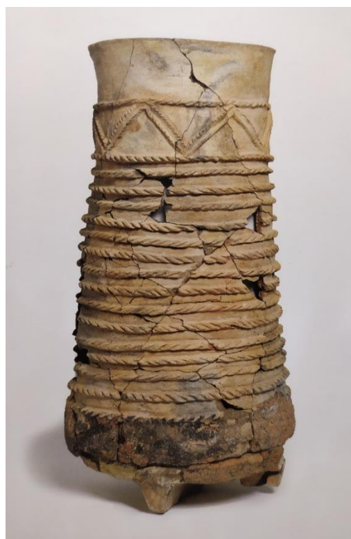
Figura 9. Tinaja cilíndrica decorada mediante cordones (Picazo Millán & Rodanés Vicente, 2009)

Las vasijas de almacenaje podían contener semillas, líquidos, alimentos, por ello se van a caracterizar por su gran tamaño que va a superar los 4 litros, llegando hasta los 16. Los acabados pueden variar, encontrando algunos más toscos, con abundantes inclusiones y un acabado alisado, lo que haría a las piezas porosas y no muy resistentes. Las más elaboradas se caracterizan por mejores pastas, más compactas y un acabado bruñido o espatulado. Determinadas piezas van a contar con características singulares como orejetas para facilitar su transporte o en algunos ejemplo de tinajas pequeñas se ha encontrado una perforación en su base, lo que las relacionaría con tareas de decantación o filtrado. También se han hallado tinajas que presentan elementos decorativos como cordones digitados, impresiones, apliques u orejetas que por su posición no tendrían funcionalidad. De las piezas decoradas destaca la tinaja cilíndrica nº 9892 (figura 6) encontrada en el espacio 2 de la fase II. Única en el yacimiento, se caracteriza por estar elaborada sobre un pie que fue reparado (demuestra el especial valor que pudo tener la pieza), tener una pasta de calidad, acabado espatulado y una decoración formada por 18 cordones paralelos con impresiones. Se han encontrado piezas similares en el Alto de la Cruz de Cortes de Navarra, las cuales se