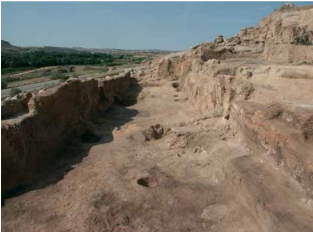
Figura 3. Vista general de la casa 2. En primer término la estancia principal con el banco corrido a la derecha y el poste central. Más allá el muro que dividiría las dos estancias. Al fondo la entrada desde la calle 2 (Picazo Millán & Rodanés Vicente, 2009).

postes junto al muro o en el centro de la vivienda para sostener la cubierta, suelos de tierra batida compactada con yeso y las paredes enlucidas con arcilla depurada y encalada. En el acceso a la vivienda se colocaban unas losas de piedra para evitar la entrada de agua o residuos al interior. Respecto a la distribución interna de la vivienda, encontramos un vestíbulo o zaguán que da acceso a la estancia principal en la que se localiza un banco adosado a una de las paredes y un hogar en el centro. La compartimentación de las viviendas permitía segregar las actividades de almacenaje y trabajo, dándose una especialización del uso del espacio. Determinadas viviendas cuentan además con un horno abovedado.