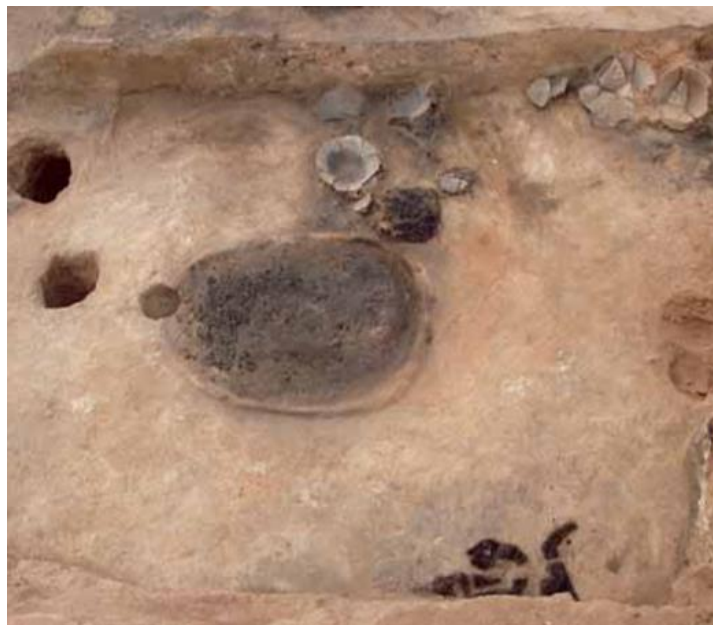
Figura 14. Casa 7, junto al hogar se ve la pieza de cestería. En la parte inferior de la imagen se distinguen los fragmentos de cuerda (Picazo Millán & Rodanés Vicente, 2009).

Los fragmentos de cordelería fueron hallados junto a una de las paredes de la casa. Están elaborados mediante la técnica de trenzado y la de torsión. Es posible que los trozos formasen parte de un ovillo de cuerda, que durante el incendio cayó al suelo y se quemó en su gran parte. Debido a su peor estado de conservación no se han podido plantear muchas hipótesis sobre su posible uso o si formaba parte de otra pieza, ya que la utilización de cuerdas debió ser muy común para gran cantidad de tareas cotidianas (atar, colgar, lanzar, medir, delimitar, etc.).