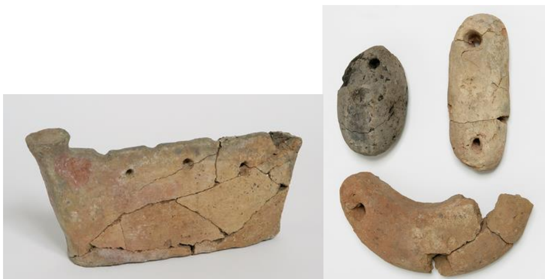
Figura 10. A la izquierda un morillo y a la derecha tres piezas de telar.

Por último, encontramos el grupo de los elementos auxiliares, en el cual se han incluido objetos con funciones variadas, que no se pueden relacionar con los anteriores. Los morillos, soportes en los que apoyaban las varillas metálicas, sobre los agujeros o las hendiduras superiores, para cocinar encima del fuego (figura 7). Pudiendo tener el cuerpo hueco o ser macizos, las pastas están elaboradas para soportar altas temperaturas gracias a la inclusión de desgrasantes. Asimismo, se halló un único ejemplar de tapadera de horno, pieza poco cocida, cuya elaboración no fue muy cuidada debido a que su uso era tapar el tiro del horno. Este grupo lo completan las pesas de telas, de varios tipos y elaboradas con barro junto a inclusiones de fibra vegetal. No se sabe si estas piezas fueron cocidas o su estado fue debido al incendio de la casa.