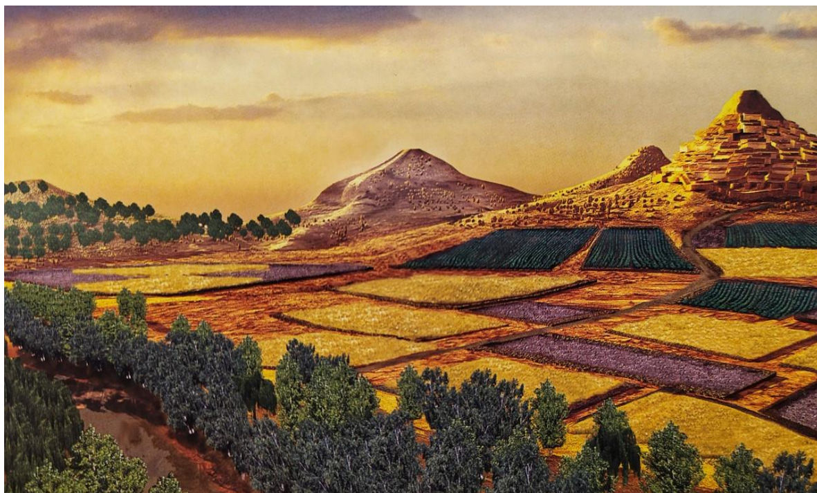
Figura 6. Reconstrucción virtual del paisaje durante la Primera Edad del Hierro (Picazo Millán & Rodanés Vicente, 2009)

En primer lugar, mediante el análisis de isótopos estables del carbono de los carbones, muy predominantes en el registro arqueológico, se ha podido reconstruir como pudo ser la vegetación y el paisaje de hace 2.500 años. El clima se caracterizaba por una precipitación que duplicaba la registrada hoy en día, llegando a los 700mm. Estas condiciones implicarían un paisaje con una mayor vegetación, especialmente herbáceo-arbustiva, con el pino y la encina como árboles dominantes.