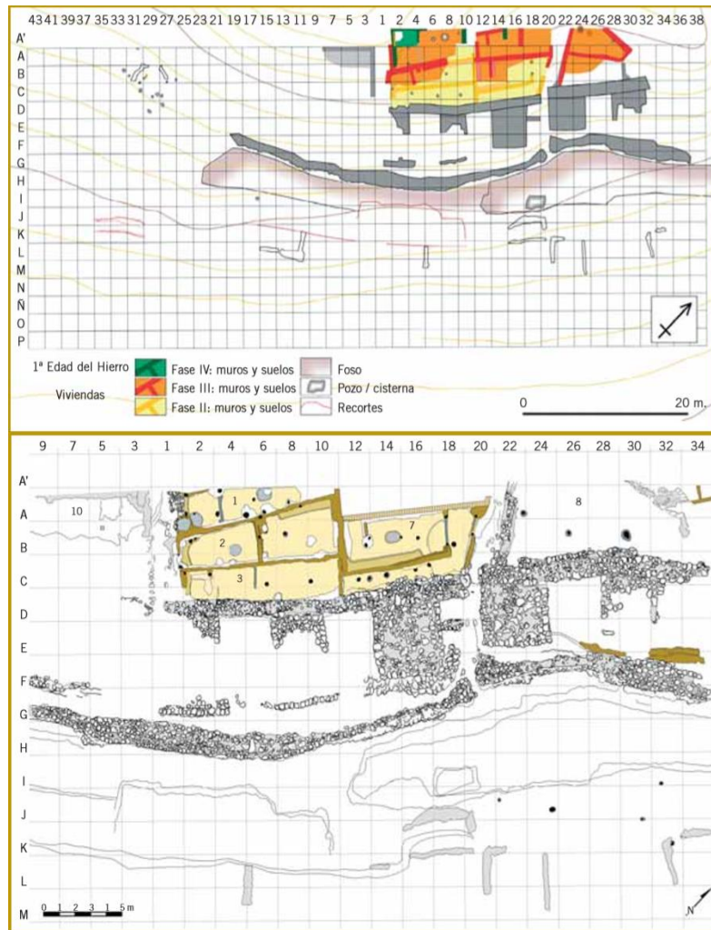
Figura 1. Plano de los poblados de la Primera Edad del Hierro en el Cabezo de la Cruz. En la imagen superior se indican las diferentes fases y la inferior corresponde al poblado de la fase II con las principales estructuras.

exterior vamos a encontrar el foso, con una longitud de casi 62 metros, una anchura que ronda los 4 metros, con una profundidad no muy grande de 60 cm, pudiendo estar acompañado además de una empalizada. Se ha constatado que dicho foso fue descuidado y colmatado en un determinado momento del poblado (fase III). Posteriormente encontramos un muro de recrecimiento, tras el cual se levanta la muralla acompañada de bastiones. Se ha conservado un tramo de 35 metros y su anchura ronda el metro de espesor, construida mediante un aparejo irregular de bloques de areniscas yesíferas. Encontramos a su vez una estrecha entrada que da acceso al poblado y a la denominada, por el equipo de investigación, calle 1. No obstante se cree que ésta no fue la entrada principal al poblado, sino una secundaria, y que debido a la erosión no se haya conservado. Podemos afirmar que las características defensivas del poblado denotan un sistema de inestabilidad en el territorio, que igualmente pudo ser intermitente debido al