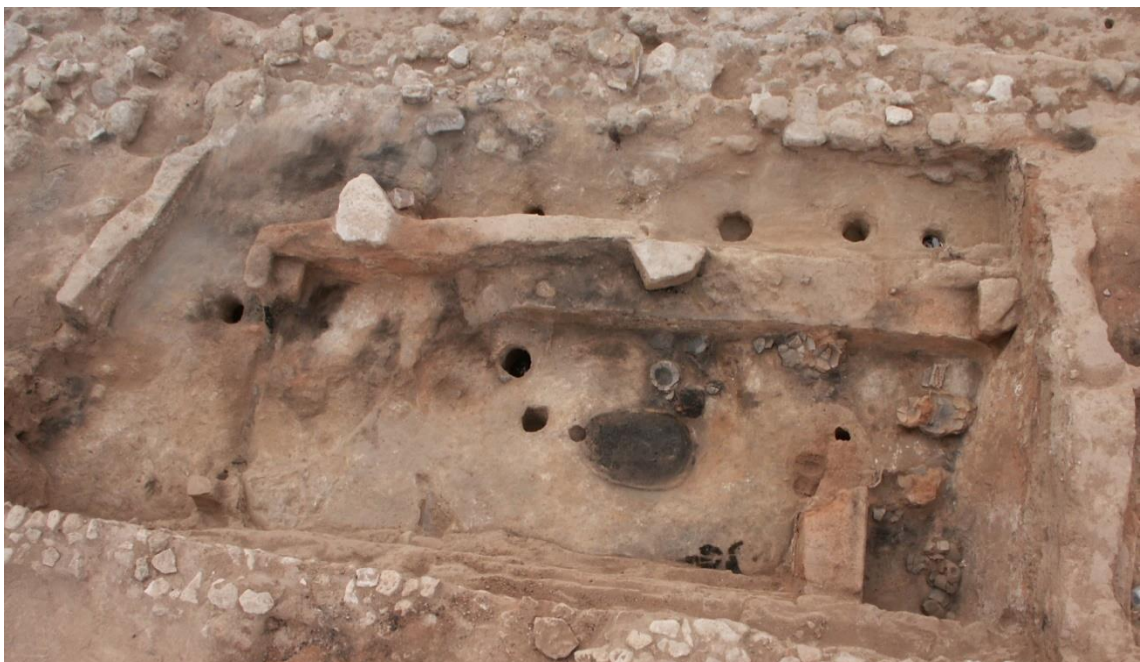
Figura 4. Planta de la casa 7, en la que se puede ver en la parte superior de la imagen el espacio dedicado a la estabulación (Picazo Millán & Rodanés Vicente, 2009).

El hallazgo de una capa orgánica que podría corresponder a un depósito de estiércol en una de las estancias de la casa 3, llevó al equipo de investigación a plantear la hipótesis de que pudiese tratarse de una zona de estabulación de ganado. Tesis que se acompaña de un hallazgo similar en la casa 7 (figura 3), donde se documentó una estancia alargada y pegada a la casa con una gran acumulación de restos orgánicos que se interpretaron como excrementos de ovinos. Además, en el interior de esta estancia no se encontró apenas material arqueológico. Mediante una comparación etnográfica con las casas rurales de hace apenas cien años, en las cuales el ganado también se ubicaba junto a la casa, podemos establecer una posible analogía que sirva de hipótesis interpretativa y explicativa, ya que la ubicación del ganado junto a la casa permite calentarla en épocas de invierno gracias al calor emitido por los animales.