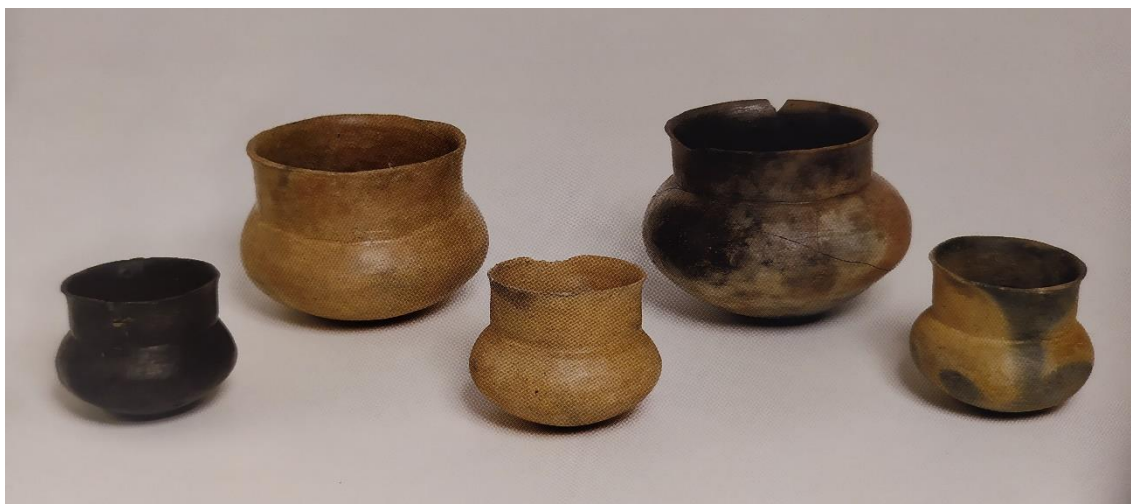
Figura 7. Conjunto de vasos de cuello cilíndrico de tamaño pequeño y medio, cuya función sería el servicio de líquidos. Análisis realizados en determinados ejemplares, apuntan a la presencia de restos que podrían corresponder con cerveza (Picazo Millán & Rodanés Vicente, 2009).

El tecnocomplejo culinario cerámico que encontramos en el Hierro I, y por ende en el Cabezo de la Cruz, hunde sus raíces en las tipologías cerámicas del Bronce Final, y cuya pieza cerámica por excelencia va a ser la olla de perfil en S y base plana (Buxó, et al., 2010). Este recipiente va a formar parte del repertorio de las cerámicas de cocina, cuya técnica de fabricación va a ser la característica más representativa del conjunto. Son piezas elaboradas con una pasta que incluye un desgrasante grueso, que puede ser cuarzo, cuarcita o cerámica triturada, y finalizadas con un acabado alisado. Estas rasgos tienen como objetivo que la pieza aguante altas temperaturas, y por ello se ha deducido que fuesen utilizadas para cocinar. En el poblado del Cabezo de la Cruz, además de las ollas de perfil en S, encontramos otro tipo de ollas caracterizadas por la ausencia de cuello, una estructura cerrada, un borde reentrante, cuerpo ovoide y fondo plano. Dicha tipología está definida por dos ejemplares que muestran tamaños diferentes, uno considerablemente mayor que la otra.