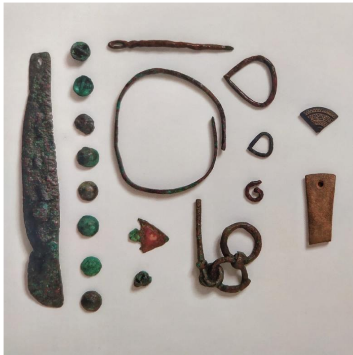
Figura 13. Conjunto de objetos metálicos (hoja de cuchillo, apliques de indumentaria, pulsera, agujas, punta de flecha y anillas) y objetos líticos (brazalete de arquero y fragmento de disco decorado)

El conjunto de restos hallados no nos aporta mucho información de cómo pudo ser la industria de la metalurgia en el poblado. Tampoco se han encontrado lugares ni estructuras específicas en las que se pudieran llevar a cabo estas tareas, por lo que no se puede conocer si tenían un carácter doméstico o más especializado.