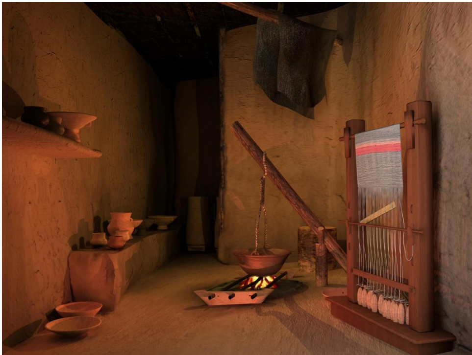
Figura 15. Reconstrucción virtual del interior de una vivienda en la que se puede ver un banco corrido, un hogar y un telar.

Dentro de la industria textil hay que hacer alusión al hallazgo anteriormente citado en la casa 2 de un gran número de pesas de telar. Este hallazgo se dio tanto en la fase II como en la III de la vivienda y se ubicaban en ambas fases en la misma zona de la casa, la habitación delantera, donde habría más luz para el desarrollo de esta actividad. Esto nos permite plantear la hipótesis, ya contrastada en otros enclaves del del Bajo Ebro, de una posible especialización de la familia que habitaba en esa casa en la elaboración de tejidos, especialización que se transmitió de una fase a otra, ergo de una generación a otra, posiblemente. Este fenómeno se ha podido documentar también en otros enclaves del Bajo Ebro.