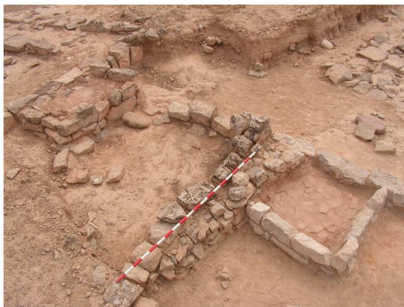
Figura 5. Ejemplo de cubetas en el yacimiento de la Codera, Huesca (Montón Broto, 2004)

Una vez descritos los rasgos generales del urbanismo en el Cabezo de la Cruz, llevar a cabo una comparación con yacimientos cercanos y de la misma cronología puede aportarnos información sobre patrones de comportamiento similares o características específicas de cada poblado. Los yacimientos de la Primera Edad del Hierro en el Valle del Ebro más representativos son Els Vilars (Arbeca, Lleida) y la Codera (Alcolea de Cinca, Huesca). El yacimiento de la Codera presenta una serie de analogías con el Cabezo de la Cruz respecto a su emplazamiento, localizándose en un lugar estratégico, sobre una plataforma de difícil acceso y con una vista privilegiada. También en este poblado se documenta un fuerte sistema defensivo formado por una muralla y una serie de bastiones adosados a ella. Vamos a encontrar, además, un patrón de vivienda con similitudes importantes en tamaño y planta, con características internas similares, como la construcción de bancos. Por su parte, la existencia de diferentes estancias dentro de las viviendas no va a ser tan evidente en la Codera y vamos a encontrar una estructura particular que no se ha hallado en las viviendas del Cabezo de la Cruz: se han denominado cubetas (figura 5) e y son estructuras cuadradas de un metro de lado, adosadas a una de las esquinas de la casa y cuya función no está clara. (Montón Broto, 2004).