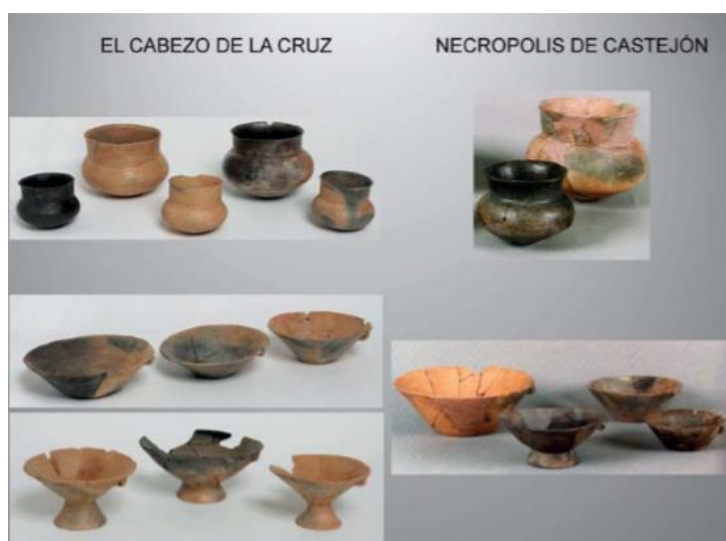
Figura 11. Platos cónicos y vasos de cuello cilíndrico procedentes del Cabezo de la Cruz (La Muela, Zaragoza) y la necrópolis del Castillo (Castejón, Navarra), (Pérez Lambán, et al., 2014).

Mediante la comparación con el registro material de yacimientos cercanos podemos observar un alto grado de estandarización. Por ejemplo, en el Alto de la Cruz de Navarra (Maluquer de Motes, 1954) encontramos prácticamente los mismos tipos cerámicos, con detalles y técnicas muy similares. Otros yacimientos con analogías destacables son el Castillo de Castejón (Faro Carballa, et al., 2002-2003), El Morredón de Frescano (Royo Guillén, 2005), Cabezo de Ballesteros de Épila (Perez Casas, 1985), Los Castellazos de Mediana de Aragon (Maestro Zaldivar, 1992), etc. (figura 12). El vaso con cuello cilíndrico es el elemento más común y característico de estos yacimientos (figura 11), con unos atributos morfológicos, métricos y decorativos que parecen responder a un nivel de estandarización muy alto. Este grado de homogeneidad en el registro cerámico de los yacimientos que se extienden por el Valle Medio del Ebro, especialmente en la parte