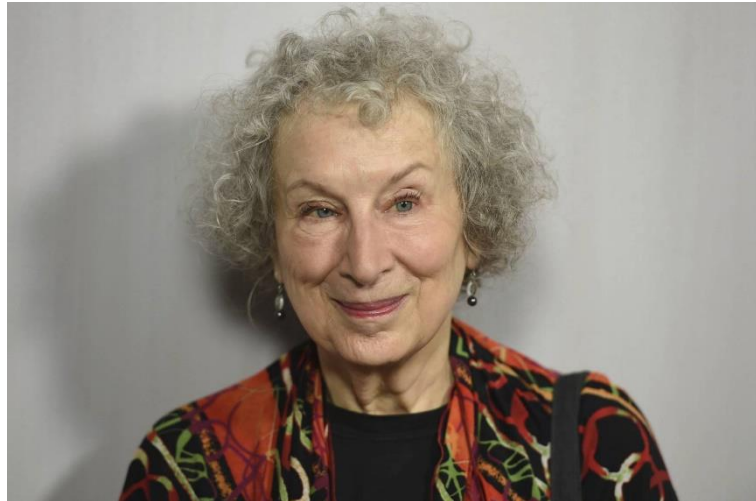
Margaret Atwood en Los Ángeles