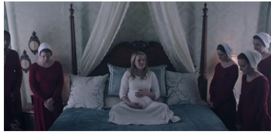
Fotograma 10 Defred durante su ceremonia de parto. 2x04 / HBO