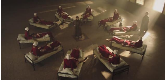
Fotograma 9 Criadas en el centro rojo. 1x04/HBO