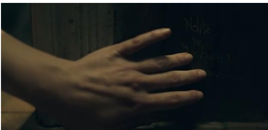
Fotograma 13 "Nolite te bastardes carborundorum" en la pared. 1x04 / HBO