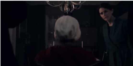
Fotograma 11 La madre de Hannah en Gilead habla con Defred. 3x01 / HBO