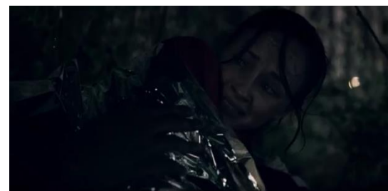
Fotograma 14 Emily huye de Gilead con el bebé de June. 3x01 / HBO