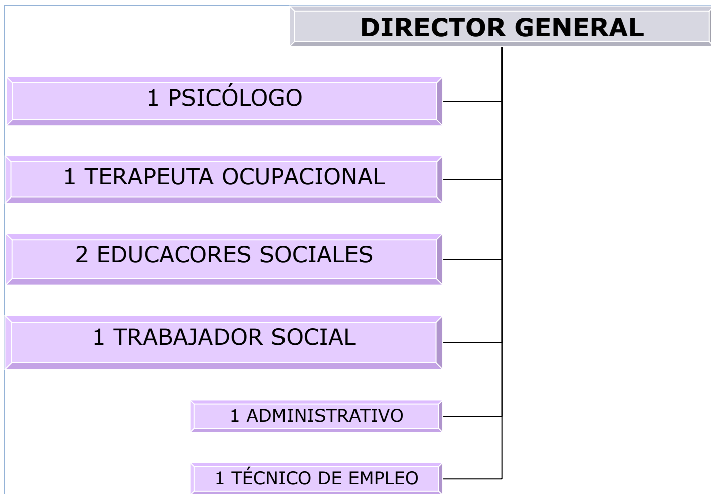
Figura 1. Organigrama del Centro de Día de Rehabilitación Psicosocial para enfermos mentales graves.

En la Figura 1 se muestra el organigrama del Centro de Día para enfermos mentales graves.