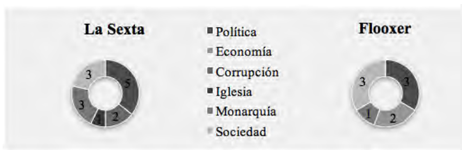
Figura 4. Tabla indicativa del tema o los temas que aparecen en la muestra investigada