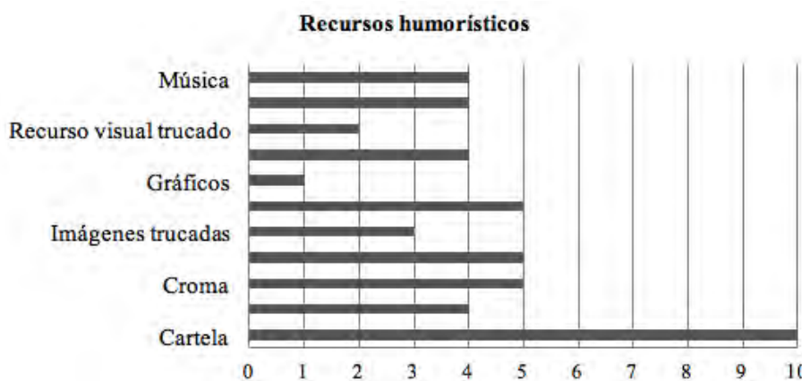
Figura 5. Tabla resumen del uso de los recursos humorísticos.

En Flooxer los recursos de animación y los grafismos en movimiento son el ingrediente especial, mientras que en La Sexta son más habituales las imágenes reales satirizadas a que, además, se unen a la progresiva utilización de rótulos y otros recursos visuales además de locuciones y la música. En cuanto al escenario, con el objetivo de dar mayor cercanía el Informe Mongolia se graba con una cafetería de fondo en una mesa de bar en directo y falso directo, mientras que los contenidos para Flooxer se elaboran en un croma, es decir, en un espacio de estudio con una postproducción posterior. Todos los espacios tienen cartela y los presentadores aparecen con la camiseta de la revista, asimismo en algunos se muestran portadas o recursos generados por la publicación.