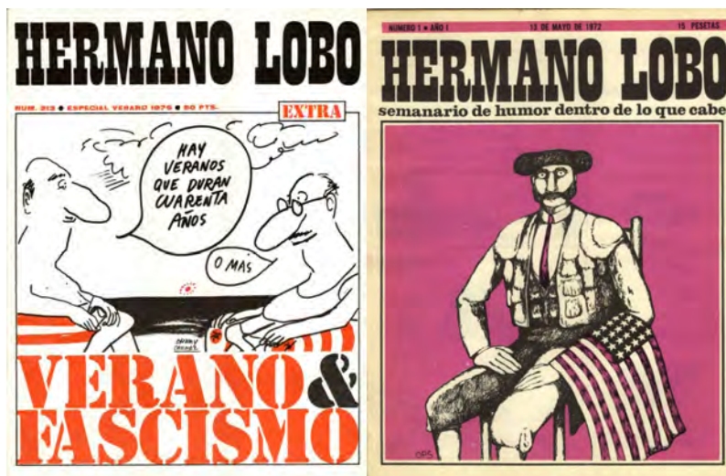
Figura 1. Imágenes del primer y último número de la revista satírica Hermano Lobo

la censura. “ Hermano Lobo militó activamente contra el régimen, ayudó a descifrar las claves de la actualidad”, asegura Tubau (1987: 244). “Los 213 números publicados desde el 11 de mayo de 1972 hasta el 6 de junio de 1976, son un modelo de crítica mordaz e irreverente hacia el poder del franquismo y la sociedad que lo sostenía, incluida la Iglesia Católica”. Así comienza su análisis sobre Hermano Lobo Vélchez de Arribas (2015) quien anuda esta idea con los hechos de secuestros, expedientes administrativos y multas que sufrieron por parte del régimen dictatorial.