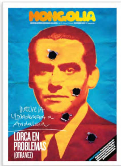
Figura 2. Portada de Mongolia en diciembre de 2018