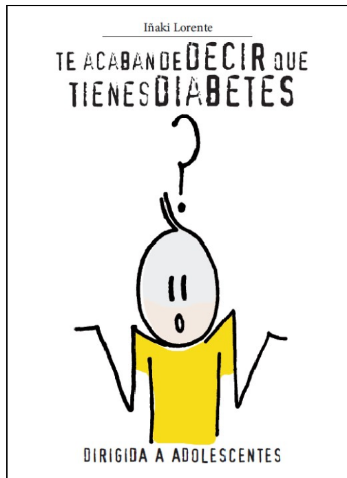
Fig 3. Portada del libro que sirvió como guía para el trabajo de orientación tutorial.

Como conclusión, esta asignatura contribuye a asumir la parte emocional del ejercicio de la docencia. En este sentido debemos sumar todas las sinergias posibles. Y que el desarrollo de la inteligencia emocional es una asignatura tanto para el alumno como para el profesor.