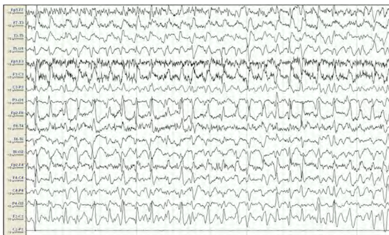
Figura 1 EEG inicial. Sistema 10/20, montaje longitudinal. Actividad de fondo mal diferenciada que es sustituida por descargas epileptiformes difusas de predominio en áreas fronto-centrales derechas, persistentes a lo largo de todo el registro, compatible con estatus epiléptico. Ausencia de señal en la derivación Cz-Pz debido a problemas técnicos.