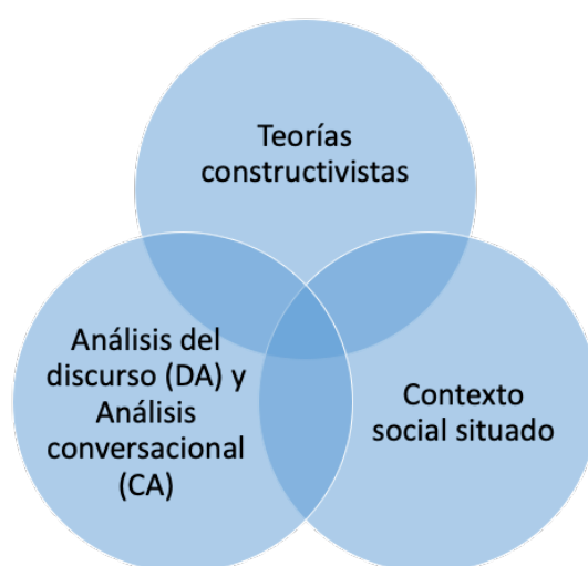
Figura 1. El vínculo educativo, el Triángulo Herbartiano.