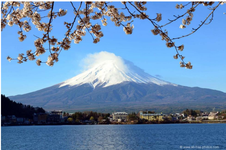
Figura 6: Monte Fuji. Montaña sagrada más famosa de Japón. A los pies de esta montaña hay muchos santuarios y torii que marcan el recinto sagrado de esta venerada montaña.