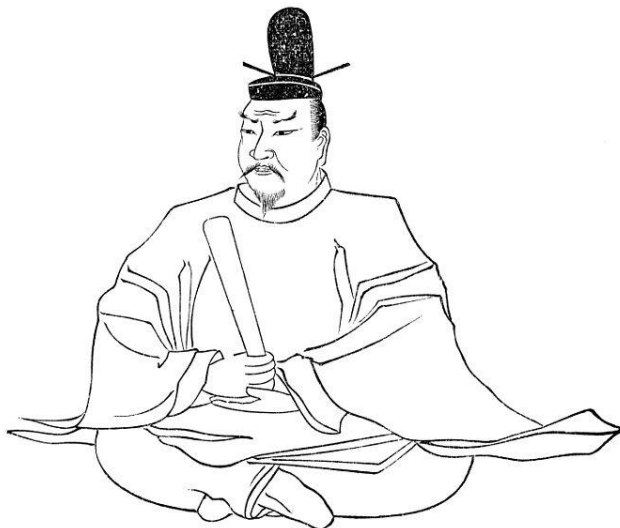
Figura 10: Tenmu tennō. Emperador japonés (672-686).