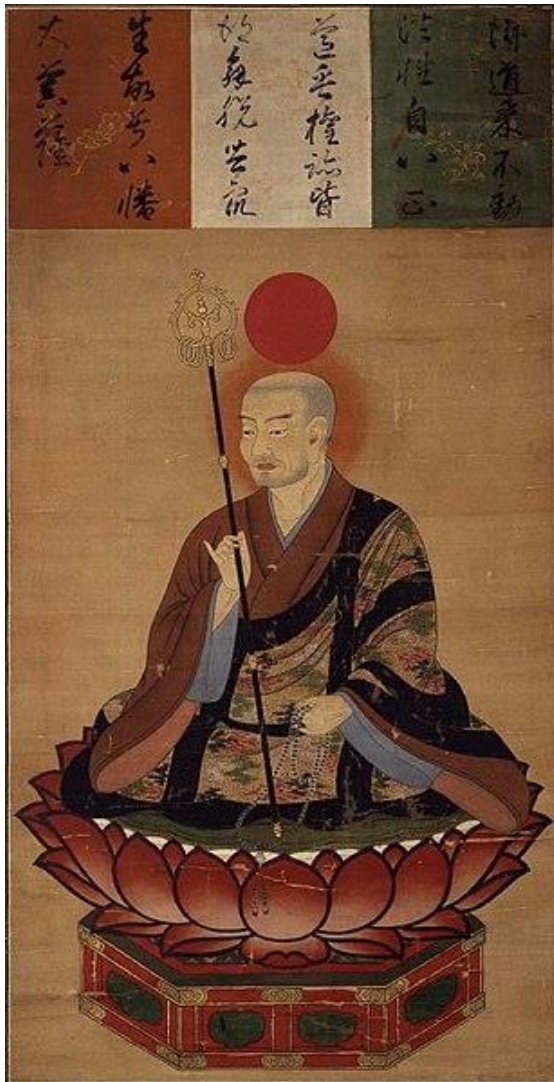
Figura 11: Kami Hachiman representado como un monje budista.