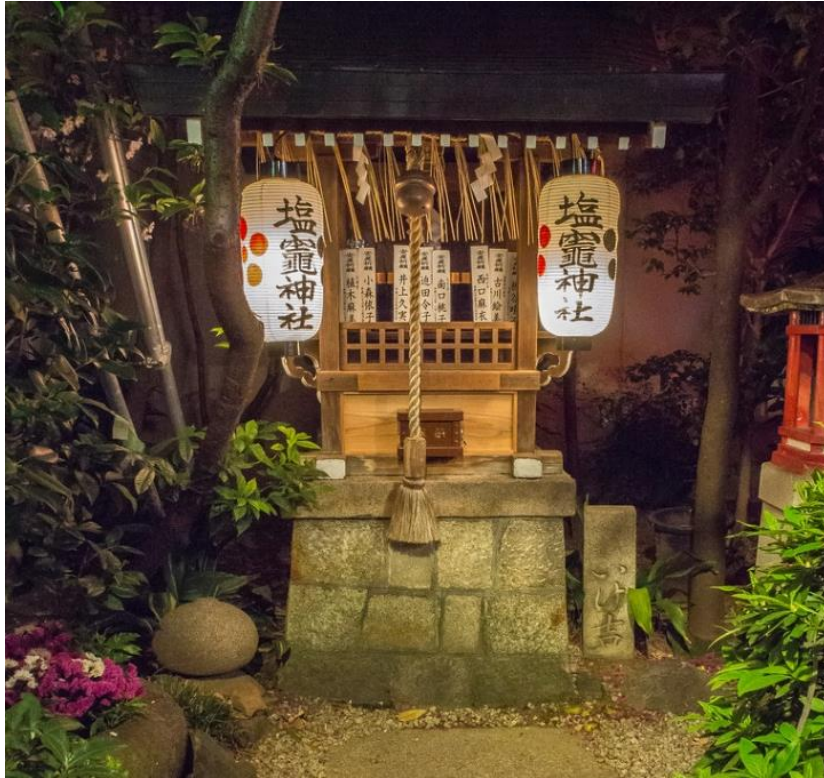
Figura 5: Un pequeño santuario en Kyoto. Como se ve en esta imagen, con una simple cuerda trenzada se delimita lo que es un santuario.