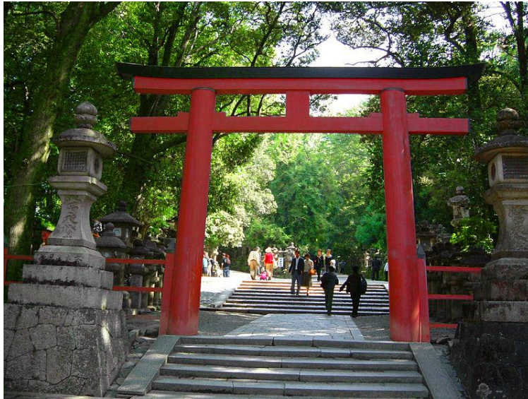
Figura 7: Torii. Paul Synnott. Símbolo religioso sintoísta que delimita la entrada a un recinto sagrado