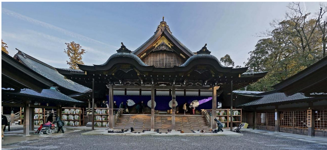
Figura 8: Santuario de Ise. Santuario más importante de la religión sintoísta. Se venera a la diosa del Sol Amaterasu