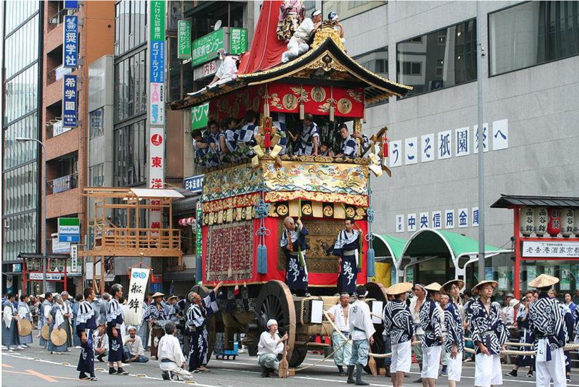
Figura 9: Gion Matsuri. Corpse Reviver. Festival más famoso de Kyoto celebrado en el mes de julio. En sus orígenes el objetivo era apaciguar a los dioses para que los desastres naturales no destruyeran Kyoto, pero actualmente es una fiesta que ha trascendido el terreno religioso hasta aglutinar a creyentes y no creyentes.