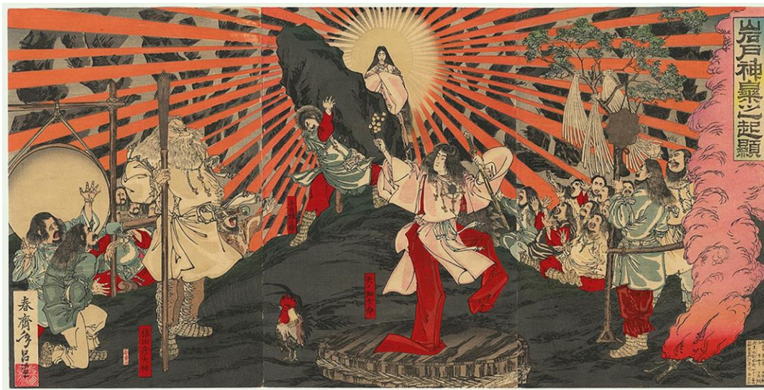
Figura 4: Diosa del Sol Amaterasu saliendo de la cueva . Shunsai Toshimasa. Pintura del siglo XIX del mito de la cueva de Amaterasu que refleja el momento en el que Amaterasu sale al exterior por la curiosidad que le profesaba la fiesta que varios kami estaban realizando con el fin de forzarla a salir y que el Sol volviera a iluminar la Tierra.