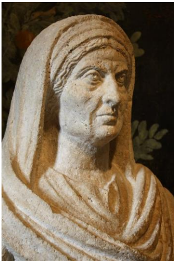
Retrato 3. Posible busto de Julia Maesa. Actualmente en el Museo de Arqueología y Antropología de la Universidad de Pennsylvania (Estados Unidos), datada entre de principios del s. III.