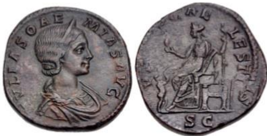
Figura 1. Denario de Julia Soemias. Reverso: Venus Caelestis SC . La diosa se muestra sedente y frente a ella Cupido.