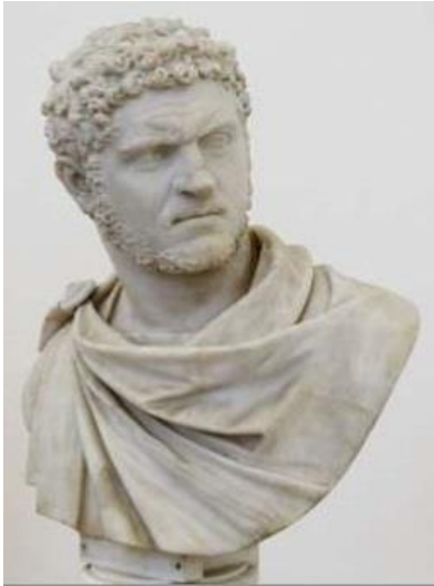
Retrato 3. Busto del emperador Antonio Basiano, conocido como “Caracalla”. Actualmente en el Museo Nacional de Nápoles, datado del años 212 d.C.