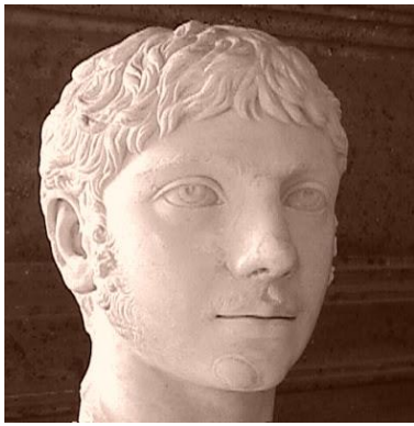
Retrato 4. Busto de Elagábalo datada entre el 218-222, actualmente en el Museo Capitolino (Roma).