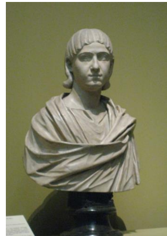
Retrato 4. Busto de Julia Mamea. Actualmente en el Museo de Arqueología y Antropología de la Universidad de Pennsylvania, datada entre el 218-235 d.C.