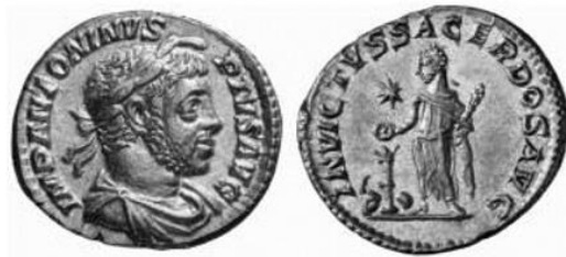
Figura 4. Moneda de Elagábalo. Reverso: INVICTVS SACERDOS .