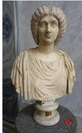
Retrato 2. Busto de la emperatriz Julia Domna, datada del s. II. Actualmente en el Musée des Beaux Arts (Lyon).