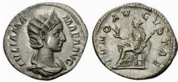
Figura 3. Moneda de Julia Mamaea. Reverso: MATER AVGVSTAE ET CASTRORVM