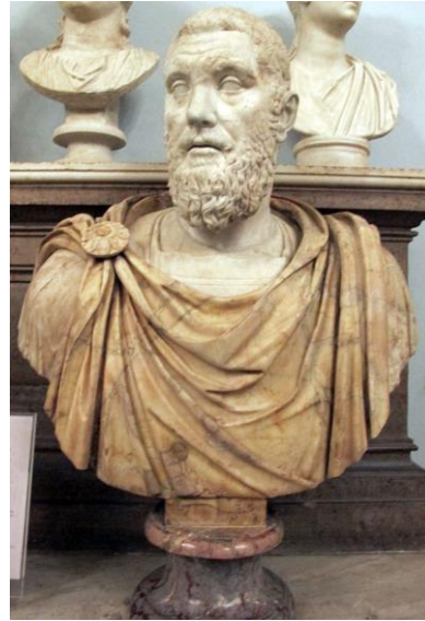
Retrato 4. Busto del emperador Opelio Macrino, datado del s. III. Actualmente en el Museo del Capitolio (Roma).