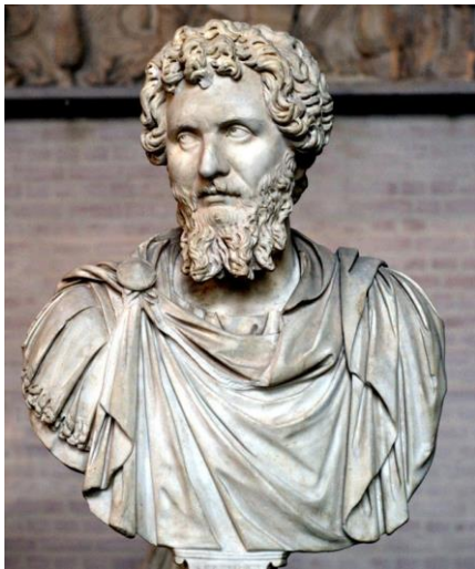
Retrato 1. Busto del emperador Septimio Severo, datada de principios del s. III. Actualmente en el Museo Capitolino (Roma).