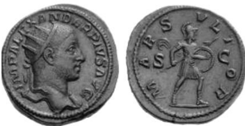
Figura 6. Moneda de Alejandro Severo. Reverso: MARS VLTOR