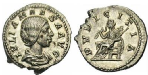
Figura 2. Denario de Julia Maesa Reverso: Pudicitia .