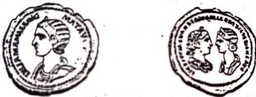
Figura 5. Moneda de Julia Mamaea con la leyenda: JULIA MAMEA AVGVSTAE MATRIS AVGVSTAE , y en el reverso Alejandro Severo con su esposa Orbiana con la leyenda: IMP SEV ALEXANDER AVGVSTVS SALL BARBIA ORBIANA AVGVSTAE