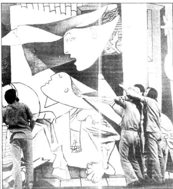
Un momento de la prueba realizada en mayo pasado, en el Casón del Buen Retiro, para la colocación del Guernica .

Illego Caverro trae el cuadro sin formalizar la póliza de seguro