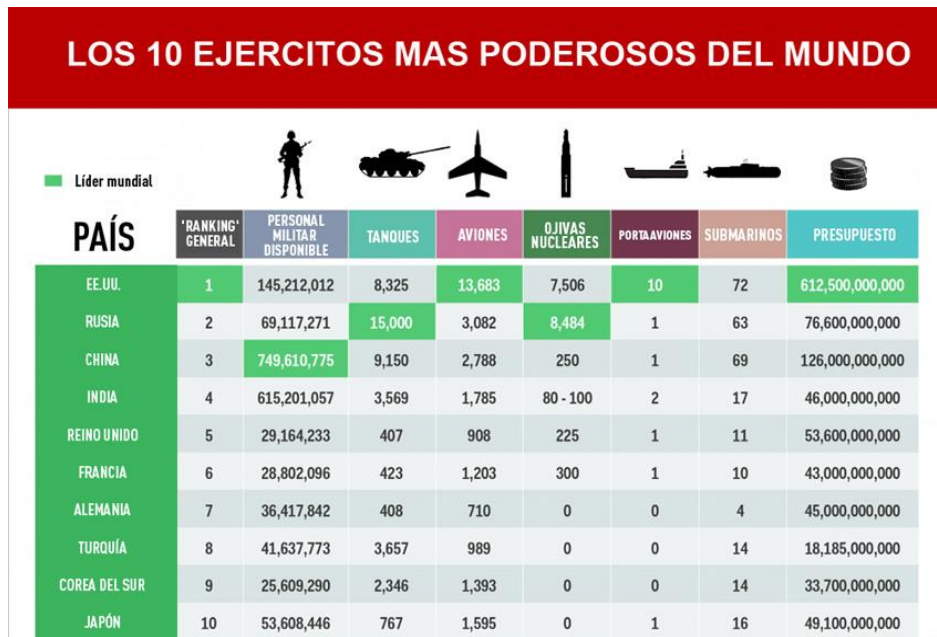
Figura 1. Ejércitos más poderosos del mundo.

conclusión, no del mayor gasto, sino de los mejores ejércitos. En este caso, el ejército más poderoso del mundo sería el norteamericano, seguido de Rusia, y en un tercer puesto estaría China (característica de su poder es el número de efectivos).