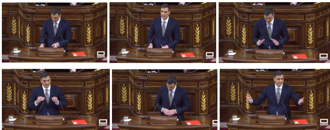
Imagen 19. Sánchez señala los puntos principales de su programa: estabilidad institucional, macroeconómica, presupuestaria, social, laboral, medioambiental y territorial. Gestos reguladores, ilustradores.

Cuando se refiere a su programa, por enésima vez, ajusta sus notas y de forma enérgica enumera los puntos principales. Mueve las manos a un lado y a otro, entrelaza los dedos levemente y los separa abriendo los brazos con las palmas de las manos hacia arriba haciendo un barrido visual (sensación de control).