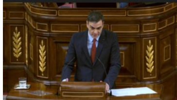
Imagen 59. Fuente: Congreso de los diputados. (2020). “Señor Echenique, nuestros partidos son el ejemplo de colaboración”. Gesto regulador.

Con una ligera sonrisa dirige la mirada al portavoz de Unidas Podemos para manifestarle su agradecimiento a la vez que lo hace extensivo a todos los que apoyan la prórroga del Estado de Alarma.