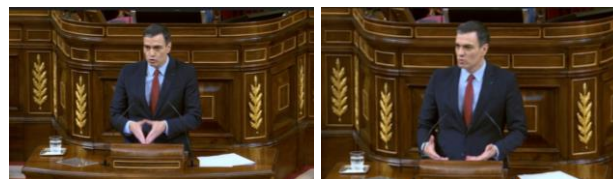
Imagen 67. Fuente: Congreso de los diputados. (2020). “Contribuyamos con debates constructivos a dar credibilidad al debate”. Gesto ilustrador.

Con manos en ojiva y un cierto tono aniñado, el socialista manifiesta la buena predisposición de todos para superar la crisis, pero a continuación con un requiebro en la voz afirma que hay debates que no ayudan, que confunden y retrasan el logro de los objetivos. Aleteando las manos con las palmas hacia arriba exige a los diputados que contribuyan a dar certeza y credibilidad a los debates.