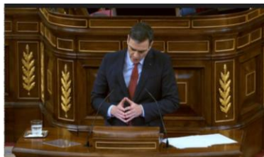
Imagen 60. Gesto ilustrador.

El presidente muestra firmeza, mantiene los codos pegados a su cuerpo y las manos en posición mudra equilibrante. Las medidas adoptadas no buscan el sacrificio de un territorio frente a otro. La actitud del ejecutivo es mesurada y las restricciones son para todos los ciudadanos el tiempo que dure el Estado de Alarma, ni un día más.