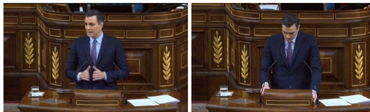
Imagen 30. “Por un lado, se perfilará la España que se une para avanzar formando una coalición de progreso, diálogo y justicia social. En medio, quienes no quieren sumarse, pero al menos no lo impiden con su abstención. Y de otro lado, la España que bloquea sin alternativa, sin solución, sin horizonte, sin respuesta. Solo ‘no’”. Gestos ilustradores.

El líder socialista comparece para pedir la confianza de la mayoría de la Cámara al partido que lidera. Con las manos enfrentadas, aproxima levemente las yemas de los dedos. Mueve las manos despacio al ritmo de sus palabras, habla de la España que quiere avanzar al tiempo que coloca sus manos ligeramente separadas con las palmas hacia arriba. Repite esta secuencia cuando recrimina la actitud de los que no quieren apoyar la coalición de este futuro gobierno y se abstienen y, de los que situándose en los extremos ideológicos bloquean el proceso democrático. Sánchez vuelve a la posición inicial de la que parte al terminar su idea colocando las manos en los laterales del atril.