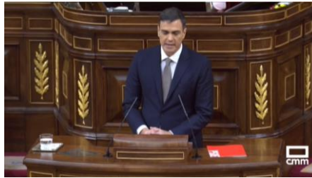
Imagen 4. Artículo 1º de la Constitución, España es un estado social democrático de derecho . Gesto ilustrador

Un Pedro Sánchez rígido y contenido entrelaza sus manos intentando evitar los microgestos que puedan distraer la atención de los asistentes.