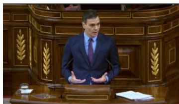
Imagen 41. Expone las diversas medidas. Gesto ilustrador.

Remarca la idea de que “nadie se quedará atrás” al tiempo que muestra sus manos y las balancea con movimientos cortos y contenidos. Habla de duras medidas para todo el territorio nacional, levanta la cabeza y sin fijar la mirada se dispone a enumerar alguna de ellas.