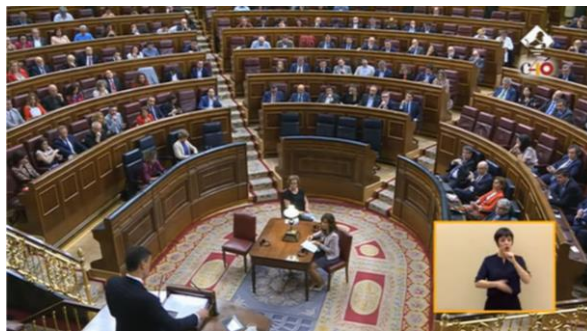
Imagen 23. Intervención de Pedro Sánchez en la sesión plenaria.

La moción de censura se realiza en el Salón de sesiones del Pleno del Congreso, un espacio solemne en el que sus Señorías escuchan con atención las palabras de Pedro Sánchez. El Hemiciclo exige el cumplimiento de la normativa del Reglamento del Congreso, por eso la distancia entre los diputados es la que está establecida. Esta situación se repite en la investidura.