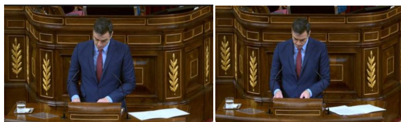
Imagen 70. Rostro en tensión.

Su presencia varía en cada comparecencia. El líder socialista mejora en cada sesión, su lenguaje es más estudiado y controla mejor su gestualidad. Aun así, la presión en sus labios, la tensión en su rostro y la mirada descendente son indicios de falta de autenticidad.