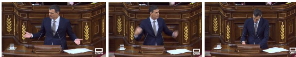
Imagen 22. Sánchez muestra su enfado. Gestos ilustradores.

Podría decirse que Pedro Sánchez es previsible: una y otra vez separa sus brazos colocando las palmas de sus manos hacia arriba, mueve las manos de arriba abajo con la intención de ilustrar y acompañar el mensaje. El líder socialista muestra un punto de soberbia cuando manifiesta su enfado. No para de tocar los folios y los revisa de forma compulsiva. Estos gestos manipuladores duran apenas unos segundos y por lo general significan que Sánchez no está cómodo. Puede que su discurso pierda espontaneidad al ajustarse a un guion y que resulte, muy a su pesar, distante.