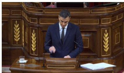
Imagen 82. Fuente: Congreso de los diputados. (2020). Sánchez señala que con los Fondos de Cohesión se podrá realizar una “transición justa y fomentar un empleo de calidad”. Gesto ilustrador.

Muestra seguridad, la sexta prórroga va a ser aprobada, por lo que aprovecha para fundamentar las decisiones tomadas y explicar los efectos obtenidos. El líder socialista sacude el brazo derecho apuntando con el dedo índice, no eleva la voz, pero su tono grave es suficientemente explicativo.