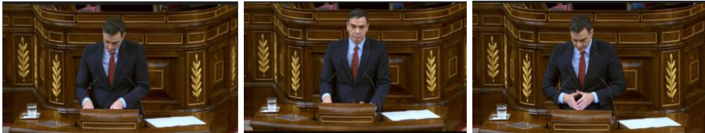
Imagen 53. Fuente: Congreso de los diputados. (2020). Expone la línea cronológica de actuación. Gesto ilustrador y gesto regulador.

Sánchez coloca las manos en “V” señalando al suelo, un gesto ilustrador que refleja autoridad.