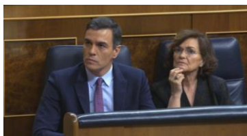
Imagen 34. Gabriel Rufián afirma: “¿Qué creen que ha pasado para que el candidato a la presidencia del Gobierno pase de decir una cosa a decir otra? ¿Qué provoca tanto bandazo? Se lo digo yo: el miedo a esta gente”.

Uno de los políticos más críticos en sus réplicas a Sánchez es el diputado de Esquerra Gabriel Rufián. Al escuchar sus fundamentos, tensa la mandíbula, aprieta los labios y mira atento al diputado mientras aguanta sus descalificaciones.