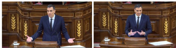
Imagen 85. Fuente: Congreso de los diputados. (2020). Gestos ilustradores, gestos reguladores y posturas expansivas.

El resto del debate es más de lo mismo: confrontación política, gestos severos, expresiones altivas y un exceso de reafirmación personal.