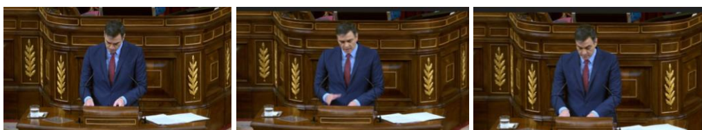
Imagen 78. Fuente: Congreso de los diputados. (2020). Paralingüística.

En general, utiliza las pausas y los incisos para marcar el ritmo del debate. Se vuelve agitado en las situaciones más enrevesadas, fundamentalmente en las réplicas y contrarréplicas.