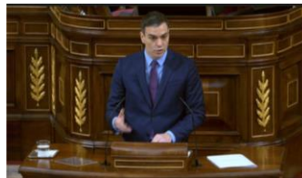
Imagen 40. Utiliza los gestos ilustradores para argumentar la declaración de Estado de Alarma.

A diferencia de otras comparecencias Sánchez se muestra contenido. La forma de apretar los labios y tragar saliva revela moderación emocional. El presidente argumenta la declaración de Estado de Alarma haciendo uso de estos gestos reguladores como la única salida a la crisis del coronavirus.