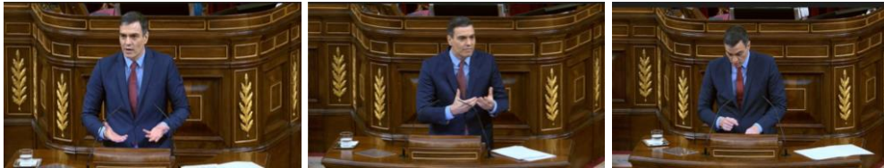
Imagen 75. Fuente: Congreso de los diputados. (2020). “El confinamiento se ha llevado a cabo para evitar más contagios y así ganar más tiempo. Por eso pido unidad y lealtad a todas las fuerzas políticas”. Gestos ilustradores.

El estilo de Pedro Sánchez en sus intervenciones es en general moderado, lo remarca con el gesto ilustrador de colocar las palmas de las manos hacia arriba en un arranque de honestidad y sinceridad. Une las puntas de sus dedos cuando expone la necesidad de mantener la unidad del país pidiendo de nuevo tiempo y lealtad. Agita las manos acaloradamente cuando enumera las medidas extraordinarias que el ejecutivo ha llevado a la práctica y los efectos que están teniendo y señala sus notas inclinando la cabeza cuando alude a actitudes poco solidarias por parte de los líderes conservadores.