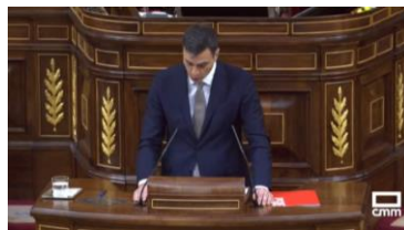
Imagen 11. Fuente: CMM (2018). “Nunca antes una moción de censura como la que se debate hoy ha sido tan necesaria”.

Con los brazos separados Sánchez apoya las manos en el atril, muestra seguridad. Recibe aplausos.