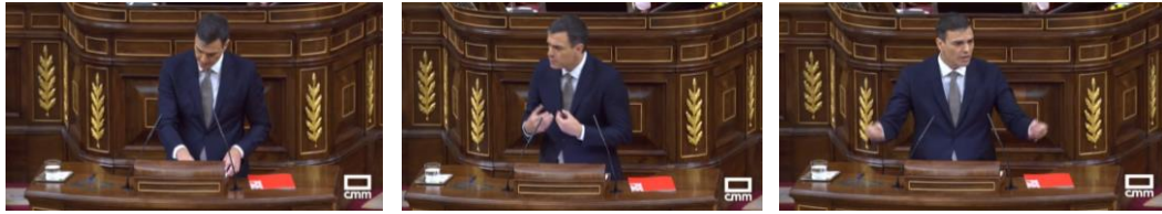
Imagen 10. “El pronunciamiento de la justicia de la semana pasada incluye demoledoras afirmaciones en torno a la propia figura del que hoy ocupa el cargo de presidente del Gobierno”. Gesto adaptador y gestos ilustradores.

Rajoy corrige su postura. Con tono firme hace referencia a las resoluciones judiciales recientemente emitidas.