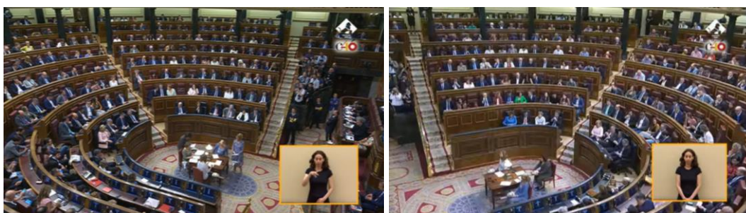
Imagen 24.

Tras la votación final, queda aprobada la moción de censura y Pedro Sánchez es elegido presidente del Gobierno por una ajustada mayoría de 180 votos.