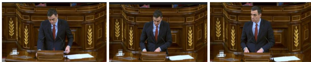
Imagen 58. “Señor Abascal no voy a polemizar con usted, pero quiero recordarle dos cosas: ustedes no han defendido nunca lo público y ustedes no han gestionado nada”. Gesto regulador.

El jefe del ejecutivo no oculta su aversión política por VOX. El rostro del presidente muestra desprecio cuando se dirige a Abascal. Lo manifiesta en las comisuras de sus labios, que se retraen hacia la mejilla.