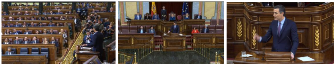
Imagen 32. Fuente: Congreso de los diputados. (2020). Pide respeto para continuar mientras mantiene la mirada a la bancada azul. Gestos ilustradores.

Su conducta, un tanto desafiante, le impide frenar su locución a pesar del ruido de fondo que se escucha en el hemiciclo. Un instante después, apoya el brazo izquierdo en el estrado y moviendo el derecho suavemente de arriba abajo pide respeto a la Cámara mientras mantiene la mirada a los diputados conservadores.