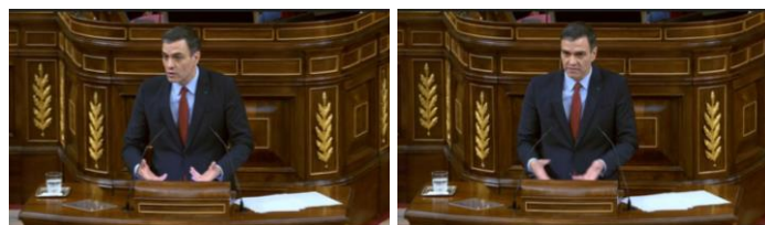
Imagen 61. “Hay que ser equilibrados en las restricciones que ponemos al conjunto del país”. Gesto ilustrador.

El Gobierno sabe que estas medidas no son fáciles. Con las palmas hacia arriba hace referencia a la necesidad de ser equilibrados y prudentes en la toma de decisiones, las consecuencias económicas serán graves y la recuperación lenta y dolorosa. No hay certidumbres absolutas, pero todo el esfuerzo del gobierno, según él, está orientado a evitar que se produzcan contradicciones que generen más incertidumbres de las necesarias.