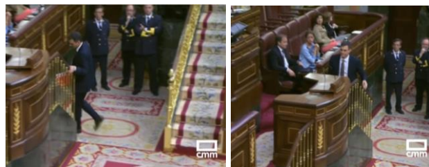
Imagen 2. El candidato a la Presidencia sube a la tribuna.

El líder de la oposición, en uno de los momentos más tensos de su carrera política, se encamina cabizbajo hacia la tribuna de oradores esbozando una ligera sonrisa con la intención de transmitir seguridad. En unas décimas de segundo mira al frente. Su rostro serio y la ausencia de gestualidad corporal muestran la tensión predice un discurso tenso y verbalmente agresivo.