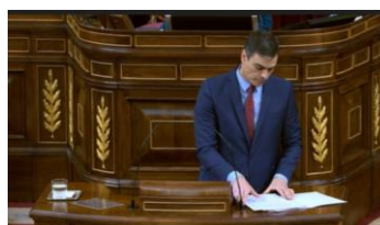
Imagen 77. Recoge los apuntes para retirarse a su escaño.

El orador termina su intervención, aprieta los labios, recoge sus notas y con rostro serio abandona el estrado para dirigirse cabizbajo a su escaño.