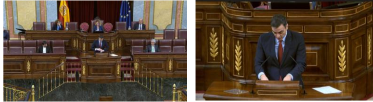
Imagen 66. Fuente: Congreso de los diputados. (2020). Pide unidad y la lealtad a los grupos parlamentarios. Gestos adaptadores.

El ritual de inicio del presidente se repite. Los mismos gestos adaptadores: se abrocha la chaqueta, ajusta los micrófonos, ordena los folios y apoya sus manos en el atril. La respuesta de Sánchez es la misma. Con voz firme hace un llamamiento a la unidad.