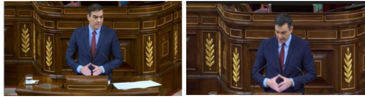
Imagen 71. Fuente: Congreso de los diputados. (2020). "El coronavirus es una gran amenaza para la salud pública del planeta. Son tiempos estremecedores, extraordinarios y requieren de medidas excepcionales". Gestos ilustradores.

Relajar alguna medida restrictiva en este momento supone un riesgo, el lenguaje no verbal de Sánchez muestra confianza en las medidas tomadas por su equipo.