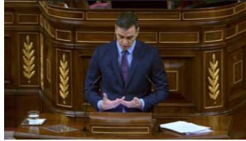
Imagen 42. Remarca las ayudas económicas a los grupos más vulnerables. Gestos ilustradores.

Detalla la larga lista de intenciones, entrelaza sus dedos y con este gesto ilustrador controla el ritmo del discurso. El orador utiliza los ilustradores para acompañar las palabras y darles dinamismo sin modificar su contenido pues son emocionalmente neutros.