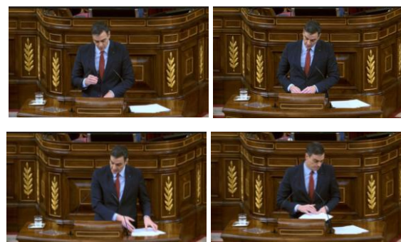
Imagen 68. Fuente: Congreso de los diputados. (2020). “Con el ánimo firme, el corazón caliente y la cabeza fría doblegaremos la curva y lograremos vencer al virus”. Gesto ilustrador.

El rostro de Pedro Sánchez muestra cansancio. El líder socialista levanta las cejas, se le marcan arrugas en la frente, aprieta los labios y mira hacia delante. Con energía y marcando sus palabras une el dedo índice y el pulgar de su mano derecha para expresar que el ejecutivo trabaja en la dirección adecuada para doblar la curva de la crisis y vencer al virus. Tratando de gestionar su emoción aprieta los labios al tiempo que anima a mantener firme el espíritu de lucha aun a sabiendas que llegarán días oscuros e inciertos. Recoge sus notas circunspecto.