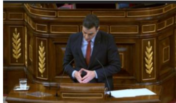
Imagen 56. Fuente: Congreso de los diputados. (2020). “Madrid nos necesita. Mañana puede ser Barcelona u otra ciudad”. Gesto ilustrador.

Ante cualquier duda se muestra categórico, une los dedos de ambas manos y reitera sus palabras pues “sólo el tiempo, la unidad y la lealtad nos ayudará a enfrentar al enemigo común, el virus”.