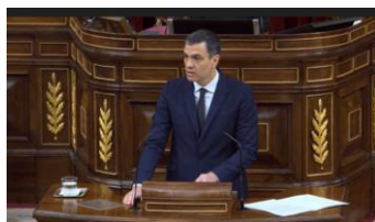
Imagen 79. Sánchez en la solicitud de la 6ª prórroga de Estado de Alarma.

Pedro Sánchez mantiene su estilismo, traje azul marino de dos piezas de corte Slim fit que utiliza en las ocasiones formales, camisa blanca, cuello collard club (terminado en puntas redondas), y corbata azul oscura. No arriesga, opta por la corrección. Una vez más un Sánchez ceremonioso acierta en lo que a la elección del uniforme de batalla se refiere.