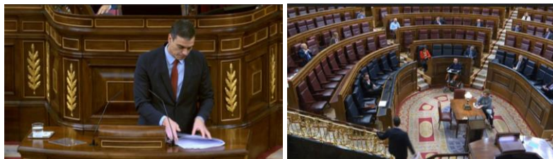
Imagen 65. Se retira a su asiento.

Sánchez recoge sus notas con gesto ensimismado y vuelve a su asiento.