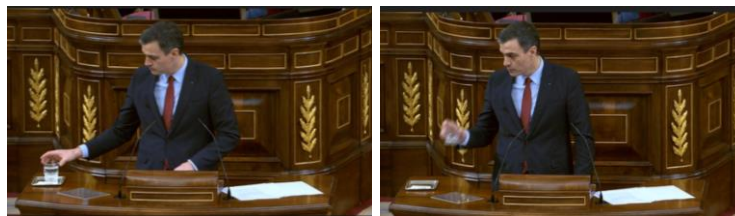
Imagen 57. “El enemigo es el virus y espero que lo entendamos”. Bebe agua mientras mira al Señor Casado.

Con esa actitud altiva, Sánchez les dice que no va a perder ni un solo minuto, ni una pizca de energía en justificarse, su enemigo a batir ahora es la COVID-19 y quiere que lo entiendan (bebe agua, mira a Casado, recibe el aplauso de su grupo).