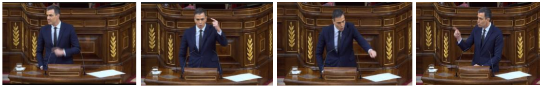
Imagen 86. Fuente: Congreso de los diputados. (2020). “Con este Gobierno no se va a producir nunca una mal llamada policía patriótica”.

“Este Gobierno ha respetado siempre la independencia judicial. Con este gobierno no ha habido ni habrá una intrusión política en las Fuerzas y Cuerpos de Seguridad el Estado. Y ¿sabe lo que ocurre?, que atacan al ministro que está destapando esa policía política suya”, Sánchez utiliza su tono más convincente para respaldar la actuación del ministro del interior Fernando Grande-Marlaska. En un momento de su defensa introduce la mano derecha en su bolsillo y, separando de su cuerpo el brazo izquierdo, lo mueve de arriba abajo señalando en diferentes direcciones. Sánchez extrema la vocalización de sus palabras. Transmite tensión y agresividad.