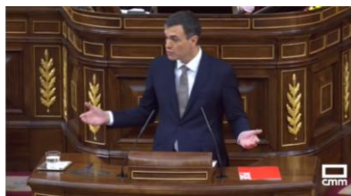
Imagen 17. Postura expansiva.

Con una actitud expansiva, el orador defiende que es el momento de la regeneración democrática y de dar un paso hacia delante como única alternativa. El sentimiento de poder activa la mente y modifica la posición corporal. La ocupación de un mayor espacio vital, mantener una posición erguida, levantar la barbilla, abrir los brazos y mostrar las palmas abiertas reafirman lo que dice.