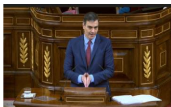
Imagen 74. "Hay que ser consciente del horizonte temporal a la hora de tomar decisiones". Gesto ilustrador.

El líder socialista une sus manos al tiempo que las agita para ilustrar y señalar de forma reiterativa la importancia de mirar hacia futuro.