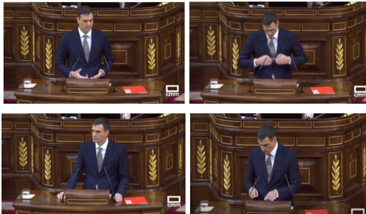
Imagen 16. “No basta que su partido haya sido condenado como responsable a título lucrativo, no basta que en la misma semana conozcamos que su propio portavoz parlamentario hasta el año 2008 haya ingresado en prisión por supuestos delitos de corrupción”.

Cuando retoma las cuestiones de corrupción dirige la mirada al Grupo Popular recordándoles los novecientos cargos públicos imputados. Son muchos los datos sobre los que Sánchez apoya su discurso. Señala con la mano los folios, enumera el listado de causas pendientes para terminar afirmando que la razón está de su lado.