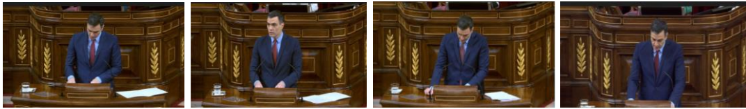
Imagen 69.

Las camisas elegidas en tono azul claro presentan un aspecto impoluto y se aprecian escrupulosamente planchadas.