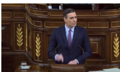
Imagen 28. “No somos nosotros quienes hemos decidido la conformación de esta Cámara, han sido con su voto los españoles”. Gesto ilustrador.

Pedro Sánchez se presenta, en general, más tranquilo que en otras locuciones. Cabe reseñar la agresividad con la que inicia una de sus réplicas al señalar con el índice de su mano derecha el atril, y subrayar la intención de su gobierno de “no romper la Constitución y de mantener el país firme”.