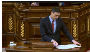
Imagen 52. Antes de retirarse señala la importancia de la cooperación y la necesidad de una actuación conjunta.

Aclara que su compromiso de transparencia con la Cámara y los ciudadanos está garantizado. Aprieta los labios, tensa los músculos cigomáticos y repasa los folios colocados a su izquierda. La comunicación es una secuencia que hay que interpretar, los gestos y las palabras deben fluir conectados.