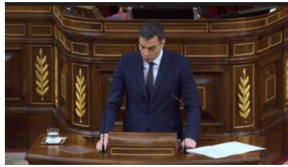
Imagen 80. Fuente: Congreso de los diputados. (2020). “Digamos no al veneno del odio”. Gesto adaptador.

como detonante y produce crispación, que los insultos y las descalificaciones son el veneno que alimenta el odio y que esto no va con él.