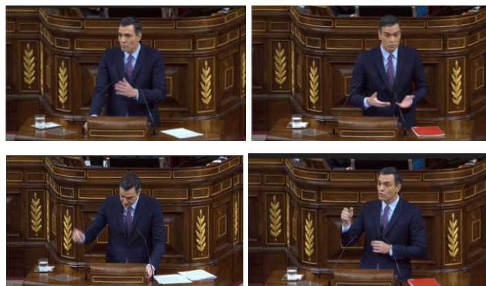
Imagen 33. Gestos ilustradores.

Los enfrentamientos amenazan la seguridad del candidato. Pese a ello, sus movimientos son vehementes, enérgicos y provocadores. La intención de un político es la de mantenerse un paso por delante de sus adversarios, controlar la situación y no dejar espacio a posibles injerencias. Pedro Sánchez cumple estas condiciones y refuerza con los gestos de las manos el mensaje. Muestra las palmas abiertas y acentúa con el brazo dominante aquello que quiere remarcar.