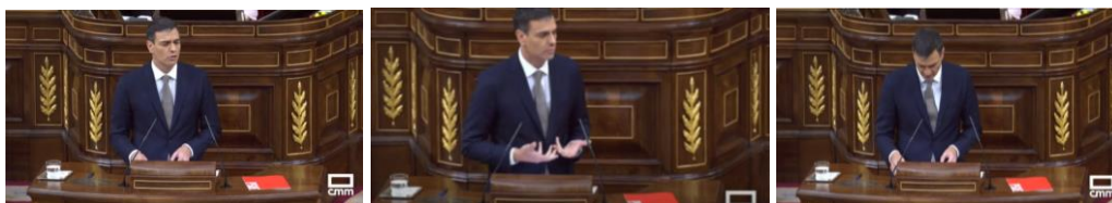
Imagen 15. Ordena los folios una y otra vez (gesto adaptador). Gestos ilustradores.

El líder de la oposición pasa los folios con rapidez. Con una cierta prepotencia dirige su mirada ladeando la cabeza y levantando la barbilla al presidente del ejecutivo. Sus frases toman velocidad, le pide que dimita. Aplausos largos. Sus palabras generan ruido en la Cámara lo que significa que está consiguiendo “mover a algunos de su asiento”, algo hace bien porque siente la incomodidad de los que murmuran. En este punto agita las manos con las palmas hacia arriba lo cual es considerado un indicio de sinceridad. Las palabras fluyen rápidas, acaloradas y frunce el ceño lo que se puede interpretar tanto como una señal de máxima concentración como de una gran tensión emocional. Mira las notas escritas y reitera la culpabilidad de Mariano Rajoy. Detiene su discurso. De nuevo revisa sus notas para acometer otra embestida verbal, aprieta los labios y, de forma más pausada, se dirige a Rajoy para decirle que debe dimitir “ahora” y así poner fin a la moción de censura. Sánchez utiliza demasiado el recurso de las palmas de las manos hacia arriba para representar que lo que dice es verdad y que no hay dobleces en su discurso. En ocasiones, puede dar la sensación de que es un gesto aprendido y trabajado lo que puede dar la impresión de cierto artificio y provocar el efecto contrario. La credibilidad implica coherencia y para ser coherente, lenguaje verbal y lenguaje no verbal deben ir a la par.