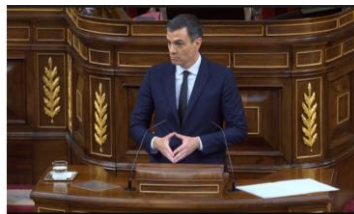
Imagen 84. “Debe volver a la política. Se acabó el berrinche. España necesita estabilidad y gestión ”. Gesto ilustrador.

Los enfrentamientos con las fuerzas conservadoras son broncos. Dirige la mirada al líder de la oposición arqueando las cejas, con un gesto entre desprecio y extrañeza. Coloca las manos en ojiva y se dirige a Pablo Casado, “ojalá me pudiera entender con usted como con el señor Rajoy”.