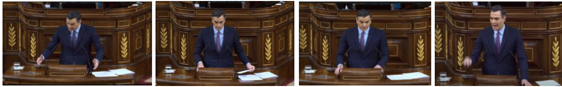
Imagen 31. Fuente: Congreso de los diputados. (2020). “Los españoles fueron de nuevo a las urnas y hubo una preferencia clara. Situaron al PSOE como primera fuerza a gran distancia de la siguiente”. Emblemas, gestos ilustradores, gestos adaptadores.

derecha el atril. Este gesto ilustrador recurrente en sus intervenciones refuerza el mensaje y reafirma su actitud de líder.