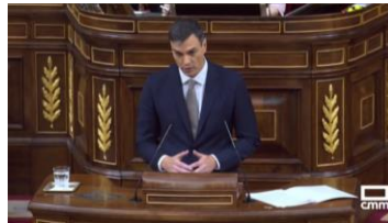
Imagen 21. Posición manos en ojiva (gesto ilustrador).

El líder socialista utiliza en numerosas ocasiones el gesto de las manos en ojiva, gesto que indica seguridad al dar una opinión respecto de lo que acaba de escuchar. Podría entenderse como un punto a favor del que habla, pero Sánchez lo hace poco relajado, muestra rigidez.