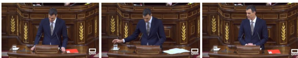
Imagen 20. Fuente: CMM (2018). El candidato vuelve al Congreso por:” coherencia, responsabilidad y democracia”. Gesto ilustrador.

Con las manos apoyadas en el estrado Pedro Sánchez subraya la coherencia de sus actos, “he vuelto para quedarme”. Muestra confianza. Bebe agua. Aplausos. Dirige una mirada desafiante a Mariano Rajoy y la mantiene durante unos segundos. Recibe el apoyo de los suyos en forma de aplausos, vuelve a su asiento.