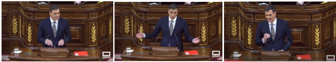
Imagen 7. “Ofrezco una respuesta constitucional a la crisis institucional provocada por el actual presidente del Gobierno. Esta moción de censura es consecuencia de hechos gravísimos”. Gesto ilustrador.

Si se produce una contradicción entre ambos prevalece la parte no hablada, es más rápida, llega al receptor y se fija antes.