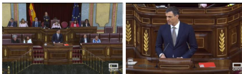
Imagen 3. Agradece el apoyo de su grupo parlamentario (mira a la izquierda), “en cumplimiento con el artículo 113 de la Constitución” (mira a la derecha). Gesto regulador.

Pedro Sánchez se presenta como candidato a la Presidencia del Gobierno. Con aparente serenidad mira a la izquierda, donde se ubica el grupo parlamentario socialista: busca su apoyo a la vez que asiente con la cabeza para agradecer su presencia. Hace mención del artículo 113 de la Constitución para exigir la responsabilidad política al Gobierno mientras dirige la vista a su derecha donde se sitúa el Grupo Popular. Este cambio de mirada es un gesto regulador que tiene como objetivo favorecer el ritmo de la comunicación.