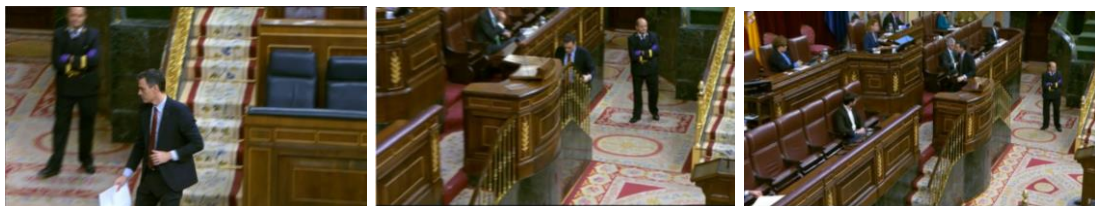
Imagen 46. Fuente: Congreso de los diputados. (2020). Sánchez sube a la tribuna para pedir la prórroga de Estado de Alarma.

Pedro Sánchez se dirige desde su escaño al estrado. Lleva la chaqueta suelta, lo que le permite mayor libertad en sus movimientos.