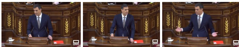
Imagen 12. “Señorías, la corrupción actúa como actor disolvente y profundamente nocivo en cualquier país. Disuelve la confianza de sus gobernantes y debilita los poderes del Estado. Ataca de raíz a la cohesión social”. Gestos ilustradores.

Pedro Sánchez desafía al presidente del Gobierno. La corrupción es uno de los mayores problemas de la democracia pues dinamita la confianza de los ciudadanos en sus dirigentes y en la política. Con el cuerpo sutilmente girado hacia la derecha mueve las manos con las palmas hacia arriba buscando la reacción de Rajoy.