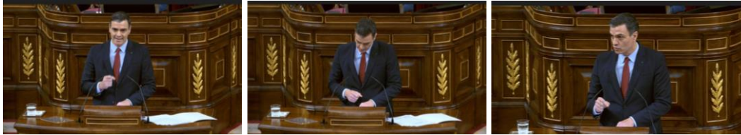
Imagen 51. Fuente: Congreso de los diputados. (2020). Sánchez pide unidad, lealtad y cooperación. Gesto ilustrador.

revisa sus notas y comunica a los diputados que la comisión parlamentaria de sanidad se convertirá a partir de ese momento en la comisión de seguimiento de la COVID-19. Dirige la mirada hacia Casado, y señalando el estrado afirma que es importante para el país mantener la “unidad”, gesto ilustrador.