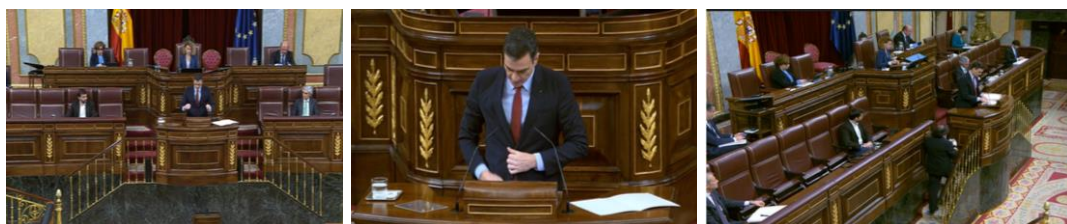
Imagen 47.

Sus primeras palabras son de apoyo a los que han perdido un ser querido, envía su solidaridad a todos los que están atravesando momentos difíciles y agradece el trabajo de los que están en primera línea.