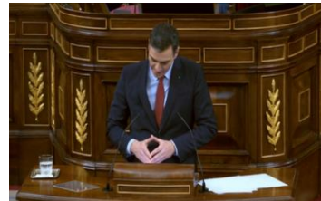
Imagen 64. Fuente: Congreso de los diputados. (2020). “La vida puede ser comprendida y puede ser vivida”. Gesto ilustrador.

Sánchez recoge sus notas con gesto ensimismado y vuelve a su asiento.