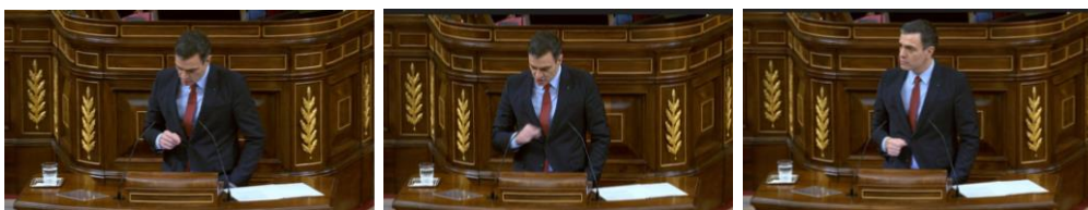
Imagen 55. Fuente: Congreso de los diputados. (2020). “¿Reacción tardía en comparación con quién señorías?” Gestos ilustradores.

Resulta destacable cómo Sánchez, mientras da explicaciones sobre las diferentes formas de proceder ante la pandemia de países como Reino Unido, Alemania, Polonia o Canadá, introduce su mano izquierda en el bolsillo de su pantalón, agita su mano derecha y señala con el dedo índice a los diputados tratando de explicarles la rápida reacción de España. Se oyen unas carcajadas de fondo. La sorpresa del presidente es absoluta, levanta la cabeza y dirige una mirada dura a los diputados. La presidenta de la Cámara, Meritxell Batet, ordena silencio y respeto a sus señorías.