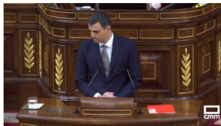
Imagen 5. Junta las manos: “Señorías”. Gestos ilustradores.

Sus gestos de rechazo marcan el discurso. Apretar los labios y fruncir el ceño son algunos de los indicios que hablan de tensión contenida. Sánchez utiliza en exceso las manos como recurso ilustrador, la función de enlazarlas refuerza el mensaje a la vez que, de forma involuntaria, da coherencia al contenido verbal y no verbal.