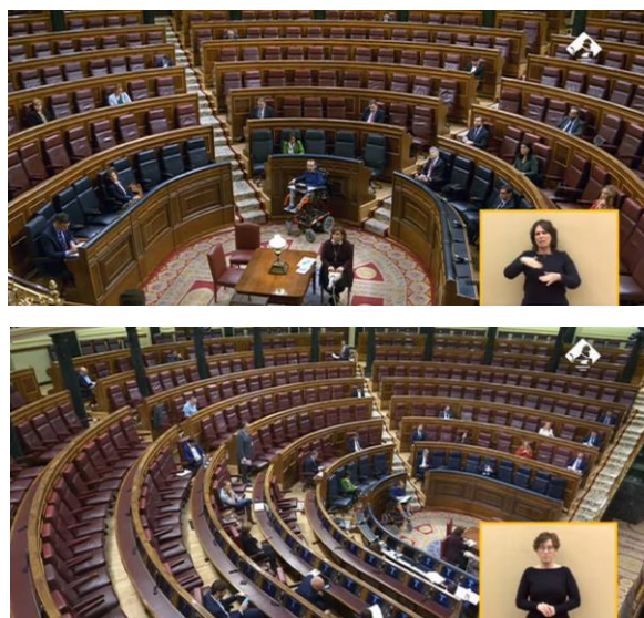
Imagen 44. Fuente: Congreso de los diputados – Canal del Parlamento. (2020). Hemiciclo en Estado de Alarma.

Este inusual escenario se repite en todas las sesiones plenarias celebradas durante el Estado de Alarma, desde su declaración hasta su sexta prórroga.