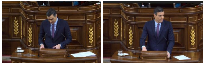
Imagen 29. “Mi intención es buscar el apoyo de varias fuerzas políticas para obtener la mayoría parlamentaria y evitar los bloqueos que no llevan a ninguna parte”.

Dirige la mirada a su grupo, el contacto visual es un eficaz regulador de la comunicación y en este caso se convierte en el mensaje mismo.