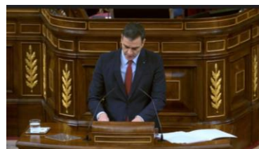
Imagen 49. “Comparezco para solicitar tiempo, un tiempo que permita la adaptación y la resistencia de nuestro sistema de salud.”

Comparece para solicitar “tiempo” para adaptar el país a la difícil situación y hacerle frente. Hay que “resistir”, asiente con la cabeza y espera el apoyo de los presentes cuando constata que “la vacuna hoy somos nosotros y nosotras”.