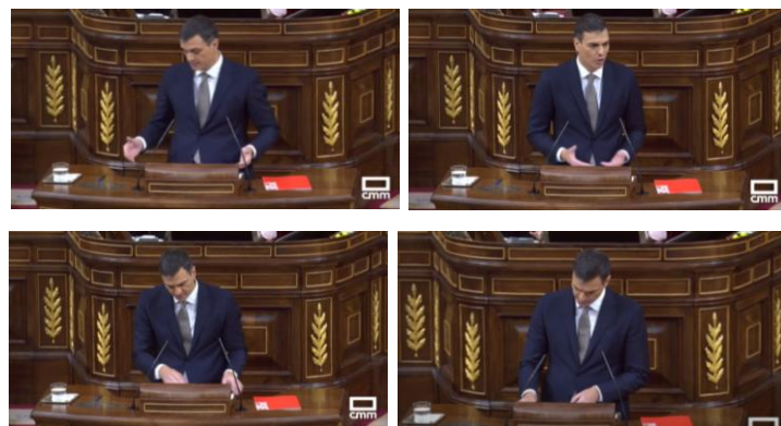
Imagen 9. “Esta moción emana del artículo 113 de la Constitución Española como herramienta legítima de los grupos políticos para exigir responsabilidades al Gobierno”. Gestos ilustradores y reguladores.

Los gestos ilustradores de los que hace uso Sánchez, como juntar y separar las manos, así como el gesto regulador de asentir con la cabeza enfatizan lo que dice verbalmente.