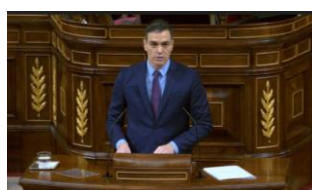
Imagen 36.

En el acto de declaración del Estado de Alarma, Sánchez elige el mismo estilismo que ha utilizado en anteriores comparecencias. Un traje azul noche intenso, camisa azul clara y corbata morada.