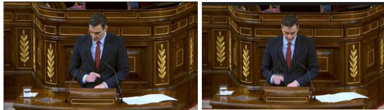
Imagen 48. Fuente: Congreso de los diputados. (2020). “Hemos actuado con medidas económicas, medidas sanitarias, medidas laborables”. Gesto ilustrador.

La dimensión de la pandemia es grave, la realidad sanitaria, económica y social va a cambiar a peor. Sánchez muestra su poder al apuntar con el índice los folios y afirmar que esta prórroga es necesaria para frenar la extensión del virus.