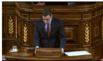
Imagen 54. Fuente: Congreso de los diputados. (2020). “No es momento de reproches políticos”. Gesto regulador.

Encogiéndose de hombros, eleva las cejas, mostrando los labios en forma de “U” invertida y con cara de asombro pregunta: “¿Subestimación del peligro?” Con los datos que hay en este momento todos probablemente actuarían de forma diferente, aclara el presidente, pero aun así, y de forma tajante corta, “no es momento de reproches”.