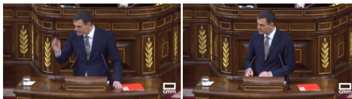
Imagen 14. Insiste en la misma idea: “¿Está dispuesto a dimitir aquí y ahora, Señor Rajoy?” Gesto ilustrador.

Con los hombros hacia atrás, la mano izquierda apoyada en el estrado, la derecha en movimiento arriba y abajo en dirección al bando de sillones azules Sánchez repite el objeto de esta moción de censura, “la necesidad imperiosa de cambio de gobierno”.