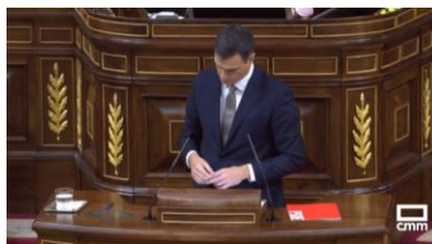
Imagen 8. “Esta moción de censura es necesaria por higiene democrática”. Gesto ilustrador.

A lo largo de su comparecencia hace repetidas alusiones a las herramientas legítimas que la Constitución le otorga (moción necesaria por “higiene democrática”). Cada vez que la nombra cambia su postura corporal, su cuerpo parece más erguido, como si la Constitución respaldara la legitimidad de sus actos. Sánchez muestra una actitud diferente cuando algo le preocupa, se congela, entrecruza las manos y agacha ligeramente la cabeza.