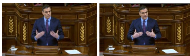
Imagen 38. Gestos ilustradores.

El jefe del gobierno ofrece su visión sobre la realidad del país, cuya evolución acarreará un gran sacrificio social y económico. Sánchez manifiesta que hará todo lo que tenga que hacer y que no ahorrará esfuerzos para superar la pandemia. Utiliza el gesto ilustrador de señalarse a sí mismo con ambas manos asumiéndolo como parte de su discurso con la intención de aumentar el sentido de sus palabras.