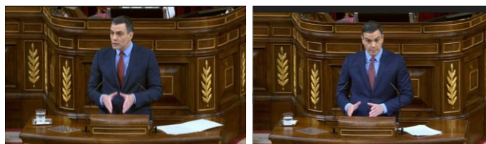
Imagen 72. Utiliza gestos ilustradores para reafirmar sus palabras y gestos reguladores.

Cuando se siente confiado y seguro su gestualidad es buena y coherente, verbaliza de forma rápida, mira directamente a sus adversarios políticos y consigue un mayor quorum.