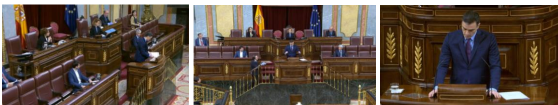
Imagen 37. Inicia su ritual.

Parapetado detrás del atril el presidente inicia su ritual de gestos adaptadores, se ajusta el botón de la chaqueta, acomoda los micrófonos, recoloca sus notas y apoya las manos en el estrado.