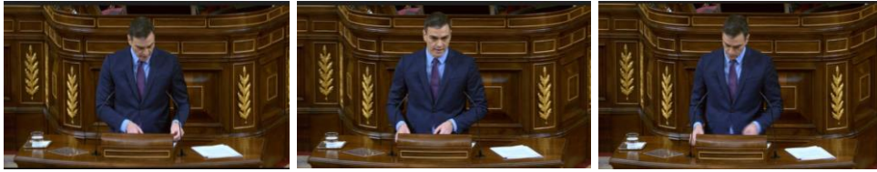
Imagen 39. Intenta no mostrar su nerviosismo.

pausa que hace aprieta los labios y tensiona la mandíbula. No se trata de fingir tanto la intención de lo que quiere transmitir, como si de comunicar con seguridad y convencimiento.