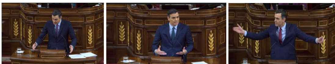
Imagen 27. Muestra una posición expansiva.

Pedro Sánchez utiliza un lenguaje corporal expansivo. Más allá de su discurso, su actitud y su conducta gestual pretender transmitir capacidad. Manifiesta su poder cuando habla ante la Cámara con los brazos extendidos, con una postura erguida y dando la sensación de ocupar un mayor espacio vital. El líder socialista mantiene, en la mayor parte de sus intervenciones, una actitud enérgica, tiene presencia y comunica desde una cierta posición de liderazgo.