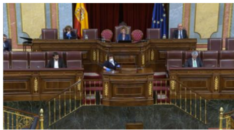
Imagen 45.

El presidente vuelve a la Cámara para solicitar la aprobación de un hecho excepcional: la primera prórroga del estado de alarma. Las medidas de higiene y seguridad son parte de las nuevas directrices que marcarán el día a día de la Cámara.