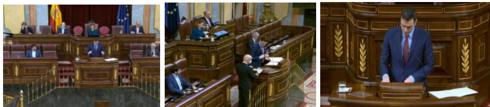
Imagen 73. Fuente: Congreso de los diputados. (2020). "Quisiera comenzar mi intervención, como siempre, con el recuerdo a todos los compatriotas que han perdido la vida a causa de la COVID-19 y agradecemos la labor de los sanitarios". Gestos adaptadores.

El ritual de inicio no ha variado en todos los debates. Ajustar los micrófonos a su altura, centrar el botón de la americana, recolocar los folios y empezar a hablar. Antes de entrar en materia Sánchez recuerda a las personas fallecidas, a sus familiares y agradece el esfuerzo de los sanitarios.