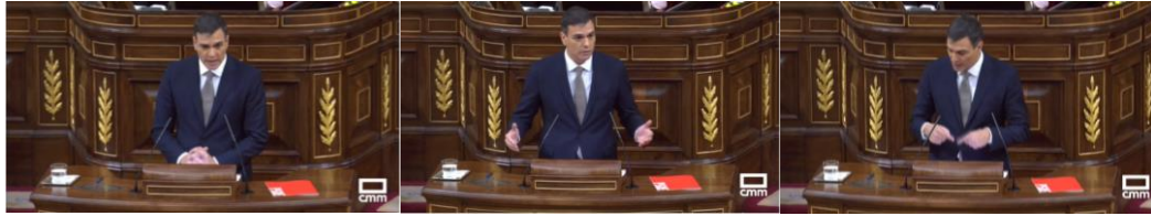
Imagen 18. “Los servidores públicos luchan pequeñas batallas diarias contra quienes se valen de artimañas legales, manipulan instituciones para allanar el camino a la impunidad, no ceden a chantajes ni a presiones, no se dejan intimidar y realizan una labor imprescindible para el estado social de derecho”. Gestos ilustradores.

Señala con ambos índices sus notas al afirmar que está del lado de los que luchan y defienden con su ejemplaridad la honradez y la transparencia. Habla de “nosotros” los socialistas, como la única solución a la crisis de España. Recibe aplausos.