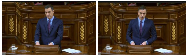
Imagen 43. Gesto adaptador.

Pedro Sánchez ajusta los folios por arriba, por abajo y por los laterales. Este gesto adaptador está relacionado con el manejo de las emociones, parece que la repetición de este movimiento le ayude a concentrarse. Ladea ligeramente la cabeza a izquierda y derecha, da la impresión de que busque conectar con los diputados teniendo siempre presente el contexto en el que se encuentra.