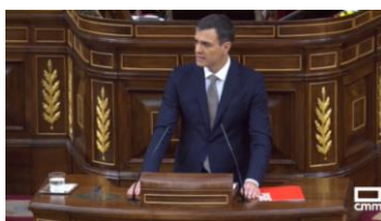
Imagen 1. “Lo importante de la comunicación es escuchar lo que no se dice” (Peter Drucker).

Pedro Sánchez se presenta ante la Cámara del Congreso vestido con un traje azul marino (pantalón Slim fit y americana Classic Slim). El corte de ambas prendas subraya su figura. La chaqueta abraza el cuerpo igual que el pantalón que debe quedar ceñido. La camisa blanca contrasta con la formalidad del traje. La corbata, en tono gris topo, pasa desapercibida. Según el protocolo para este acto su uso es obligatorio. Se trata de un estilismo moderno, aunque formal.