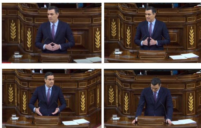
Imagen 35. Fuente: Congreso de los diputados. (2020). Defiende la capacidad de su partido para afrontar esta nueva etapa.

A lo largo del discurso el ritmo va acelerándose, las manos acompañan el mensaje y colocándolas en ojiva afirma que la derecha ha perdido las elecciones y también perderá la votación. De forma rápida y escueta enumera los puntos de su programa que generan más enfrentamientos políticos (reforma laboral, social y económica) colocando las manos a la altura del pecho. Modifica su postura según la respuesta que recibe de sus señorías, muestra las manos abiertas con las palmas hacia arriba, las agita acaloradamente, señala, suben, bajan y al final, como en otras ocasiones, terminan donde empezaron, apoyadas en el atril buscando el descanso del guerrero.