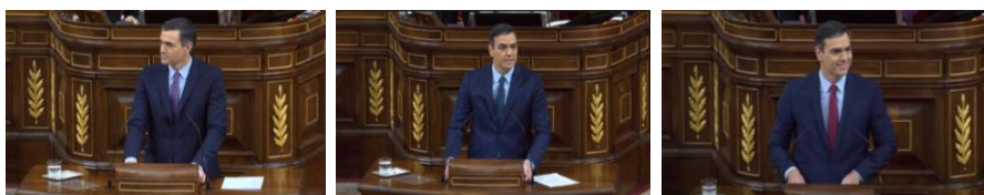
Imagen 25. Indumentaria del candidato en las tres sesiones plenarias de investidura.

Para la sesión del tercer día (07/01/2020) escoge una corbata roja, el color corporativo de su partido. El rojo simboliza fuerza y pasión y es toda una declaración de confianza.