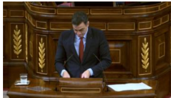
Imagen 62. Fuente: Congreso de los diputados. (2020). “No forcemos a la ciudadanía a tomar partido en un debate que es puramente científico”. Gesto regulador.

Encogiéndose de hombros con un gesto de estupor que dibuja en su boca en forma de “u” invertida Sánchez manifiesta su extrañeza ante la posibilidad de que, comentarios sin fundamento, obliguen a la ciudadanía a posicionarse sobre algo cuyo contenido es más científico que político.