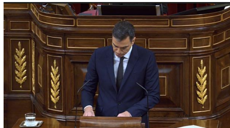
Imagen 81. Transmite enfado contenido.

El ambiente refleja el enfrentamiento político que existe entre los diferentes grupos de la Cámara. El lenguaje corporal y el mensaje de Sánchez muestran coherencia. Su rostro expresa un enfado contenido, aprieta los labios, marca los músculos cigomáticos mayores y frunce el ceño.