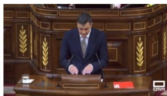
Imagen 13. “Quiero remarcar que es usted Sr. Rajoy quien nos ha traído hasta aquí”. Gestos ilustradores.

Con firmeza señala con ambos dedos índices el estrado que ocupa repitiendo la necesidad de un cambio y “en consecuencia” (expresión que repite una y otra vez...) la necesidad de que tome las riendas el partido que representa, el partido socialista obrero español (engola la voz). Pausa. Aplausos.