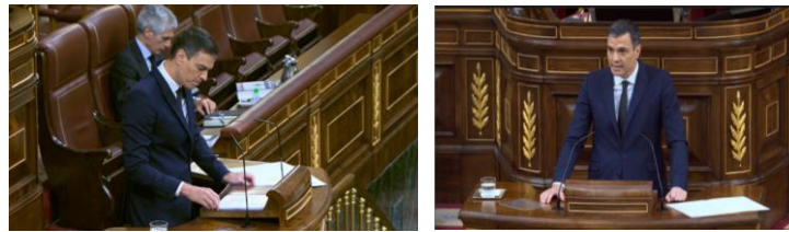
Imagen 83. Se apoya en el atril y revisa sus notas.

El atril es un punto de apoyo, vuelve a él cada vez que toma aire, repasa sus notas y se enfrenta de nuevo a la Cámara.