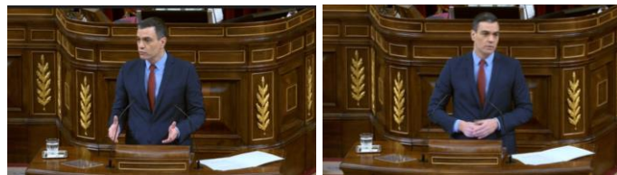
Imagen 76. Fuente: Congreso de los diputados. (2020). “Es necesario dejar a un lado las políticas partidistas”. Gesto regulador.

El resultado de las medidas extraordinarias adoptadas es muy lento, y el presidente, dirigiendo su mirada de derecha a izquierda, manifiesta la necesidad de dejar las políticas partidistas a un lado.