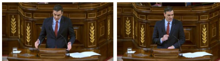
Imagen 50. “No solo hay que doblegar la curva si no que hay que tratar de evitar posibles olas y adelantarnos a futuras amenazas”. Gesto ilustrador.

Con el gesto ilustrador de las palmas hacia arriba afirma que el Estado social y democrático de derecho está garantizado pero que, al no poder descartar posibles rebrotes del virus, hay que mantener las medidas tomadas hasta ahora.