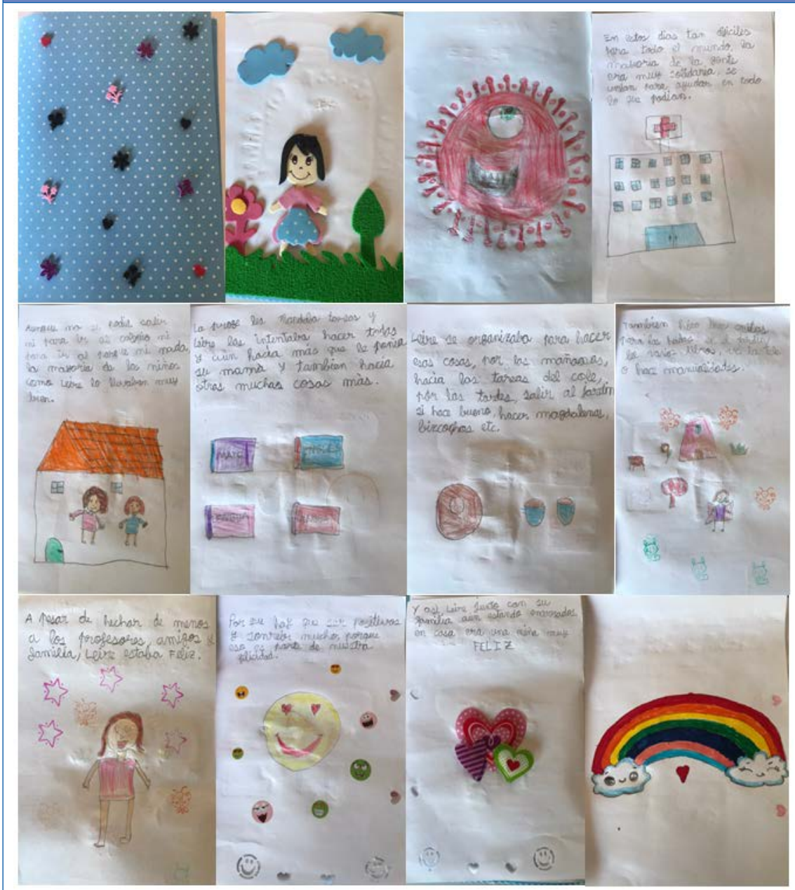
Figura 5. Cuento ilustrado premiado (Leire L., 7 años, Pontevedra)

En la Fig. 5 pueden ver y leer el cuento ganador, que recoge los contenidos anteriormente mencionados.