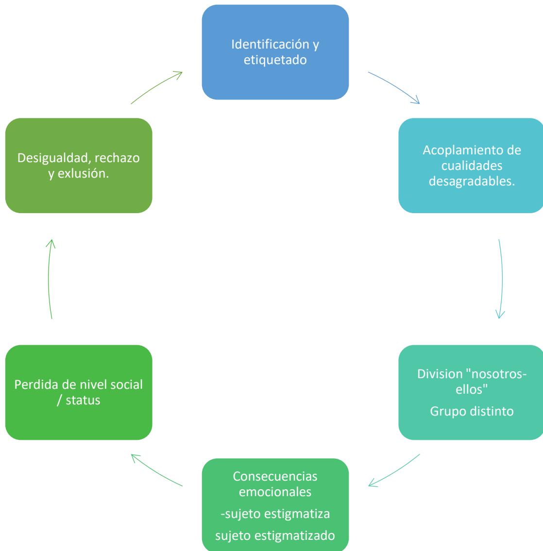
Imagen 1: Creación del estigma.