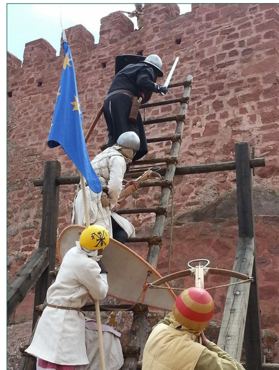
Figura 5. Asalto y defensa en el castillo. Edición 2014. Fuente: Rafael Jambrina