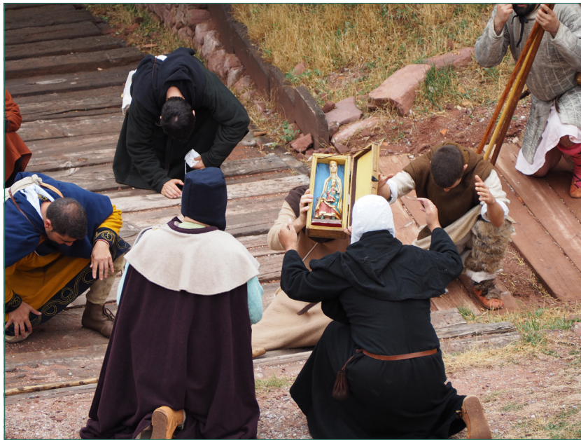
Figura 6. La Virgen es trasladada al interior del castillo tras el milagro.

Un milagro acontecido en las cercanías del castillo supondrá un conflicto entre las aldeas de Peracense y Rodenas, por hacerse con la talla aparecida (Figura 6).