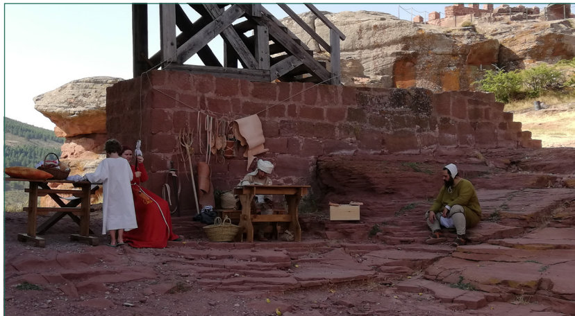
Figura 8. Viviendo la historia en el interior del castillo.