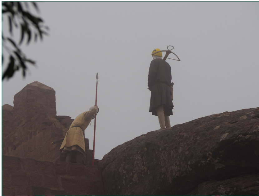
Figura 4. Guardias entre la niebla.