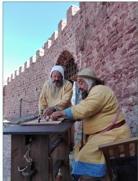
Figura 3. Punto de recepción de los participantes en el acceso al castillo.

Con las primeras luces del día, la paz del castillo se ha visto rota al alba por la llegada de un jinete. Venía por el camino de Daroca,