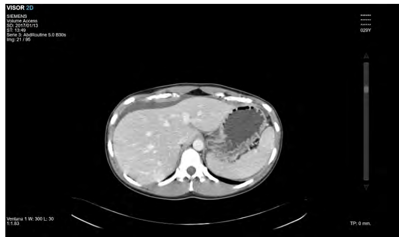
Figura 3. Presencia de líquido libre perihepático.