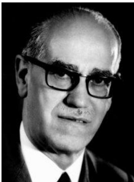
José María Lacarra y de Miguel*