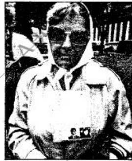
Su distintivo es un pañuelo blanco en la cabeza en el que algunas llevan escritos detalles del desaparecido

recidos, sino el problema mismo hasta la raíz.