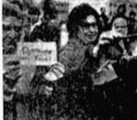
Forced women of the Plaza de Mayo: Where is my daughter? asks wife