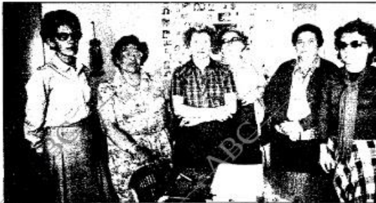
También las abuelas de niños desaparecidos han creado una asociación. Al fondo, las fotografías de los pequeños cuyo paradero es un doloroso enigma para estas mujeres

Con su aspecto de luchador cariado, su determinación de llegar a fondo, su ausencia total de miedo al rechazo a cualquier signo de int-