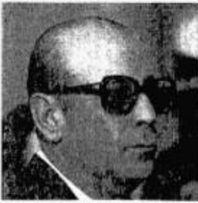
President Figueiredo of Brazil: Challenged by a dynamic clergy