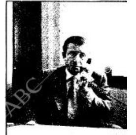
Aramburu: «Con un Gobierno militar no podemos prosperar»