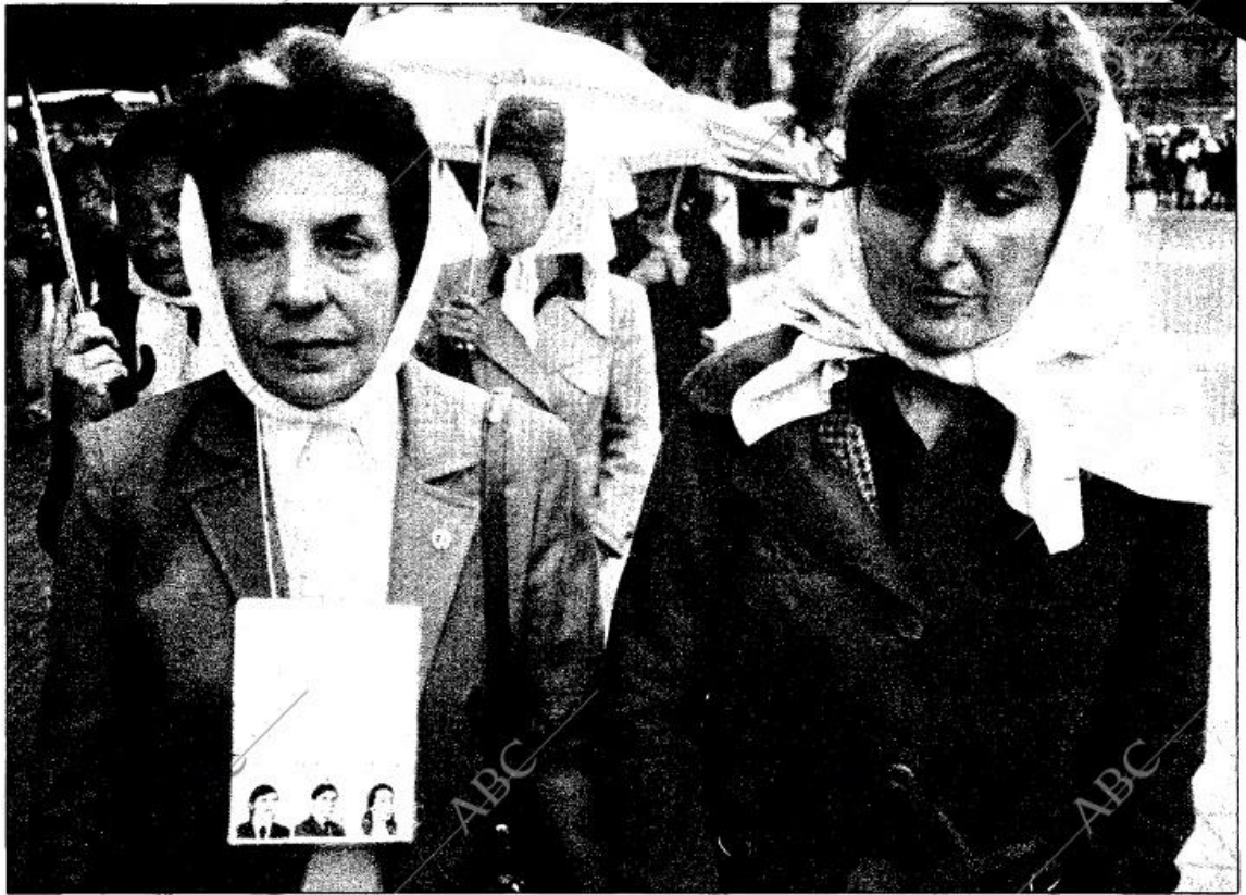
Dos madres describen el círculo en torno al monumento de Mayo. Es una manifestación patética y silenciosa. Muchas llevan colgado del cuello un tarjetón con los datos personales del hijo desaparecido, acompañados de su fotografía