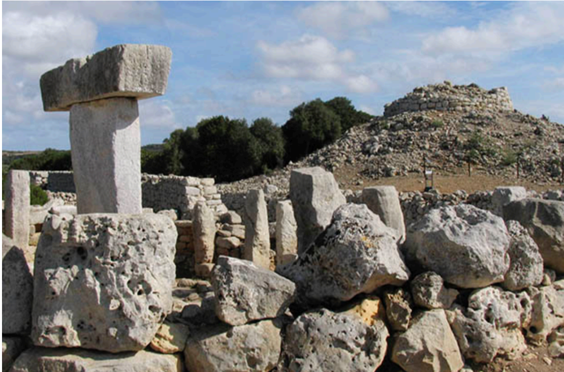
Poblado de Torralba d'en Salort.