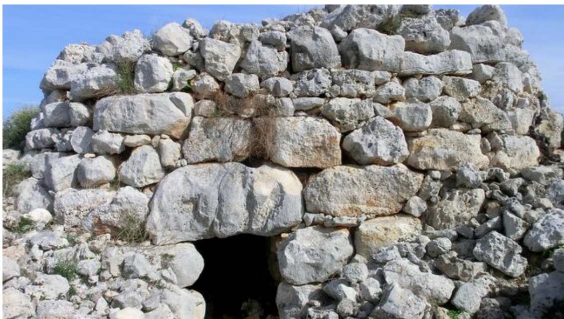
Naveta asociada al poblado de Sant Agustí.