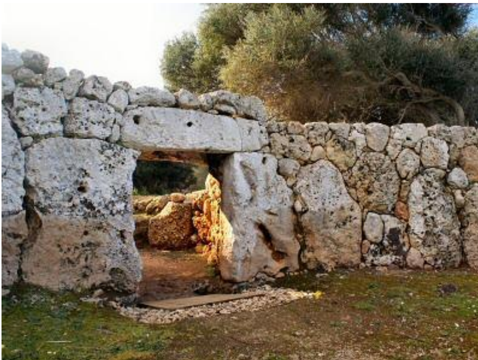
Entrada al pueblo amurallado de Son Catlar.