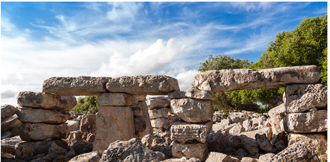
Monumento de na Corema de sa Garita.