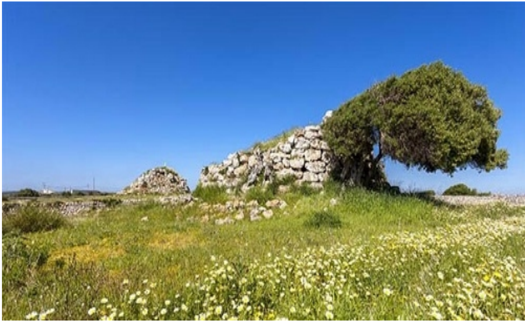
Talayots del Poblado de Montefi.