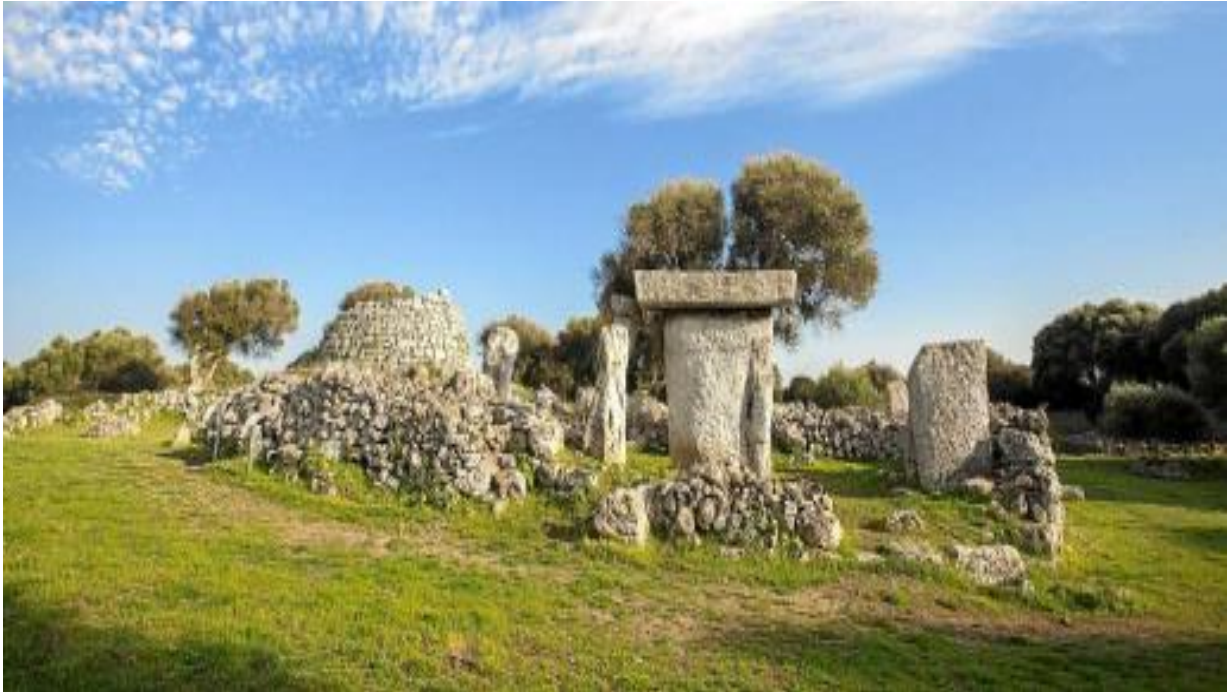
Poblado de Talatí de Dalt.