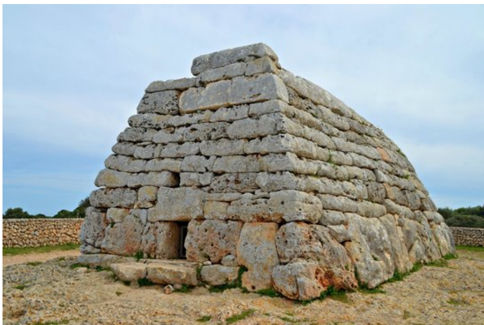
Naveta des Tudons.