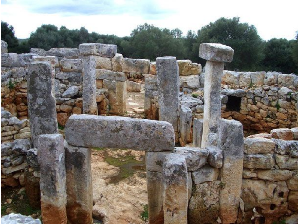
Poblado de Torre de'n Galmés.