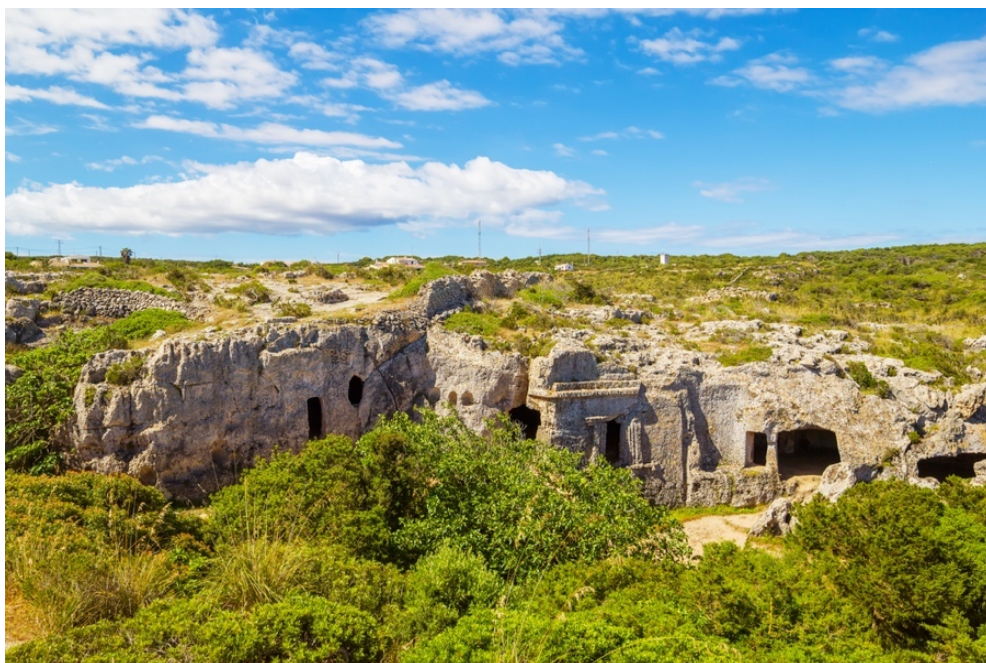
La necrópolis de Cala Morell.