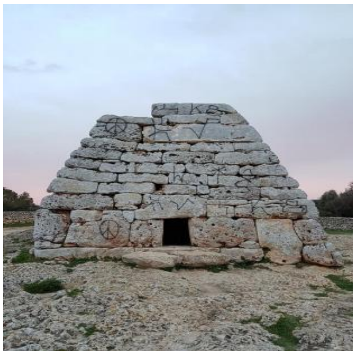
Imagen que hace referencia a las pintadas que realizadas en la Naveta des Tudons.