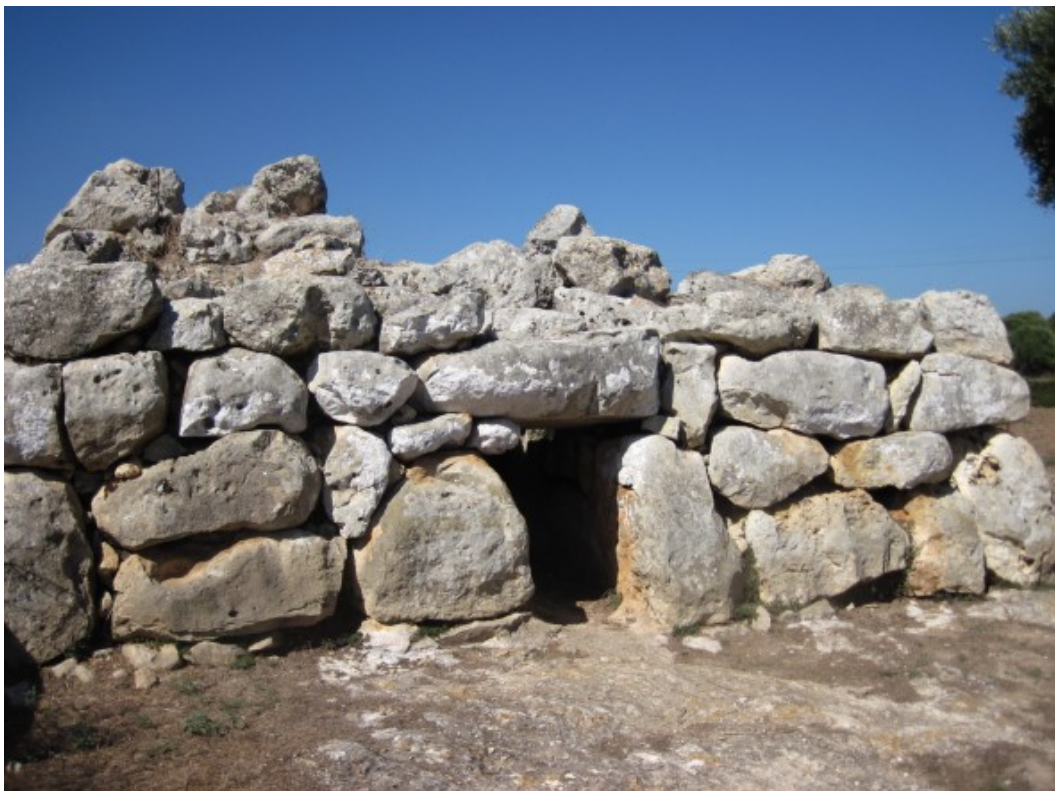
Naveta de Rafal Rubí.