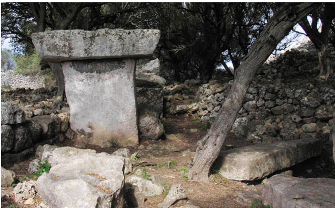
Taula del poblado de Torrellafuda.