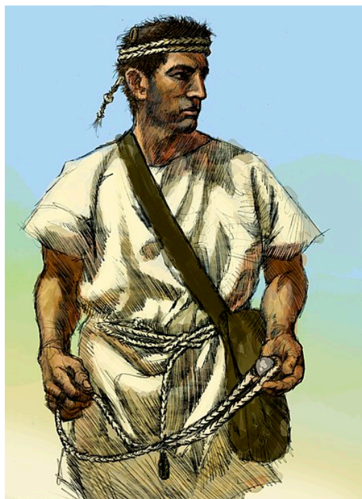
Recreación idealizada de un hondero talayótico balear.