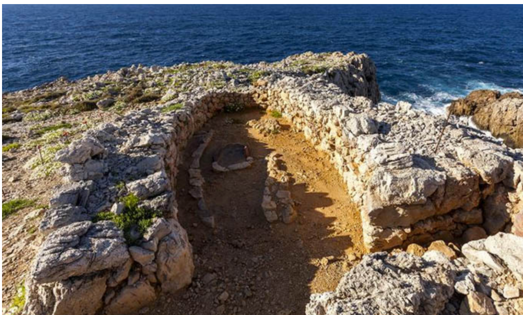
Imagen recuperada de https://www.menorcadiferente.com/mapas-de-menorca/

Asentamiento costero de Cala Morell. Fuente Descubre Menorca . Imagen recuperada