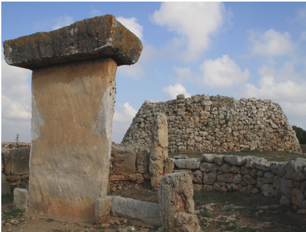
Recinto Taula del poblado de Trepucó.