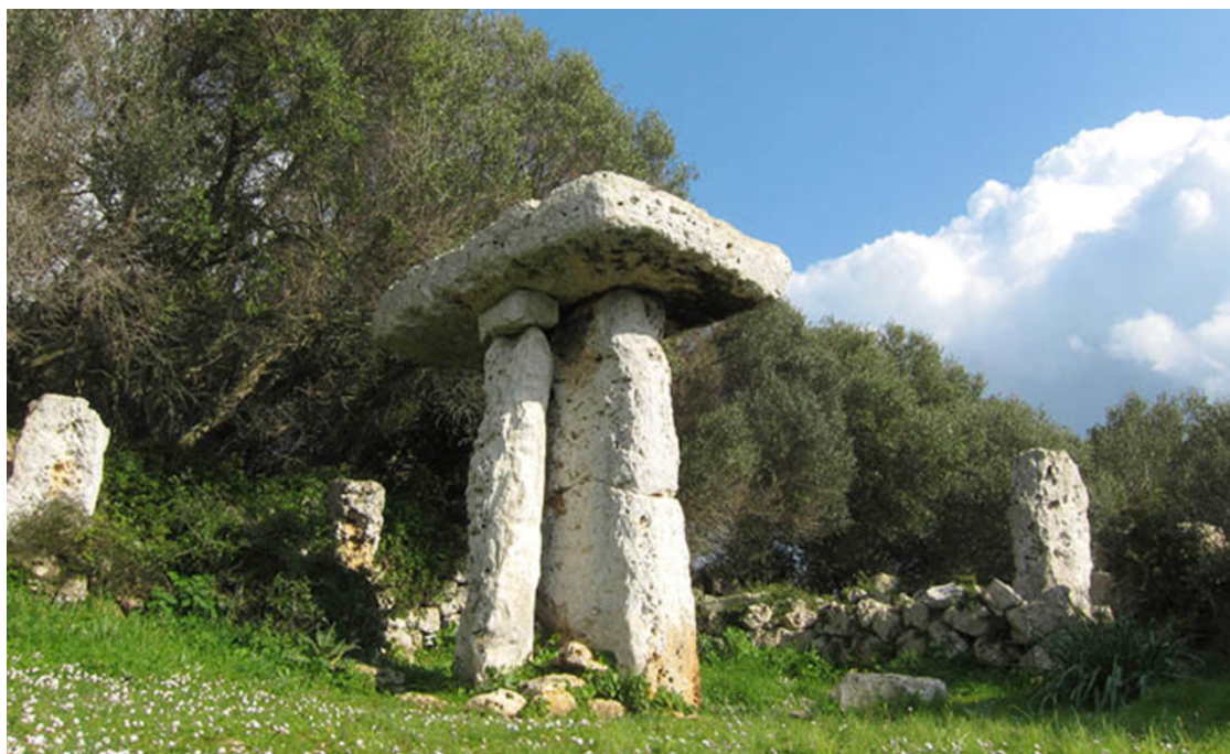
Taula del poblado de Torretrencada.