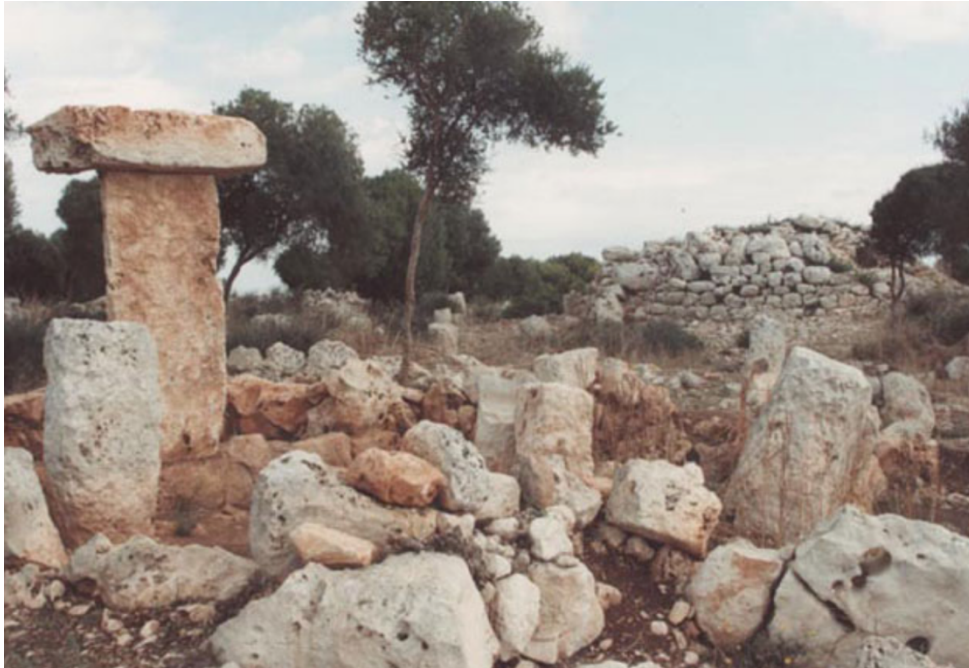
Recinto Taula del poblado de Binisafullet.