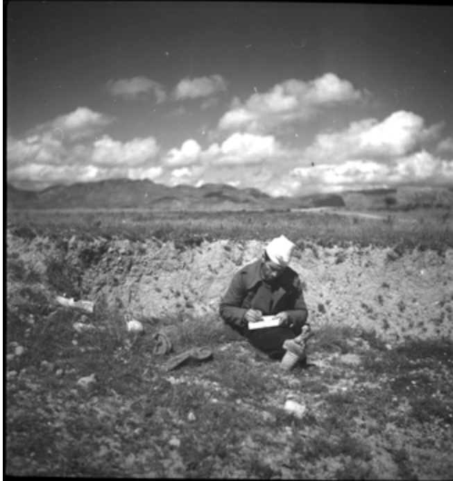
Imagen 5. Foto 024 de Kati Horna. Sin descripción disponible de la fotografía. Por el correlato sabemos que es un miliciano de la división Ascaso en el campo de Banastas-Carrascal.

posiciones ganadas, así como de las condiciones de lucha de las milicias, del Ejército republicano, para mantener a la población civil, lectora, no solamente en constante estado de información, si no también vinculada a través de las fotografías y de las crónicas fotográficas, de las acciones que ocurrían lejos de sus lugares.