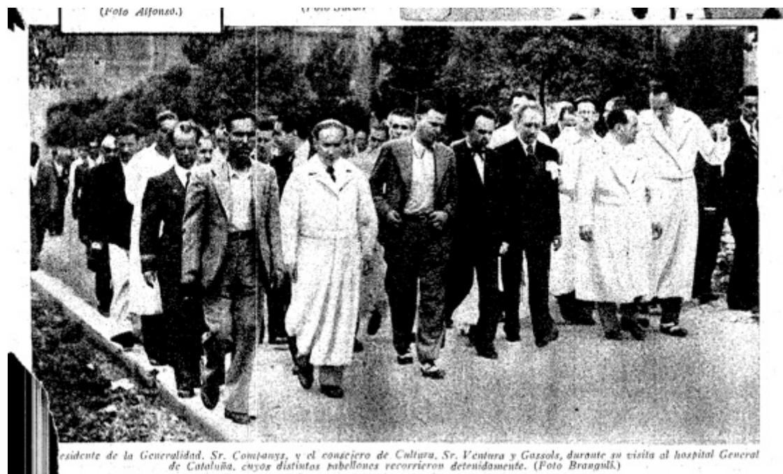
Recorte de la Edición de ABC , 12.08.1936, p 6.