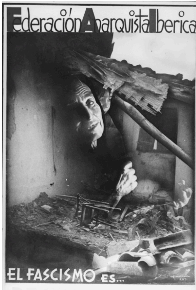
Foto 272 de Kati Horna. Sin fecha. Fotomontaje. Cartel de la FAI.