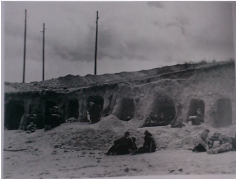
Soldados republicanos en búnkers. Ciudad Universitaria, Madrid. Febrero 1937.

El miliciano republicano, el soldado del Ejército Popular se mostró a través de estas imágenes como garante de la defensa de la República. Pero sobre todo, como miembro de la comunidad, en una cotidianidad que no le convertía en un personaje invulnerable y sin nombre. Se incluía dentro de los imaginarios, la reflexión de la alerta constante, desde una posición muy humana.