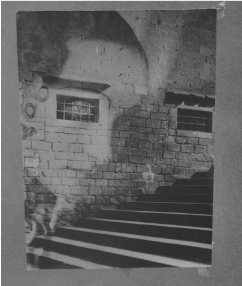
Fotomontaje