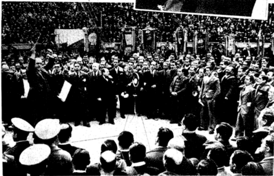
Los coros Clavé se sumaron también al homenaje rendido por Cataluña al Madrid heroico.

Edición de ABC, 14.03.1937, p 3. (3 de una serie de 3)