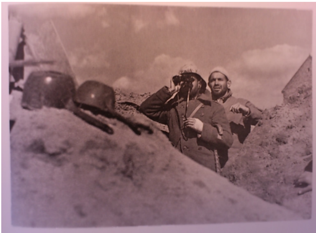
Soldados republicanos con binoculares. Frente de Jarama. Marzo 1937.