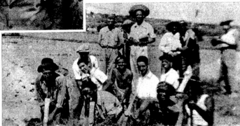
Los directores de las obras del ferrocarril Madrid-Vallencia, han felicitado a este grupo de obreros por su comportamiento ejemplar y por el máximo esfuerzo con que realizan su labor.