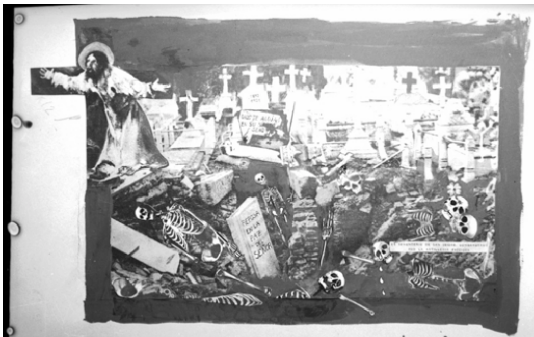
Foto 183 de Kati Horna. Fotomontaje