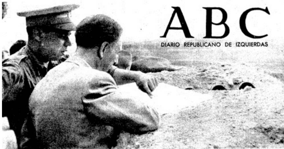
El presidente de la Generalidad de Cataluña ha visitado el frente de Aragón. En esta "foto", el señor Companys sigue en un plano la marcha de las operaciones, desde un parapeto del sector de Huesca.