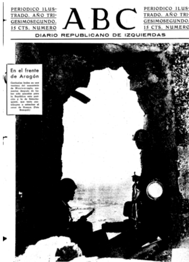
Imagen 4: Publicada el 7.10.1936 en ABC Madrid. Portada

En el frente de Aragón. Centinelas leales en una ventana del monasterio de Montearagón, momentos después de haber sido ganadas para la República esta posición y la de Estrechoquinto, que tanto contribuyen a estrechar el cerco de Huesca.