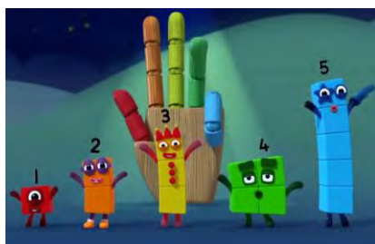
Figura 3. La "mano".

Los cinco primeros episodios de la segunda temporada sirven para introducir los números que quedan hasta el diez, incluido. Simplemente presentarlos sería un poco aburrido, además de poco idóneo desde el punto de vista didáctico, por lo que en cada episodio se trabajan más aspectos. Por ejemplo, cuando se presenta a Cinco aparece la "mano" para contar (Figura 3) y al presentar a Seis, se trabaja la subitización a partir de las configuraciones puntuales de un dado de seis caras. Con Nueve, vuelve a salir el tema de que es un número cuadrado, igual que Cuatro. Y uno de los momentos clave es la presentación de Diez, cuando canta "Yo soy diez unos... Yo soy una decena" que, obviamente, es un lost in translation en toda regla, pues en el original inglés se usa la misma palabra para diez que para decena: "I'm ten ones... I'm one ten".