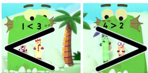
Figura 6. Signos "<" y ">" en Numberblocks 3x02, Blockzilla .

La introducción de los signos de comparación ">" y "<" (Figura 6) puede venir motivada porque hay estudios que apuntan a que su introducción junto con el signo "=" fomenta una comprensión relacional de este, en lugar de una meramente operacional (Gilmore, Göbel e Inglis, 2018; Hattikudur y Alibali, 2010). Ahora bien, hemos de destacar que estos trabajos contaron con muestras de alumnado de tercer y cuarto grado. Además, en la investigación que describen Hattikudur y Alibali (2010), a la hora de codificar las tareas como correctas o incorrectas, no se tuvo en cuenta la confusión típica de los alumnos al escribir el signo para un sentido o para el otro, siempre y cuando lo hubiesen definido bien. A nuestro juicio, por tanto, no se trata de una cuestión únicamente simbólica, sino de trabajar sentencias numéricas desde un punto de vista relacional. Y, desde esta perspectiva, si los niños no tienen todavía la madurez suficiente, basta con dejar el trabajo simbólico que aparece de fondo en Numberblocks , y centrar la atención en el lenguaje verbal.