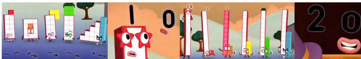
Figura 5. Fotogramas de Numberblocks 5x02 On your Head y 5x11 Twenty , en donde aparece Cero.

Más allá de los contenidos matemáticos, hay otros aspectos de la serie que todavía le aportan más valor. Y es que se nota que se ha reflexionado en torno a la cuestión de género. Uno, Tres, Cinco, Seis y Diez son chicas; mientras que Dos, Cuatro, Siete, Ocho y Nueve son chicos. Cero, por otro lado, es chica, y lo mismo ocurre con todas las potencias de 10 que aparecen. Los bloques femeninos, además, ni están caracterizados de color rosa ni con actitudes convencionalmente "modositas". Por ejemplo, Once es chica y se muestra hábil en el terreno deportivo. A este respecto, son muy interesantes las reflexiones en torno al género de los bloques en la comunidad de fans https://numberblocks.fandom.com . En dicha comunidad, además, los fans contribuyen con diseños propios para nuevos numberblocks (hay diseños para Pi, por ejemplo).