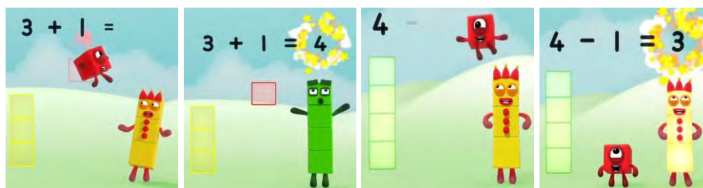
Figura 1. Presentación de Cuatro. Fuente: Numberblocks, 1x06.

Si la suma de bloques se presenta como el añadido o agregación de un bloque a otro para formar uno nuevo, la resta de bloques debería mostrarse como la sustracción de un bloque a uno de ellos. Y, efectivamente, es así como se introduce. En la Figura 1 vemos el momento en que se introduce el 4 como 3+1=4 , donde también observamos que 4-1=3 .