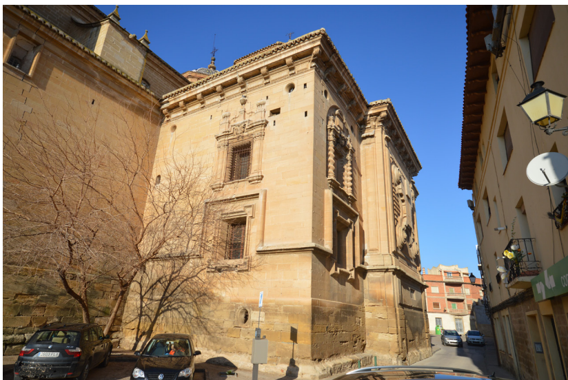
Fig. 1. Alcañiz (Teruel). Iglesia de Santa María la Mayor. Capilla de la Soledad. Exterior.