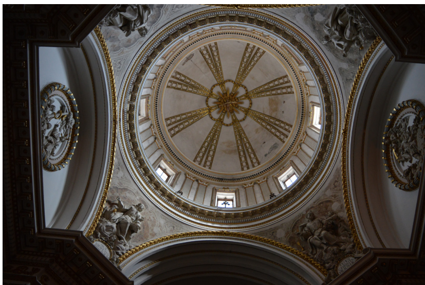
Fig. 2. Alcañiz (Teruel). Iglesia de Santa María la Mayor. Capilla de la Soledad. Interior.