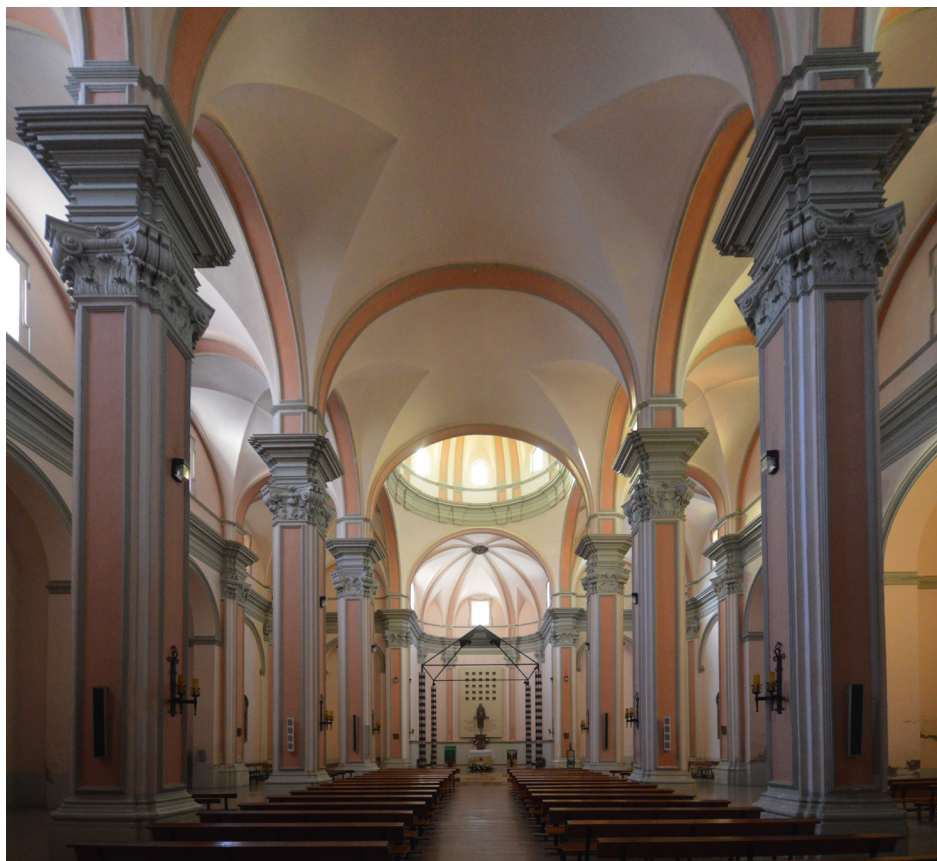
Fig. 6. Alcañiz (Teruel). Iglesia de San Francisco. Interior.