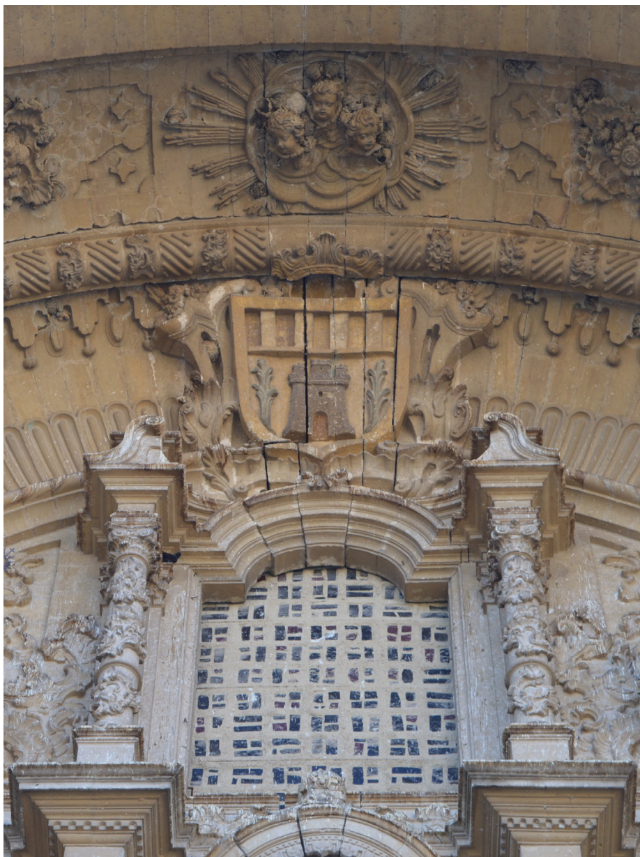
Fig. 9. Alcañiz (Teruel). Iglesia de Santa María la Mayor. Exterior. Escudo de armas de la ciudad.