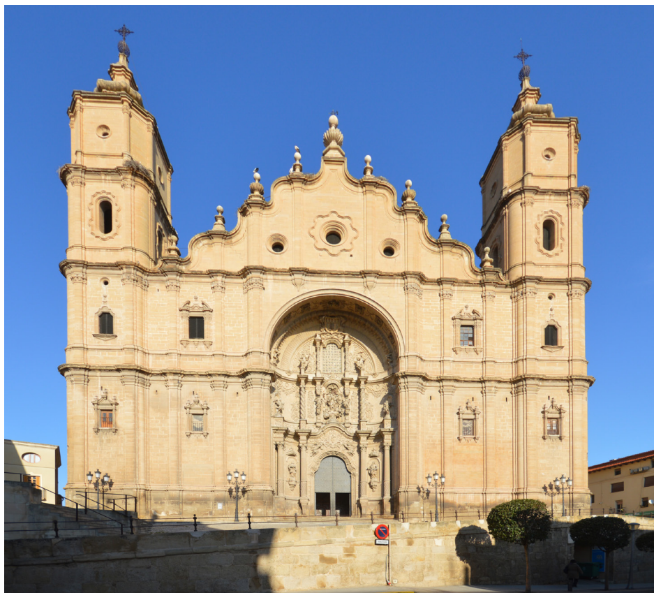
Fig. 3. Alcañiz (Teruel). Iglesia de Santa María la Mayor. Exterior.