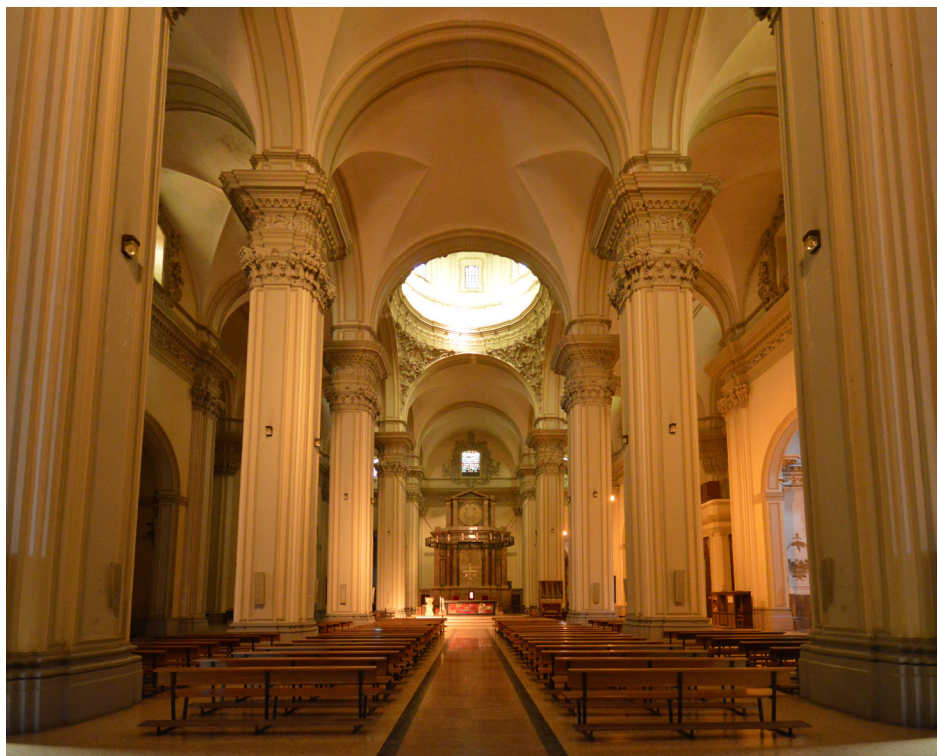
Fig. 4. Alcañiz (Teruel). Iglesia de Santa María la Mayor. Interior.