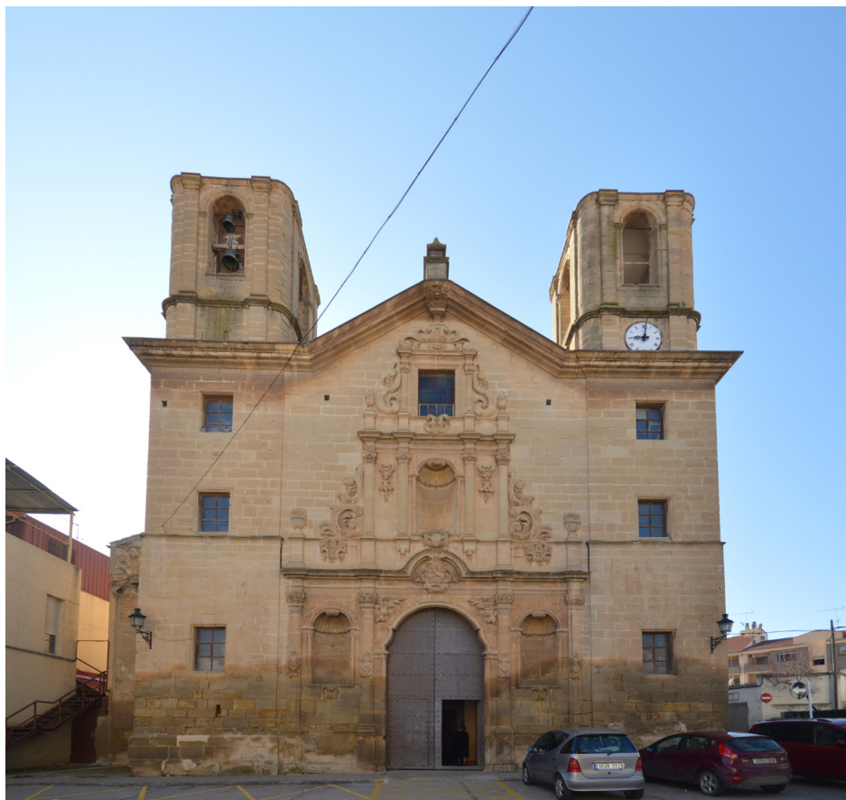
Fig. 5. Alcañiz (Teruel). Iglesia de San Francisco. Exterior.