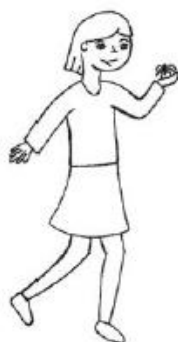
Vanesa con 5 años