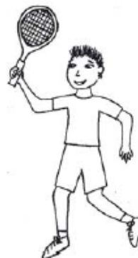
Jesús con 10 años